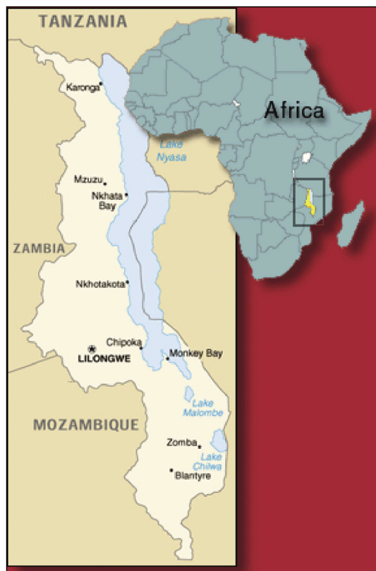
Mynd 1. Malaví og Monkey Bay (31).

algengi HIV smits sé um 15% og meðallífslíkur í landinu eru aðeins 38 ár (1, 2).