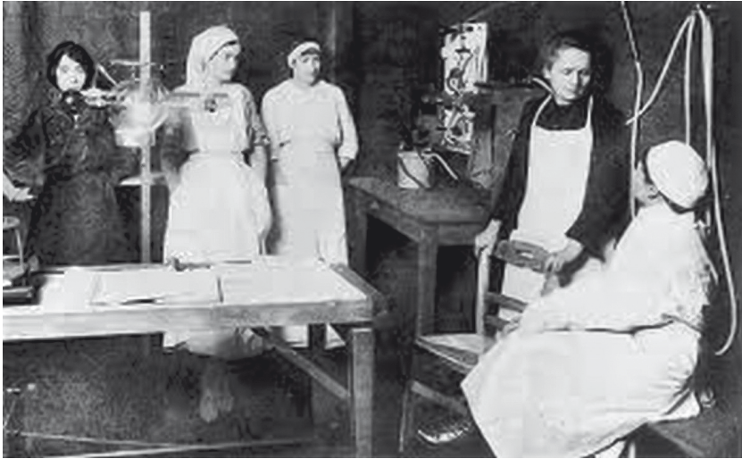
Ryc. 6. Maria Skłodowska-Curie w czasie szkolenia personelu medycznego o zastosowaniu promieni X w medycynie.