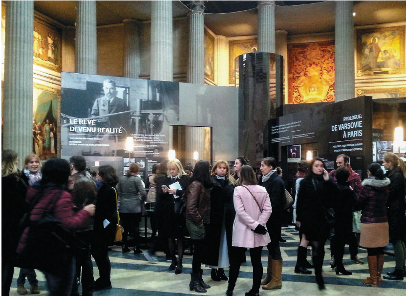
Ryc. 3. Fragment wystawy „Maria Curie – kobieta w Panteonie”.