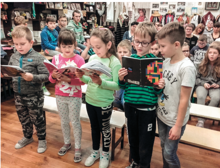
Ryc. 11. Uroczystości urodzinowe Noblistki w Szkole Podstawowej z Oddziałami Integracyjnymi w Jagodnem, woj. Świętokrzyskie.