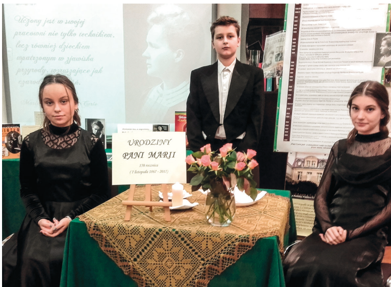
Ryc. 10. Uroczystości urodzinowe Noblistki w Szkole Podstawowej z Oddziałami Integracyjnymi w Jagodnem, woj. świętokrzyskie.