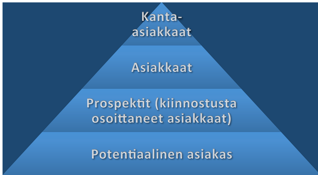
Kuvio 1. Uskollisuuspyramidi (Ylikoski 2001, 181)

Kanta-asiakas on esimerkki tyytyväisestä asiakkaasta, mutta kanta-asiakassuhteista on huolehdittava, sillä mikään suhde ei toimi itsestään. Yritykselle tulee huomattavasti halvemmaksi pitää kanta-asiakkaita kuin hankkia uusia asiakkaita. Molempia tarvitaan, mutta kiinteän kanta-asiakaskunnan saaminen on vankka perusta yrityksen toiminnalle. (Brännare, Kairamo, Kulusjärvi & Matero 2005, 114.) Kanta-asiakkaat takaavat myyntiä ja mahdollisesti suosittelvat yritystäsi heidän läheisilleen (HelpOnClick 2015).