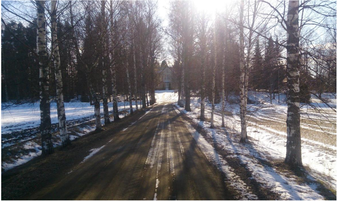
KUVA 3. Porkkalan kartanolle johtavaa koivukujaa

Tilan alueella olevilla metsäalueilla on runsaasti suojelukohteita, jotka lisäävät metsämaan monimuotoisuutta, kuten suppasoita, luonnontilaisia puroja, lehmusmetsiköitä, paahderinteitä ja muita suojeltuja alueita. Tilalla suositaan mahdollisuuksien mukaan metsätaloudessa jatkuvan kasvatuksen periaatteita. Porkkalan kartanon periaatteena on vanha metsänhoidon tapa eli, jos puuyksilöllä on tilaa kasvaa metsässä, annetaan sen kasvaa rauhassa, olipa kyseessä mikä puulaji tahansa. Tilan metsät ovatkin hyvin runsaslajisia ja monimuotoisia. Sama käytäntö vallitsee maatalouspuolella, jossa suositaan reunavyöhykkeitä kuten pellon ja tien pientareita, ojien reunoja ja metsäsaarekkeitä, minkä ansiosta kasvillisuus on erittäin runsasta. Alueella on suoritettu lukuisia hoito-ohjelmia liittyen esimerkiksi perinnebiotooppeihin, reunavyöhykkeisiin sekä maisemankehittämiseen ja hoitoon. Lisäksi alueelle on laadittu vapaaehtoinen luonnonhoitosuunnitelma Helsingin yliopiston toimesta, jossa on tarkasti lueteltuna kaikki alueella esiintyvät kasvit, hyönteiset, eläimet jne. Suunnitelmaan on myös eritelty hoitotoimenpidesuosituksia alueelle. (Rikala 2016.)