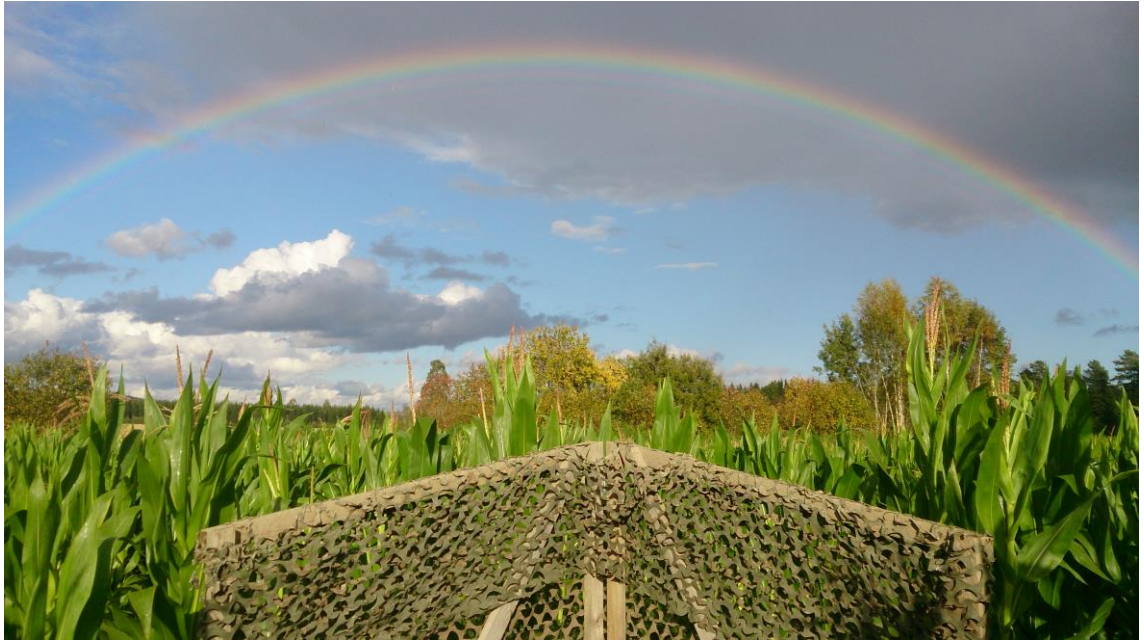
KUVA 6. Monimuotoista maisemaa

tehty valtava määrä suojaistutuksia. Alueelle on istutettu mm. 70000 kuusentainta ja tuhansia pensaita sekä tehty kosteikkoja ja riistapeltoja. Lisäksi metsänkasvatuksessa suositaan lehtipuita. Kaikki nämä toimet ovat samalla lisänneet luonnon monimuotoisuutta ja edistäneet riistan elinolosuhteita.