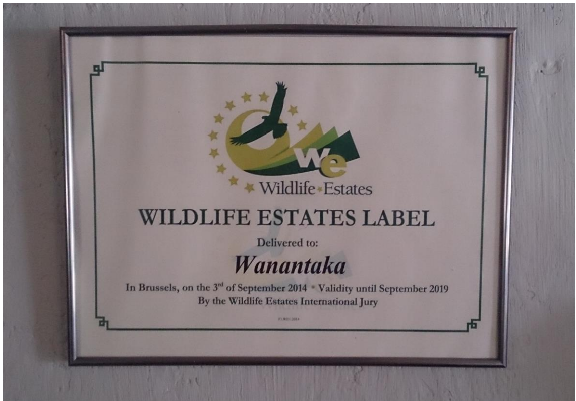
KUVA 7. Wanantaan kartanolle myönnetty Wildlife Estates -tunnus

Kartanon tulevaisuuden tavoitteena on olla maan johtava tila monimuotoisuuden ja kestävän maatalouden kehittäjänä, ja toimia inspiraation lähteenä muille tiloille Suomessa. Lisäksi on suunnitteilla tehdä kartanosta omavarainen energiatuotannon suhteen siirtymällä aurinkoenergian ja hakelämmön käyttöön. (Ehrnrooth, G. 2016.)