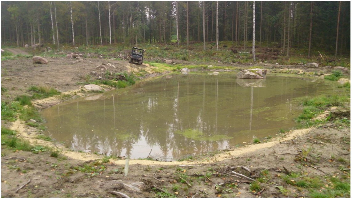
KUVA 4. Vastaperustettu kosteikko