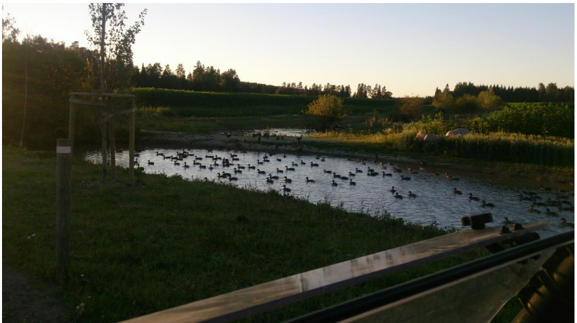
KUVA 5. Kosteikko ja sorsia

Wanantaan kartano on panostanut huomattavasti luonnon monimuotoisuuden kehittämiseen ja se onkin monella tavoin edelläkävijä luonnon monimuotoisuusajattelussa ja kestävän metsästyksen kehittäjänä (kuva 6). Riista ja luonto huomioidaan kokonaisvaltaisesti kaikissa tilalla tehtävissä toimenpiteissä. Erityisesti riistanhoitoon on panostettu paljon ja riistanhoitotyöt ovat tärkeä osa kartanolla tehtävistä töistä. Riistan hyväksi on