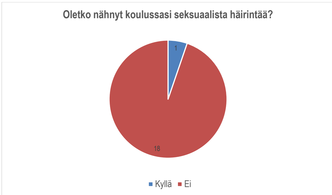
KUVIO 3. Palautekyselyn oppitunnin aiheen ajankohtaisuus kokemusten perusteella.

Oppituntimme päätaavoitteena oli seksuaalisen häirinnän tunnistaminen esimerkiksi koulussa, sekä antaa kohderyhmälle konkreettisia keinoja puuttua siihen. Saamamme kirjallisen ja suullisen palautteen perusteella oppitunnille osallistuneet pojat kokivat opetettavan aiheen hyödylliseksi ja saaneensa keinoja seksuaalisen häirinnän tunnistamiseen ja siihen puuttumiseen. Pidemmän aikavälin tavoitteena oli seksuaalisen häirinnän väheneminen, jota emme pysty projektin puitteissa arvioimaan, koska tuloksien näkyminen tässä tapahtuu vasta vuosien kuluessa. Tunnin alussa olleesta koskettamistehtävästä emme kysyneet palautetta lomakkeessa, joten emme osaa sanoa tarkkaan, mitä mieltä pojat olivat siitä. He kyllä koskettivat toisiaan, mutta monilla se meni enemmän läpsimiseksi. Kysyessämme heiltä miltä koskettaminen tai kosketus tuntui, emme saaneet kunnollisia vastauksia. Palautteen perusteella oppituntia voisi kehittää tekemällä liikennevalo-harjoituksesta vielä haastavamman, sillä niin moni koki sen helpoksi ja pojat huomasivat tapausesimerkeistä häirinnän tai väärän toiminnan melko helposti. Osa vastaajista mainitsi oppituntia häirin-