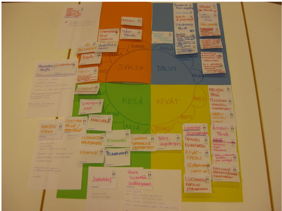
Kuvio 8. Työpaja III:n tuotos: Wilhelmiinan pihan vuosikello (Katarina Ahro 2015)

Työpajassa III tavoitteena oli suunnitella sitä, kuinka yhteisö haluaa pihaa käyttää. Tuotoksena oli Wilhelmiinan sisäpihan vuosikello. Vuosikelloon saatiin koottua runsaasti neljän eri vuodenajan kohdalle sellaisia tapahtumia ja juhlapäiviä sekä vuodenvierailuun liittyviä, luonnossa ja pihalla ajankohtaisia asioita, jotka voisivat näkyä Wilhelmiinan sisäpihalla.