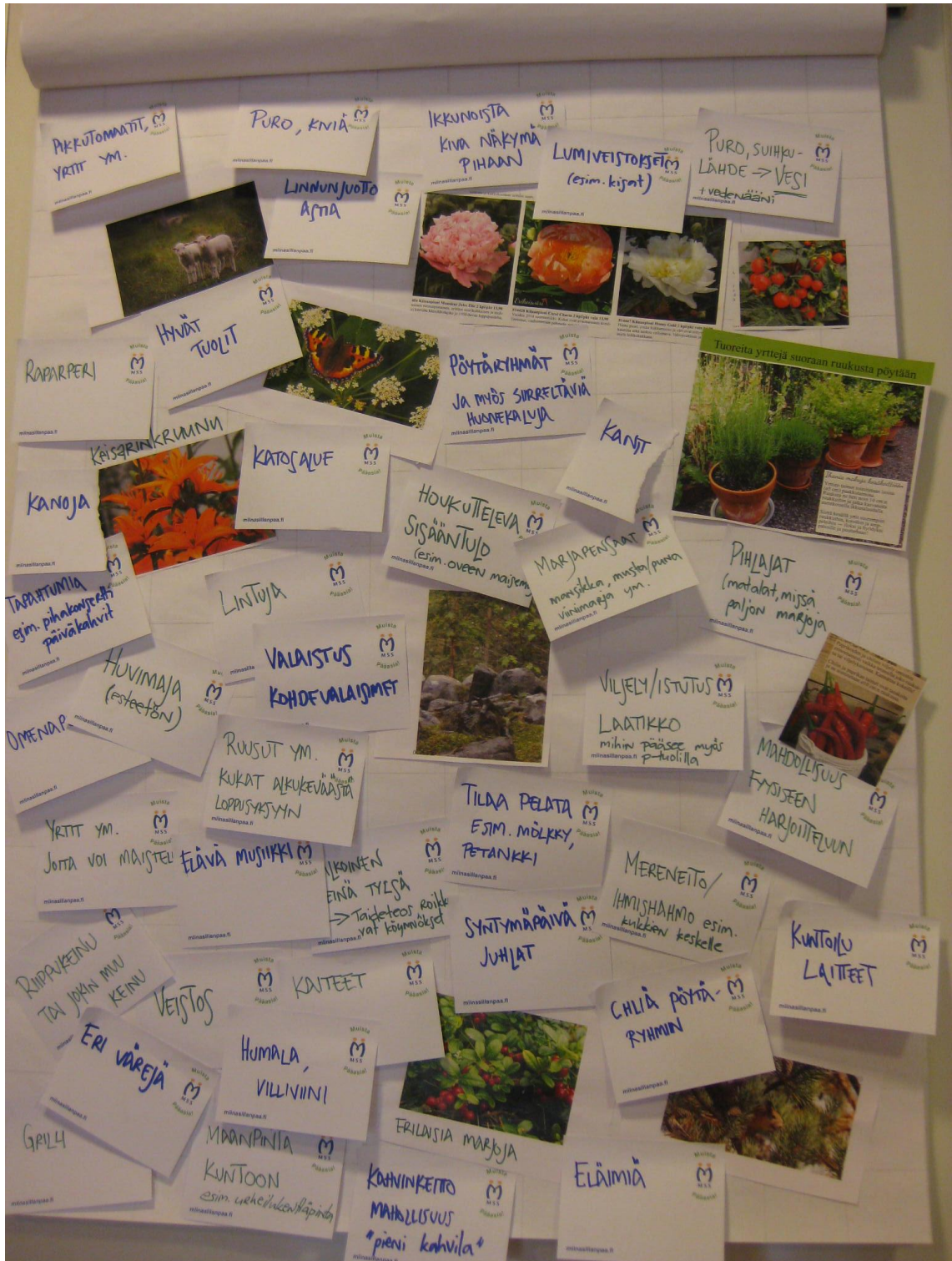
Kuvio 3. Työpaja I:n tuotos 1: Millainen piha vastaa yhteisön toiveisiin ja tarpeisiin? (Katarina Ahro 2015)