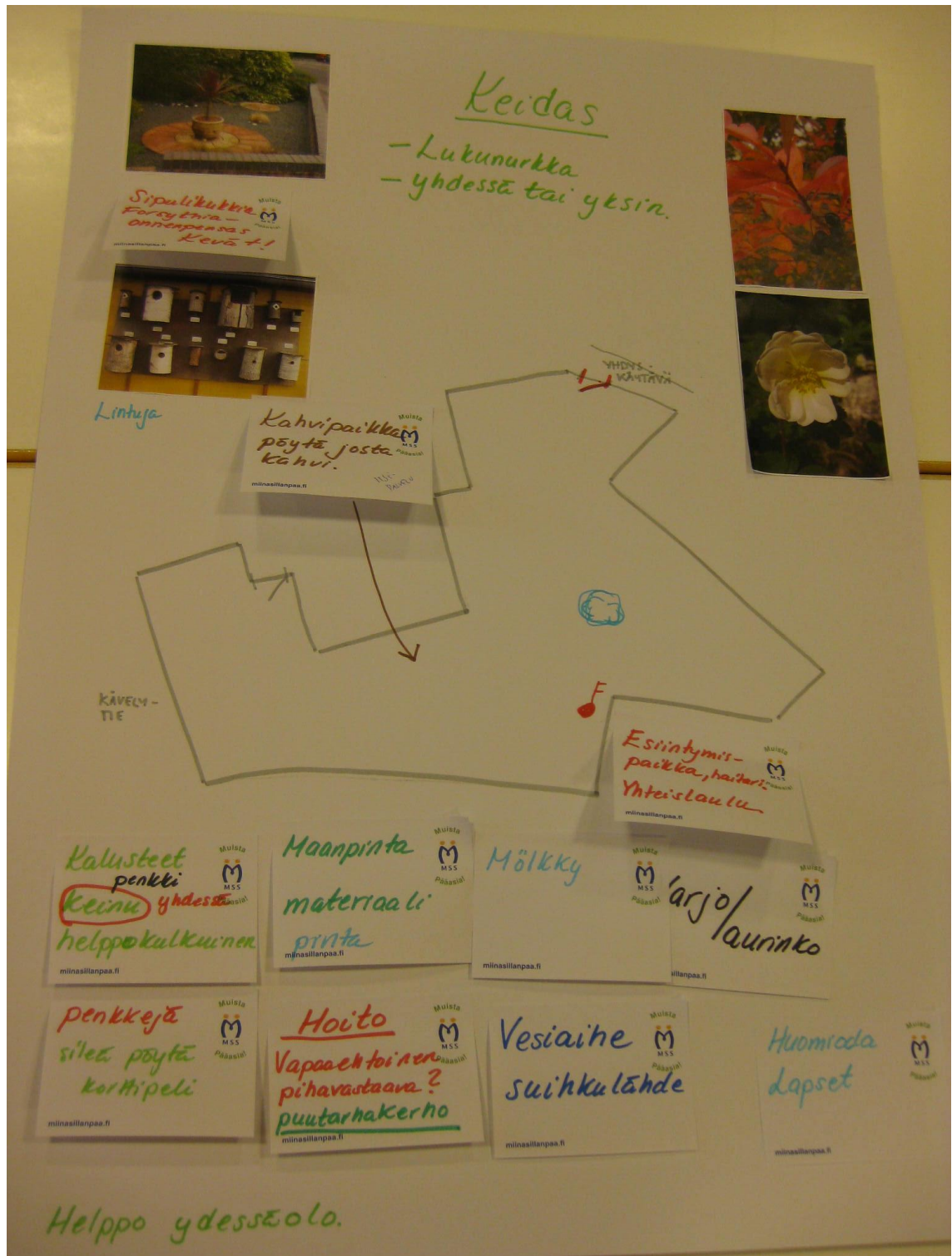
Kuvio 6. Työpaja II:n tuotos 2: Wilhelmiinan pihasuunnitelma, teemana "Pihalla yhdessä ja itsenäisesti" (Katarina Ahro 2015)

Koska tiedossa oli, että varsinainen viheraluesuunnitelma tulee alan ammattilaiselta, joka osallistui yhteiskehittelyyn, pihasuunnitelmia ei ollut syytä työstää tarkemmalle