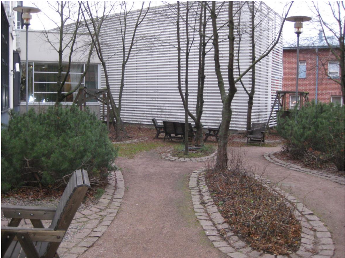
Kuvio 1. Wilhelmiinan sisäpiha joulukuussa 2014.

Sisäpihaprojektin omistaja on Wilhelmiina Palvelut Oy:n toimitusjohtaja, joka toimi myös opinnäytetyön ohjaajana toukokuuhun 2015 asti. Wilhelmiinan lisäksi sisäpihaprojektissa on mukana Miina Sillanpään Säätiö. Säätiön tavoite on luoda projektin myötä malli ja sen pohjalta julkistettava yleishyödyllinen opas, jota voi vapaasti hyödyntää vastaavissa ikääntyneiden asumispalvelukeskusten piha-alueiden uudistamishankkeissa. Ikäinstituutti on Miina Sillanpään Säätiön kumppani toimintamallia esittelevän tutkimusjulkaisun tekemisessä. Säätiön ja Ikäinstituutin intressi liittyy erityisesti sisäpihaprojektissa mallinnettavaan prosessiin, jossa yhteisö osallistuu arjen ympäristönsä suunnitteluun ja samalla ympäristössä tapahtuvan toiminnan kehittämiseen yhdessä eri verkostojen kanssa. (Wilhelmiina 2014b.)