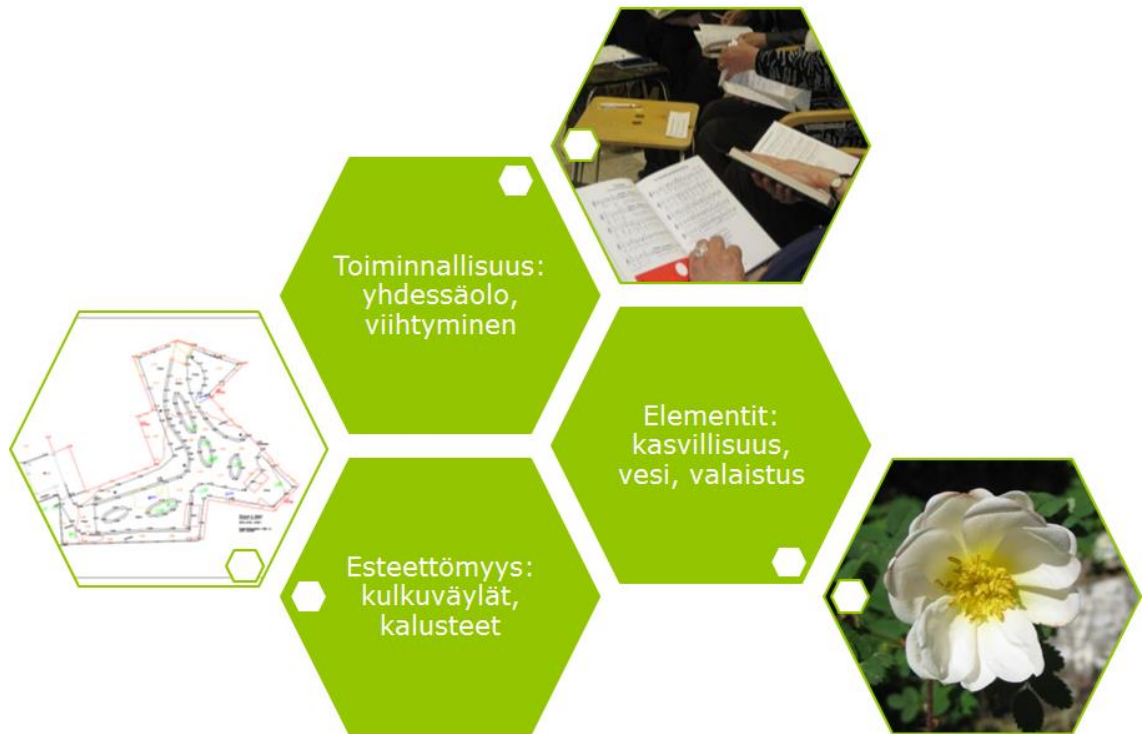
Kuvio 7. Synteesi Wilhelmiinan pihasuunnitelmista (Katarina Ahro 2015)

tasolle. Fasilitaattori koosti kahdesta pihasuunnitelmatuotoksesta synteesin, jonka tarkoitus oli tiivistää sisäpihaprojektin ohjausryhmän käyttöön yhteiskehittelyssä tuotetut pihasuunnitelmaan liittyvät ajatukset.