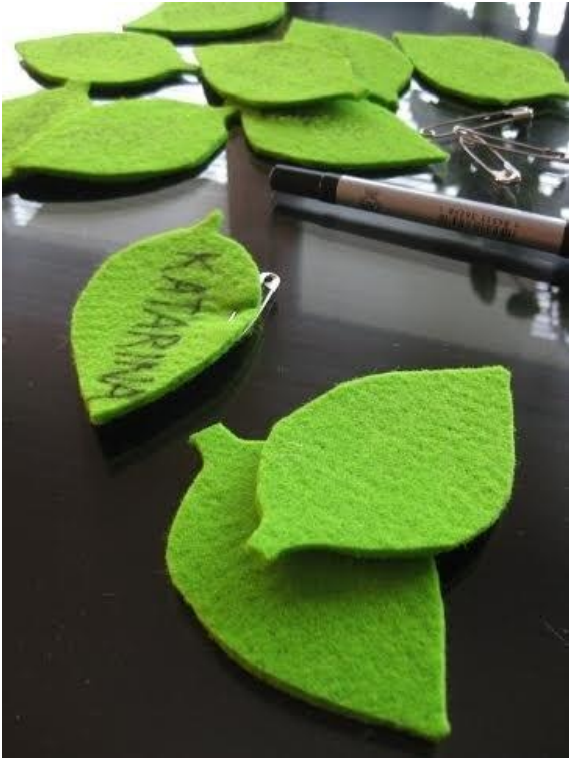
Kuvio 2. Työpajojen osallistujat saivat samanlaiset nimikyltit (Katarina Ahro 2015)

Kahdessa ensimmäisessä yhteiskehittelytyöpajassa esiteltiin Wilhelmiinan sisäpihaprojekti, opinnäytetyön osuus sekä siihen liittyvät tutkimus- ja kuvausluvut ennen työskentelyn aloittamista. Koska kolmannessa työpajassa mukana ei ollut enää uusia osallistu-