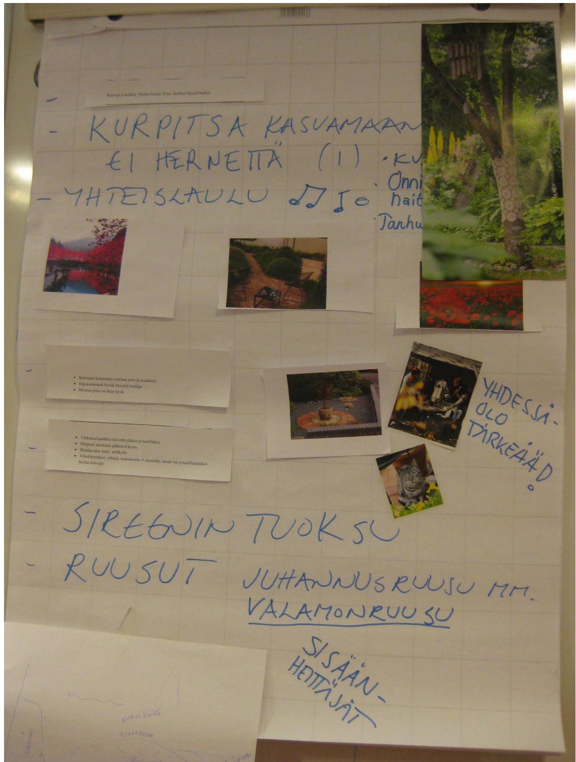
Kuvio 4. Työpaja I:n tuotos 2: Millainen piha vastaa yhteisön toiveisiin ja tarpeisiin? (Katarina Ahro 2015)

Tuotosten ideoissa toistuvat paljon samat asiat kuin sisäpihaprojektin puitteissa toteutetun ideakampanjan sadossa tai aikaisemmin vuoden 2014 aikana kootuissa ajatuk-