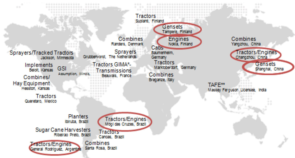
KUVA 1. AGCO -konserni

AGCO Power Oy on Nokian Linnavuoressa sijaitseva dieselmoottoritehdas, joka tällä hetkellä työllistää n. 700 henkilöä ja sen liikevaihto vuonna 2014 oli n. 266 000 000€. Tehdas valmistaa vuodessa n. 30 000 dieselmoottoria, joita käyttävät useat maailman johtavat traktori- ja maatalouskonemerkit. AGCO Power on myös edelläkävijä moottoritekniologiassa ja sen valmistavat moottorit täyttävät viimeisimmät päästövaatimukset Euroopassa ja Pohjois-Amerikassa. AGCO Power on osa AGCO -konsernia (KUVA 1), joka on maailman kolmanneksi suurin maatalouskonevalmistaja ja sen tuotteita myydään yli 140 maassa ympäri maailmaa. AGCO Power Oy:n tunnetuimpia tuotemerkkejä ovat mm.: Massey Ferguson, Fendt, Valtra ja Challenger.