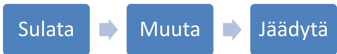
KUVIO 1: Lewinin muutosmalli

Yksi maailman tunnetuimpia muutosmalleja on Kurt Lewinin esittelemä jään sulamisen malli (unfreeze, move, refreeze). Lewinin malli on esitetty alla olevassa kuviossa (KUVIO 1).