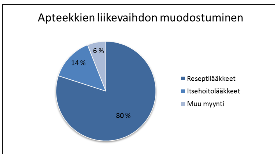
Kuvio 1: Apteekkien liikevaihdon muodostuminen (Santasalo & Koskela 2015)

Apteekkikauppa kuuluu terveys- ja hyvinvointialan erikoiskauppaan. Apteekkien liikevaihto muodostuu reseptilääkkeistä, itsehoitolääkkeistä ja muusta myynnistä, kuten sidetarpeista, perusvoiteista, hygieniatuotteista ja laihdutusvalmisteista. Muun myynnin, johon kosmetiikka-tuotteet kuluvat, osuus on noin 6 %, kun noin 14 % tulee itsehoitolääkkeiden myynnistä. Noin 80 % apteekkien liikevaihdosta on lääkkeiden myyntiä (Kuvio 1). (Santasalo & Koskela 2015, 90.)