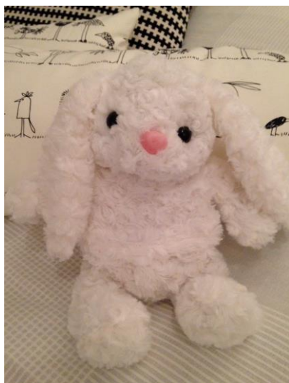
Kuva 6. Kaisa-Kani

Sä voisit olla hyvä luistelemisessa tai porkkanan syömisessä.