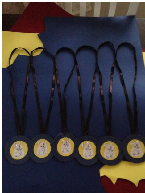
Kuva 8. Rohkeusmitalit