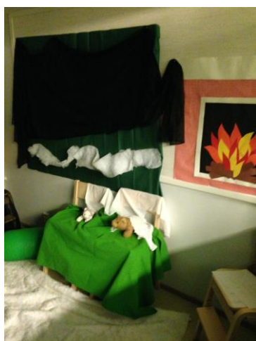
Kuva 4. Satumetsän tunnelmaa

Tavoitteena toiselle kerralle oli tehdä näkyväksi jokaisen lapsen yksilöllisyyttä kannustamalla lapsia ilmaisemaan omia mielipiteitään ja ajatuksiaan, sekä herätellä lapsia huomaamaan omia vahvuuksiaan ja taitojaan. Aluksi kertosimme sääntöjä ja pyysimme lapsia muistelemaan, mitä sääntöjä viime kerralla sovimme. Tämän jälkeen kyselimme lapsilta, muistavatko he miten Satumetsään siirrytään. Siirryimme yhdessä hyppäämällä Satumetsään ja asetuimme piiriin istumaan ja kuuntelemaan Satumetsän ääniä ja eläimiä (Kuva 4). Tämän jälkeen herätimme Kerttu-Kanin omasta pesästänsä. Kerttu kohtasi jokaisen yksilöllisesti ja kertasi lasten nimet. Muistelimme lasten kanssa, mitä edellisellä kerralla teimme. Lapset saivat palata kiusaamis-aiheeseen, josta Kerttu esitti kysymyksiä. Lapsia rohkaistiin ilmaisemaan omia mielipiteitään esittämällä runsaasti kysymyksiä ja kannustamalla miettimään, mitä ajatusten taustalta löytyy ja minkä lapsi on kokenut merkitykselliseksi (Solatie 2009, 47).