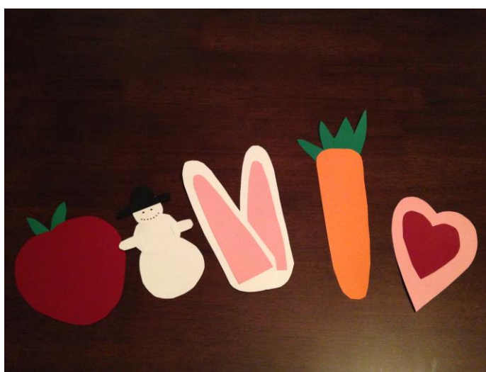
Kuva 5. Arvoituksia ja tehtäviä

Aloitimme tuttuun tapaan kertaamalla Satumetsän säännöt ja muistelemalla, miten Satumetsän maailmaan hypättiin. Kokoonnuimme lapsille jo tuttuun piiriin maahan istumaan ja kuuntelimme sekä ihmettelimme Satumetsän ääniä ja eläimiä. Draaman maailmassa lapsi tutustuu erilaiseen ympäristöön hahmojen sekä omien tunteiden, kokemusten ja haaveiden kautta (Heinonen 2004, 94). Tämän jälkeen kävimme läpi arvoituksia ja tehtäviä, jotka olivat ilmestyneet Satumetsään (Kuva 5). Lapset saivat etsiä arvoitukset, jonka jälkeen ne luettiin ja toimittiin pyydetyllä tavalla. Leikki sopi viisivuotiaille lapsille hyvin, sillä lapsi osaa odottaa vuoroaan ja kuunnella ohjeita sekä muuttaa käyttäytymistään toivotulla tavalla (Nurmi ym. 2010, 55). Jokainen sai osallistua leikkiin ja kaikki saivat vastata arvoituksissa ja tehdä tehtävissä pyydetyn tehtävän. Kehuimme lasten suoriutumista ja annoimme positiivista palautetta. Toiminnan ohjaajien tulee olla itse motivoituneita ja kiinnostuneita ohjattavasta toiminnasta, jotta myös muut voivat siitä innostua (Huilla & Isokoski 2013, 97–98).