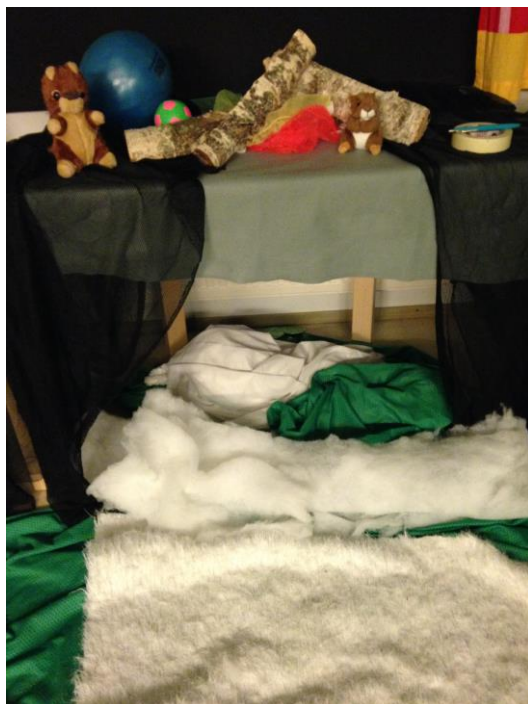
Kuva 1. Satumetsä

maailmaan (Kuva1). Satumetsässä kuului metsän ääniä, joita yhdessä ihmettelimme ja rauhoituimme piiriin istumaan.