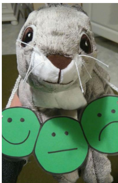
Kuva 3. Kerttu-Kanin hymynaama -arviointi

Piirissä istuessa voidaan lopuksi analysoida ja pohtia yhdessä tapahtumien kulkua. Näin kokemukset ja harjoitukset jäävät paremmin lasten mieleen ja ohjaajat saavat arvokasta palautetta. Analysointi ja pohdinta voivat olla draaman merkityksellisin vaihe, sillä siinä lapsi jäsentää oppimaansa ja kokemaansa. Puhuminen ääneen antaa myös muille lapsille kokemuksia muiden oppimisesta. (Keskumäki ym. 2004, 36–37.) Lopuksi lapsilta kysyttiin palaute toimintakerrasta suullisesti niin, että lapset saivat yhdessä pohtia ääneen mikä oli kivaa ja mikä ei. Kerttu-Kanilla oli kaulassaan hymynaamat (Kuva3), joista lapset vuorotellen näyttivät, mitä mieltä he olivat toimintakerrasta. Tämä yksilöllinen palaute kerättiin samalla, kun Kerttu-Kani kävi antamassa jokaiselle halauksen. Satumaailmasta siirryttiin hyppäämällä takaisin päiväkodin tiloihin, jotta draaman maailma säilyisi ja jatkuisi luontevasti samalla tavalla myös seuraavalla kerralla.