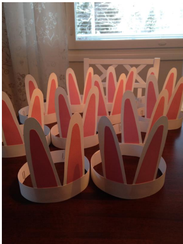
Kuva 2. Kaninkorvat

taputimme kaikille ja kehuimme leikkijöitä hienoista suorituksista. Leikin kautta näytimme lapsille, ettei ole olemassa yhtä oikeaa tapaa tehdä asioita, vaan kaikki tekevät yksilöllisesti omaa suoritustaan.