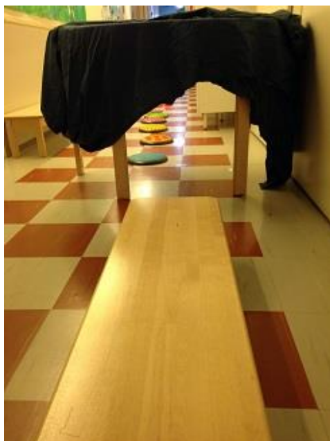
Kuva 7. Toimintarata