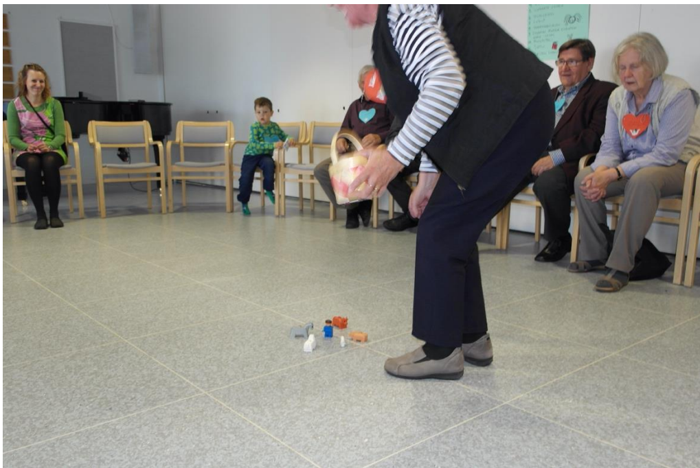
KUVA 11. Tässä käynnistyy muistipeli

Juontaja oli koko ajan pitänyt huolta ajan kulusta ja muistipelin aikana hän huomasi ajan olevan jo loppumaisillaan ja arveli myös lasten olevan jo väsyneitä. Ohjelmassa olisi vielä ollut satu, joka yhteisellä päätöksellä kuitenkin jätettiin välistä ja siirryttiin lasten loppulauluun sekä kerhorukoukseen. Seniorit seurasivat lauluesitystä ja osallistuivat rukoukseen laittamalla kätet ristiin. Kerhorukouksena oli "Pienet suuret ihmiset", joka sopi päivän teemaan. Tämän jälkeen pyysimme senioreita odottamaan sen aikaa, kun lapset täyttivät palautekyselyn. Lapset täyttivät kyselyn yhdessä meidän ja lastenohjaajien kanssa ja saivat sen jälkeen tikkarit kotiin vietäväksi. Lasten lähtiessä seniorit vielä kiittivät heitä yhteisestä tuokiosta. Tämän jälkeen yksi senioreista tokaisi suureen ääneen, että heillä oli ollut todella hauskaa, ja toivoi samanlaista tuokiota jo seuraavaksi tiistaiksi. Myös muut seniorit olivat samaa mieltä ja kommentin sanonut seniori vielä lausui, että "tällaista lisää"!