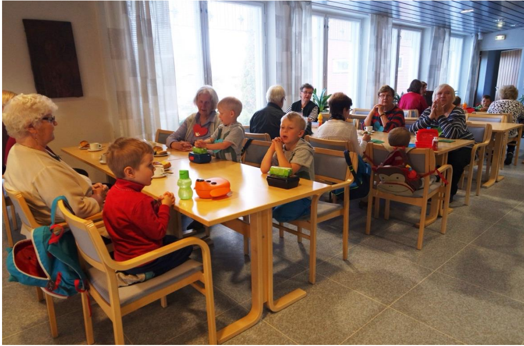
KUVA 8. Yhteinen ruokarukous ennen eväitä ja kahvihetkeä

Lasten eväiden syönnin jälkeen lapset saivat lattialle perhekerhon leluja, joilla he saivat leikkiä hetken vapaasti. Seniorit menivät istumaan omille paikoilleen piiriin ja katselivat hetken lasten leikkiä. Vapaan leikin jälkeen varalla ollut juontaja otti ohjat käsiinsä ja sai lapset keräämään lelut lattialta koriin pienen kilpailun avulla. Vapaa leikkihetki oli lapsille hyvä ruokailun jälkeen, jolloin ei tarvinnut istua ja keskittyä, vaan sai tehdä vapaasti mitä halusi. Lapset olivat koko toiminnallisen tuokion hyvin rauhallisia ja juoksentelevia lapsia ei nähty ollenkaan. Seuraavaksi lapset ja seniorit lähtivät kaikille tuttuun Piiri pieni pyörä -leikkiin, johon meillä oli taustamusiikkia. Lapset ja seniorit sekoittuivat piirissä mukavasti ja kaikilla tuntui olevan hyvin hauskaa, kun ”kädet sanoivat lip-lap-lap ja jalat sanoivat kip-kap-kap”. Lastenohjaajilla oli iso rooli laululeikeissä, sillä he osasivat hyvin laulujen koreografiat. Kahden tunnin mittaiseen suunnittelukertaan oli mahdotonta mahduttaa leikkien opettelua, mutta toiminnallisessa tuokiossa kaikki sujui hyvin ja he oppivat toinen toisiltaan. Opettelu olisi varmasti lisännyt paineita senioreille, ja oli mukava nähdä miten leikit palautuivat mieleen muistin sopukoista.