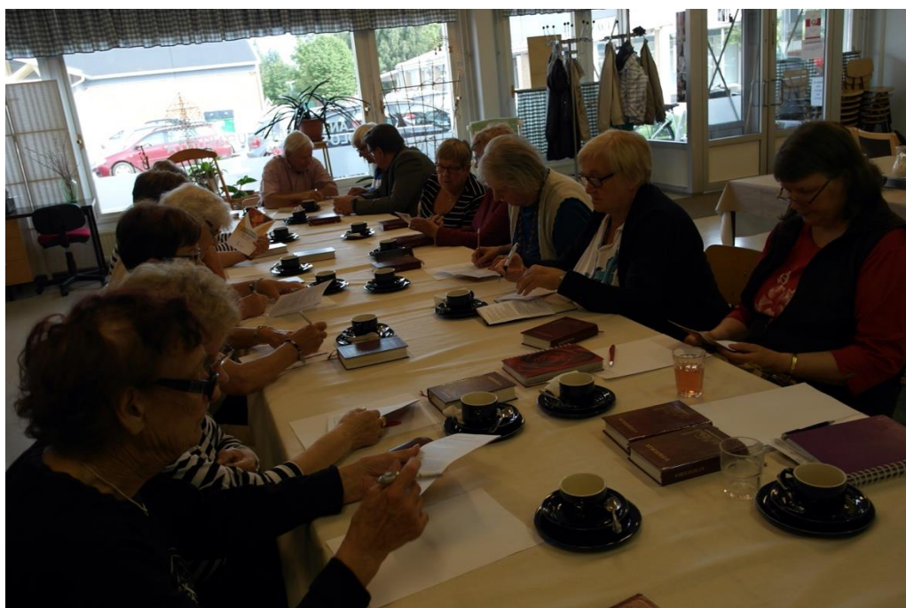
KUVA 1. Aktiivista suunnittelua Leskien Kahvilassa

Suunnittelu sujui mukavan leppoisasti puheensorinan, naurun, laulujen ja laulu-leikin muisteluiden merkeissä. Tällä kertaa tuntui, että kaikilla oli mukavaa, ja monet senioreista toivat ideoitaan esiin. Annoimme heille tunnustusta aktiivisuudesta ja kerroimme, että suunnittelu jatkuu viikon kuluttua ja silloin vielä voi ehdottaa ohjelmaan sisältöä. Kannustaminen oli tärkeää, jotta senioreiden aktiivinen osallistuminen ja innokkuus säilyisivät. Pyysimme heitä myös miettimään kuka tai ketkä heistä toimisivat juontajan roolissa toiminnallisessa tuokiossa. Juontajan rooli oli mielestämme vastuullinen ja aktiivisuutta vaativa tehtävä ja halusimme, että he saisivat rauhassa miettiä tehtävän vastaanottamista.