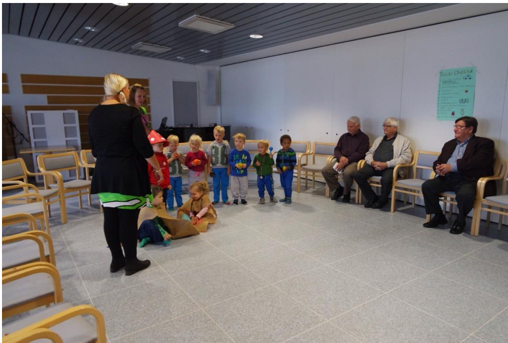
KUVA 5. Lasten peikkoesitys senioreille

Esityksestä siirryttiin suoraan askartelemaan nimilappuja, joihin olimme tehneet jo aihiot valmiiksi. Askarteluaihiot olivat osittain valmiina, koska toiminnallisen tuokion aika oli rajallinen. Seniorit saivat tehdä itselleen nimilapun sekä auttaa lapsia tekemään samanlaisen myös. Nimilappu oli sydämen muotoinen pahvi, johon olimme tehneet reiät valmiiksi naruja varten. Seniorit auttoivat narun kiinnittämisessä ja lapsen nimen kirjoittamisessa. Kukin lapsi ja seniori sai myös liimata omaan nimilappuunsa kaksi enkelikiiltokuvaa. Nimilapuista tuli hienoja, ja yhdessä tekeminen heti aluksi aktivoi senioreita toimimaan. Askartelussa kaikki pääsivät osallistumaan ja jokaisella seniorilla oli tekemistä.