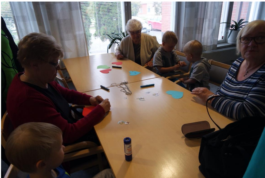
KUVA 6. Nimilappujen askartelua senioreiden avustamana

Huutokilpailun jälkeen juontajana toiminut seniori otti tuomansa käsinuket esille ja alkoi esitellä niitä luontevasti lapsille. Tässä kohtaa poikettiin vähän suunnitelmasta ohjelmasta, mikä saattoi hämmentää muita senioreita. Muut eivät oikein osanneet tulla mukaan käsinukkeleikkiin, vaan seurasivat sivusta. Tässä kohtaa myös lapset innostuivat matkimaan erilaisia eläinten ääniä käsinukkejen avustuksella. Käsinuket saivat seniorit spontaanisti aloittamaan laulun Pupujussikat.