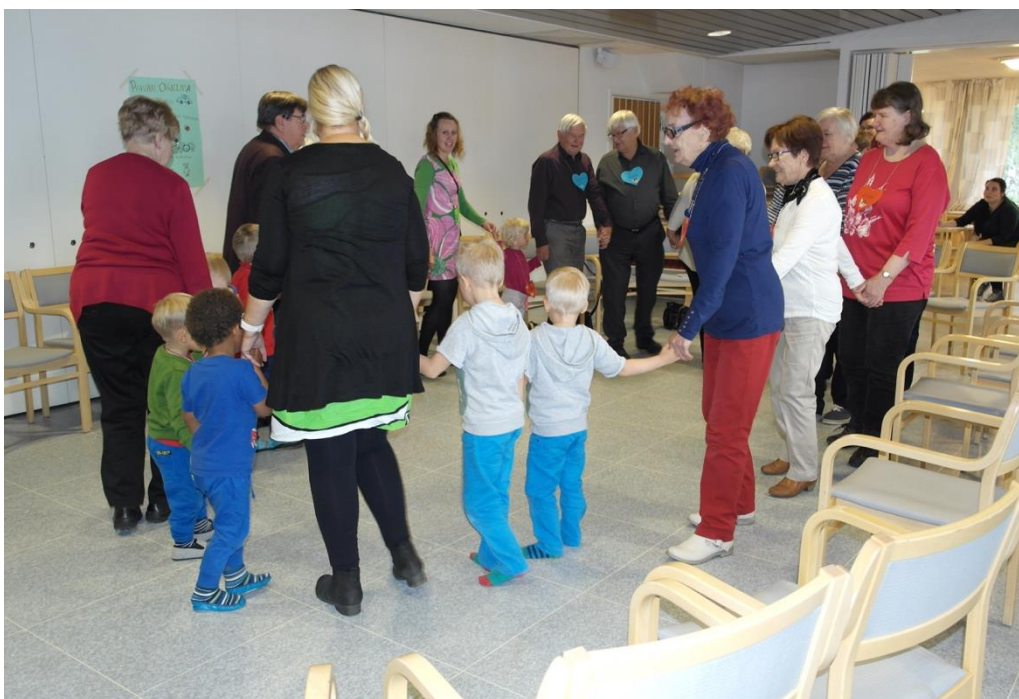
KUVA 10. Piiri pieni pyörii

Piirileikistä siirryttiin loruihin, jotka olivat Leskien Kahvilan senioreilta. Lorut olivat yhden seniorin tuomassa hatussa, josta lapset vuorollaan saivat hakea yhden lorun ja viedä haluamalleen seniorille luettavaksi. Ehdotus lorujen viemisestä se-