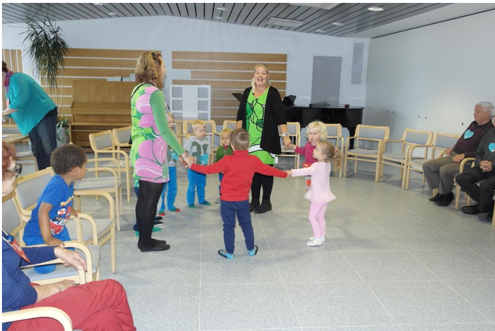
KUVA 12. Loppulaulusta kerhorukouksen kautta yhteisen hetken päätökseen

Seniorit jäivät vielä täyttämään omaa palautekyselyä, minkä jälkeen yllätimme heidät ruusuilla ja halauksilla. Kiitimme senioreita heidän aktiivisuudestaan ja suuresta roolistaan osana opinnäytetyötämme. Seniorit olivat yhtä hymyä ja lähtivät iloisella mielellä kotiin. He pysyivät meitä tulemaan uudelleen samanlaisen tuokion merkeissä, jolloin vastasimme, että he voivat toivoa uusintaa diakonia-työntekijän tukemana. Muistutimme vielä, että he olivat itse suunnitelleet ja toteuttaneet koko ohjelman.