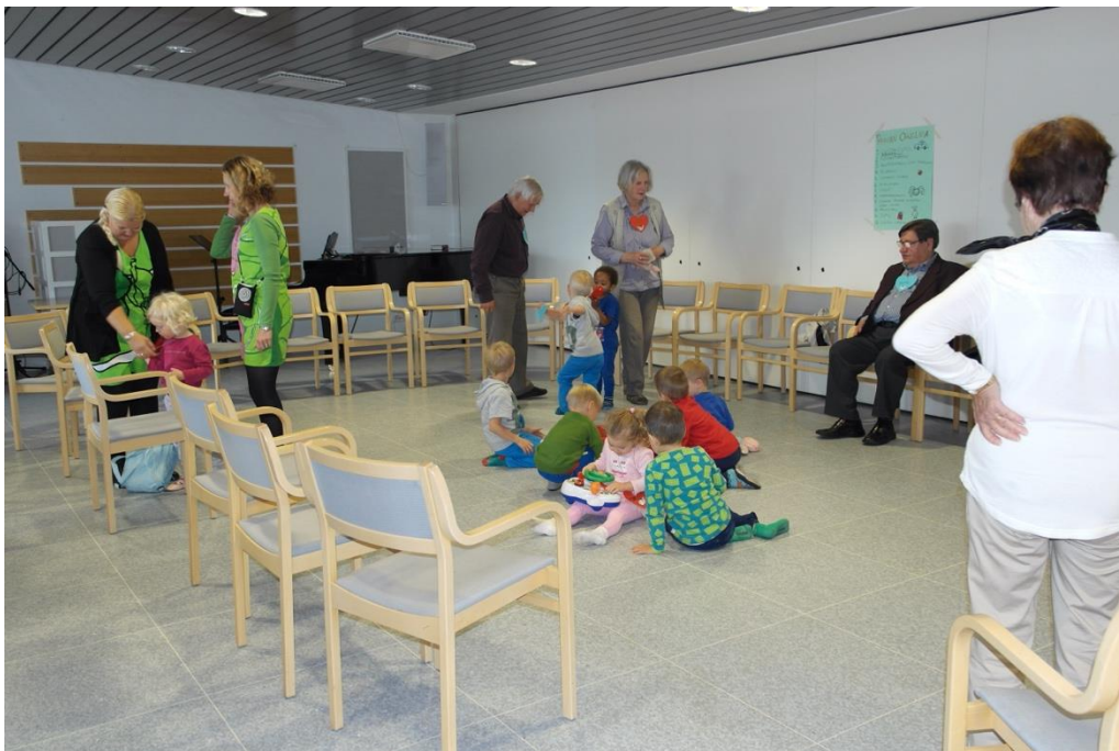
KUVA 9. Vapaata leikkiä ennen ohjelman jatkumista