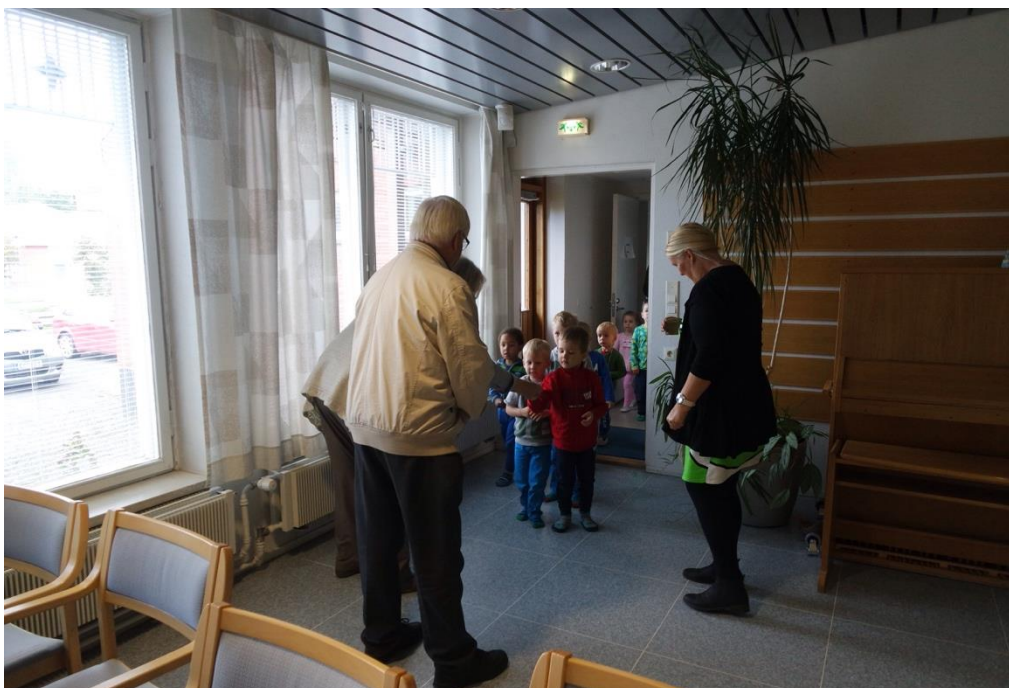
KUVA 4. Toiminnallisen tuokion juontajat vastaanottavat lapsia

ja Leskien Kahvilan seniorit istuisivat joka toisessa tuolissa, mutta ennen toiminnallisen tuokion alkua seniorit päätyivät siihen, että lapset saivat istua vierekkäin, jotta heitä ei jännittäisi. Kun kaikki toiminnalliseen tuokioon osallistuvat olivat piirissä, toivottiin heidät tervetulleeksi meidän toimesta. Tämän jälkeen muistutimme juontajia siitä, että he olivat sopineet toimivansa juontajina. Yksi juontajista otti roolin heti vastaan ja pyysi lapsia esittämään kerhossa valmisteleman esityksen. Lapset esittivät peikkolaulun, jossa yksi lapsista oli pukeutunut kärpässieneksi ja kaksi peikoiksi. Loput lapset lauloivat ja soittivat marakasseja päiväkerho-ohjaajien avustuksella. Leskien Kahvilan seniorit pitivät esityksestä hyvin paljon ja taputtivat lasten esityksen jälkeen. Kaikkien Leskien Kahvilan seniorien suut olivat aidossa hymyssä ja heistä näki kuinka he nauttivat lasten esityksestä. Leskien Kahvilan seniorit olivat jo suunnittelukertoina tuoneet esiin, että haluaisivat kuulla ja nähdä myös lasten esiintyvän.