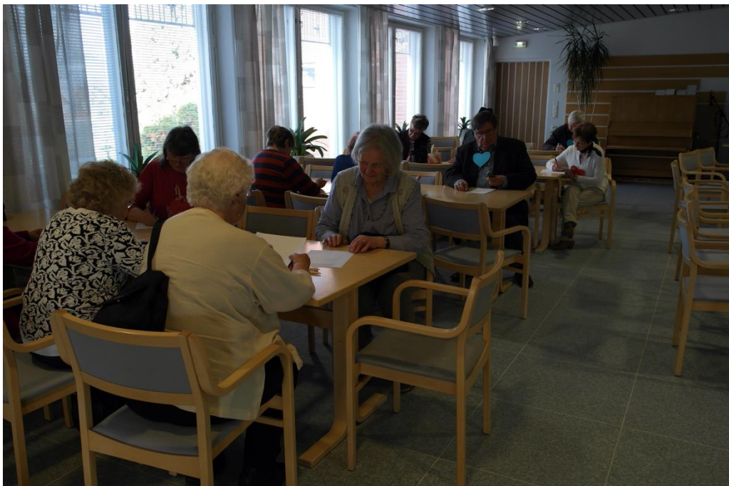
KUVA 13. Palautteiden täyttäminen

Olisimme kaivanneet palautetta diakoniatyöntekijältä, joka kuitenkin joutui poistumaan kiireisesti jo seuraavan ryhmän kokoontumiseen. Lastenohjaajat kuitenkin antoivat positiivista palautetta. Kun seniorit ja diakoniatyöntekijä olivat poistuneet, jäimme vielä siivoamaan seurakuntasalia ja laittamaan tuoleja ja pöytiä paikoilleen. Olimme kaikki tyytyväisiä toiminnallisen tuokion toteutukseen ja havaintojemme perusteella myös tuokion tavoite tuli täytettyä.