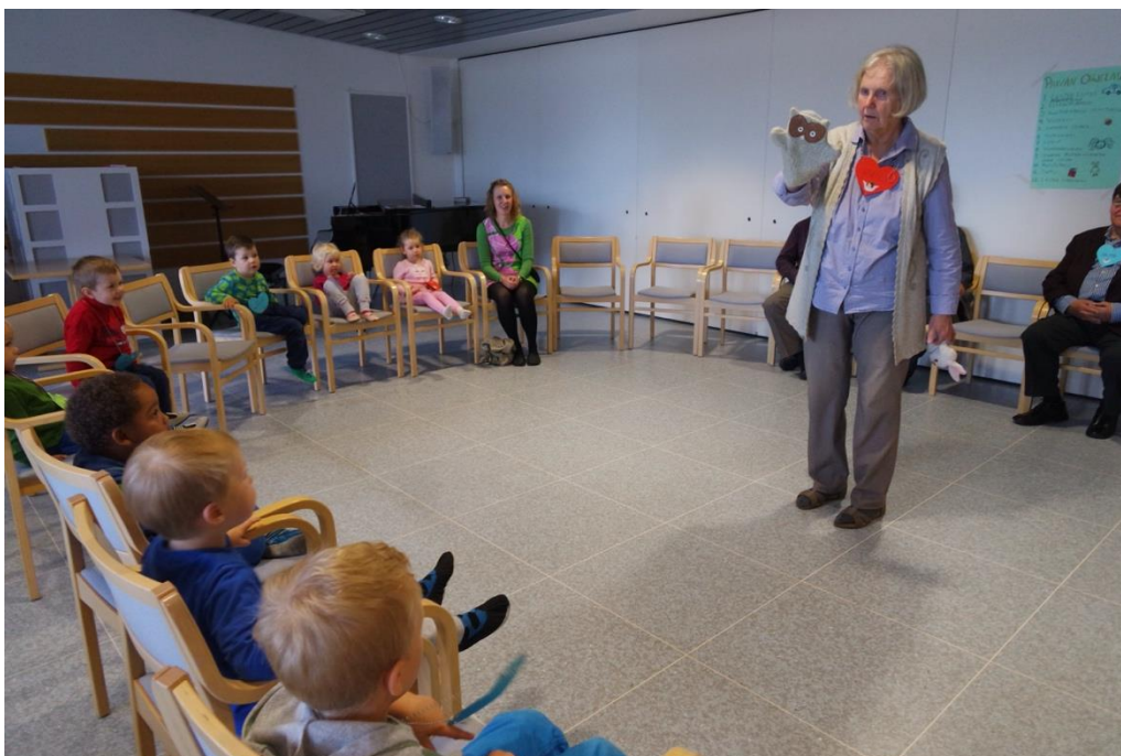
KUVA 7. Juontajana toiminut seniori esittelee käsinukkeaan

Leikkituokion jälkeen ehdotimme, että olisiko nyt hyvä kohta pitää lapsien evästäuko ja seniorit saisivat nauttia kahvinsa. Siirtyminen pöytiin sujui hyvin ja seniorit ja lapset sekoittuivat luontevasti. Lapset jaksoivat hyvin odottaa niin kauan, että kaikki olivat saaneet syömisensä pöytään ja päästiin yhdessä lausumaan ruokarukous lastenohjaajien johdolla. Kahvihetken aikana pöydistä kuului mukavaa puheensorinaa ja seniorit olivat auliisti auttamassa lapsia heti, kun he tarvitsivat apua. Ruokailun aikana myös ujoimmat seniorit uskaltautuivat vihdoinkin haikertumaan aktiivisesti lasten seuraan. Ruokailussa apukäsinä olivat myös lastenohjaajat. Kahvituksesta vastasimme me ja diakoniatyöntekijä, mikä mahdollisti sen, että Leskien Kahvilan seniorit saivat keskittyä lasten kanssa seurusteluun.