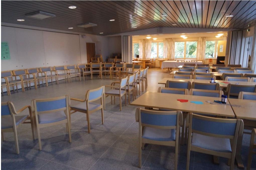
KUVA 2. Seurakuntasali valmiina ottamaan seniorit ja juniorit vastaan