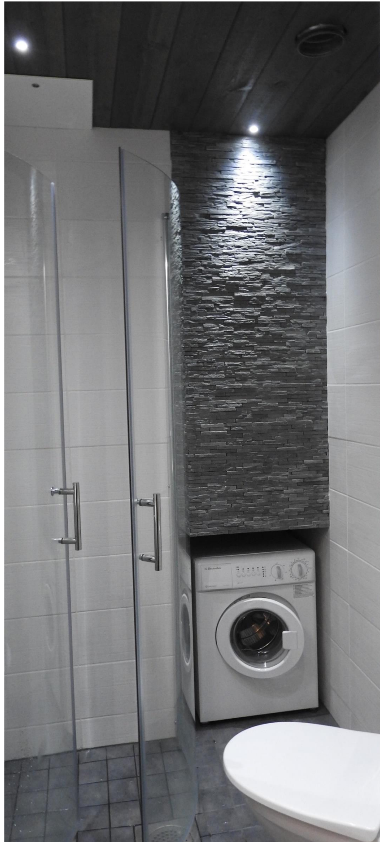
Kuva 6. WC ja suihkutilat.