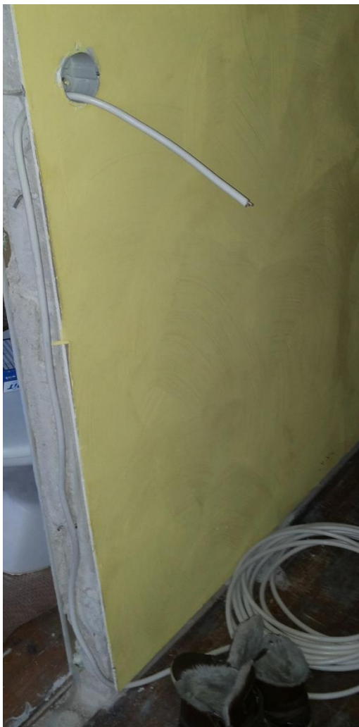
Kuva 3. Uusi johdotusreitti olohuoneen kytkimelle.