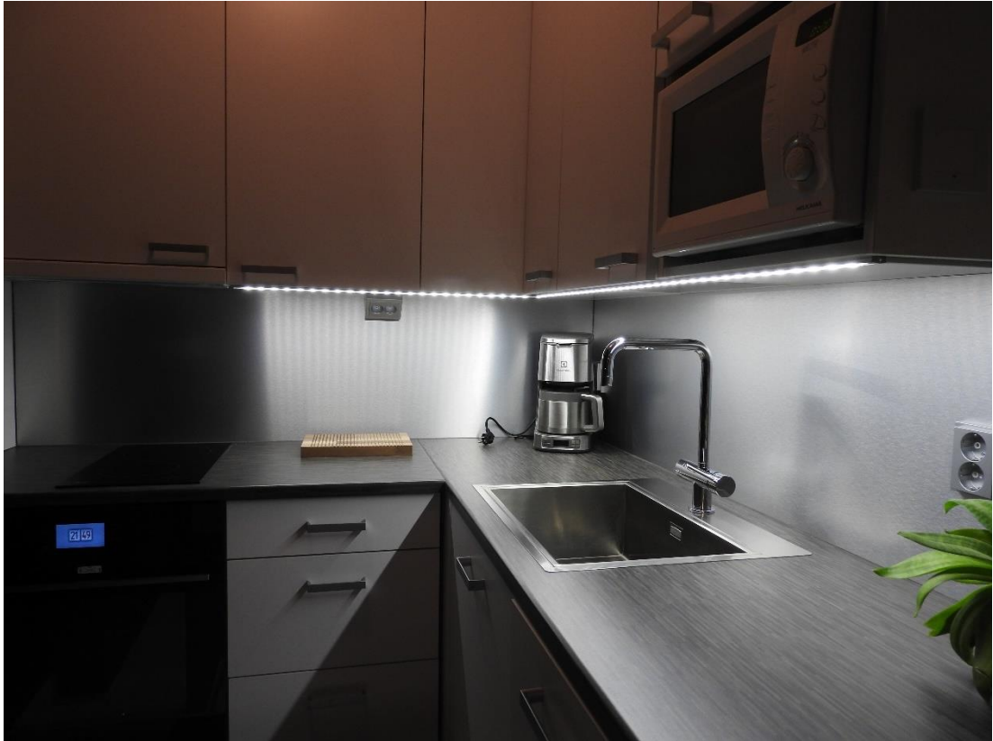
Kuva 9. Valmis keittiö.