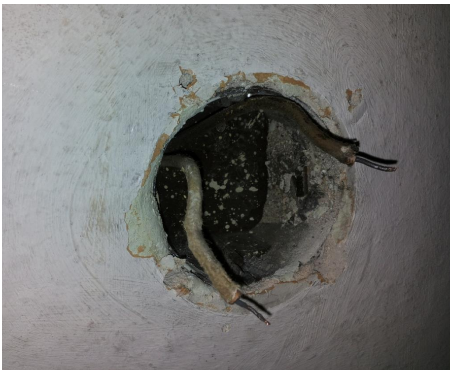
Kuva 1. Alkuperäiset johdot.

Keskuksena toimi (1 vaiheinen) 1940- luvulta peräisin oleva yksinkertainen keskus. Sähköjohdot oli uppoasennettuja ja kovettuneita. Osassa kytkimistä ja pistorasioista oli pieniä halkeamia. Uppoasennuksessa käytetyt putket olivat 1940 luvulta peräisin olevia Bergman-putkia. Seinät olivat betonin ja tiilen yhdistelmää. Maadoituksia ei ollut.