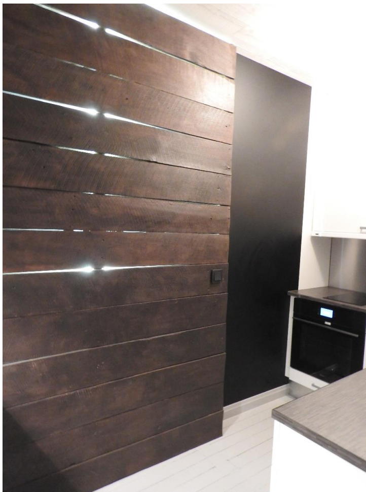
Kuva 13. Keittiön mahonkilankkuseinän led valaistus.

Huoneistossa haluttiin kiinnittää huomiota myös energiatehokkuuteen. Siksi osa valaistuksesta toteutettiin hyvin valaisevilla LED-lampuilla. Kohteessa suihku ja wc tilojen valaistus on toteutettu kokonaisuudessaan Led valoilla. Keittiössä keittiötason valaistus on toteutettu led nauhalla. Upea tunnelmanluoja saatiin, kun keittiössä sijaitsevan mahonkilankkuseinän taakse sijoitettiin led nauhat.