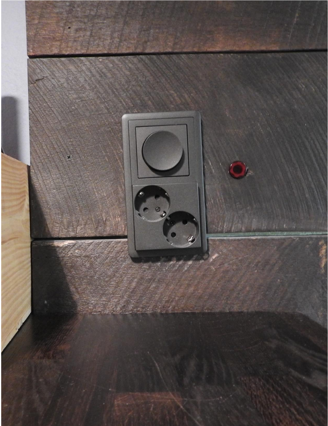
Kuva 11. Keittiön saarekkeen pistorasiat sekä saarekkeen valaistuksen kytkin.