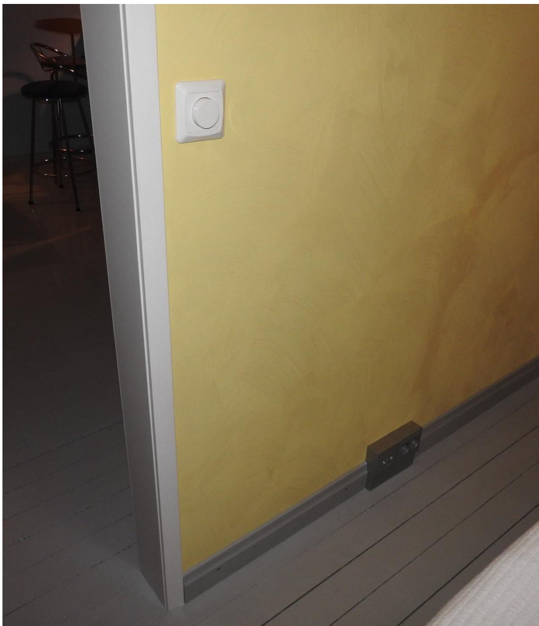
Kuva 12. Olohuoneen valmis kytkin sekä pistorasioita.

Makuuhuoneeseen sijoitettiin 1 kattovalaisin, jonka kytkin sijoitettiin makuuhuoneen oven viereen. Kytkimeksi valitsin himmennuskytkimen. Kaksiosaisia pistorasioita sijoitettiin yhteensä neljä kappaletta, kaksi huoneen molemmille puolille. Näin olisi mahdollista sijoittaa parisänky huoneen kummalle seinälle tahansa ja yöpöydille olisi vielä helppo sijoittaa yövalaisimet. Makuuhuoneeseen sijoitettiin myös yksi antennipistorasia.