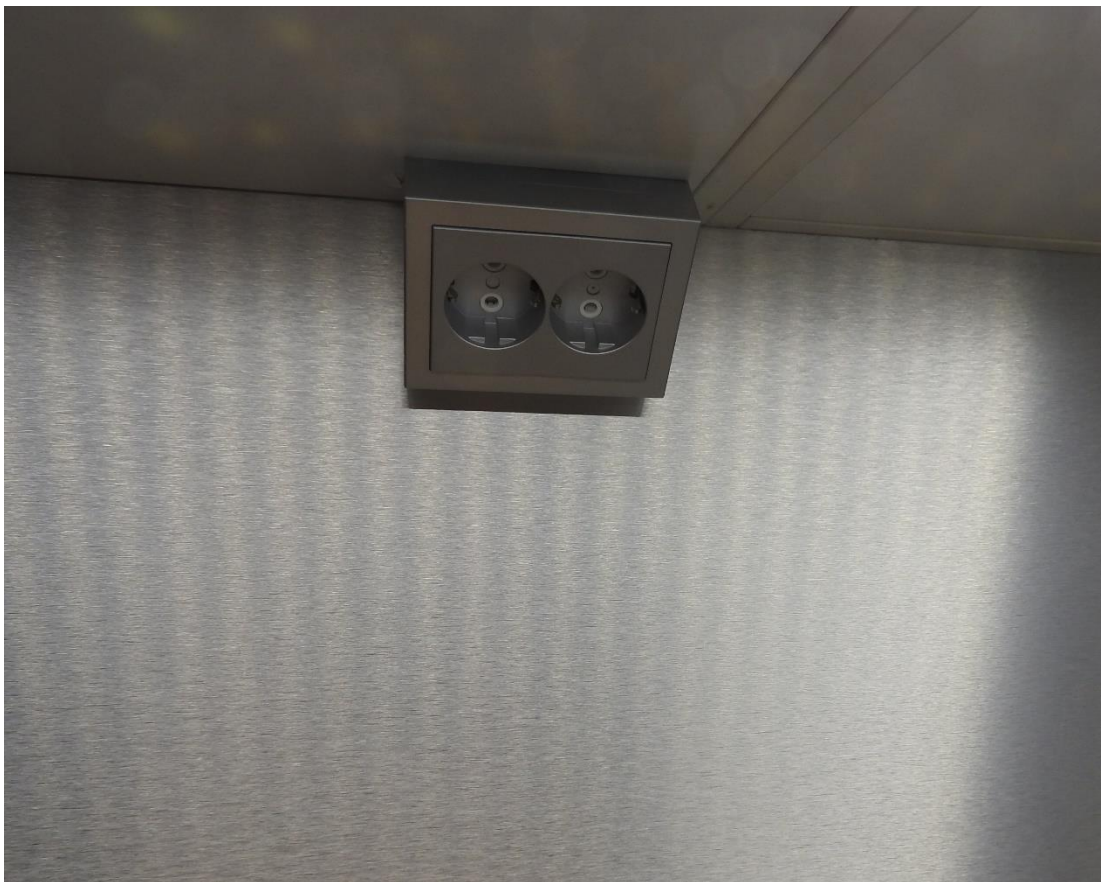
Kuva 10. Keittiön välitilan pistorasia.