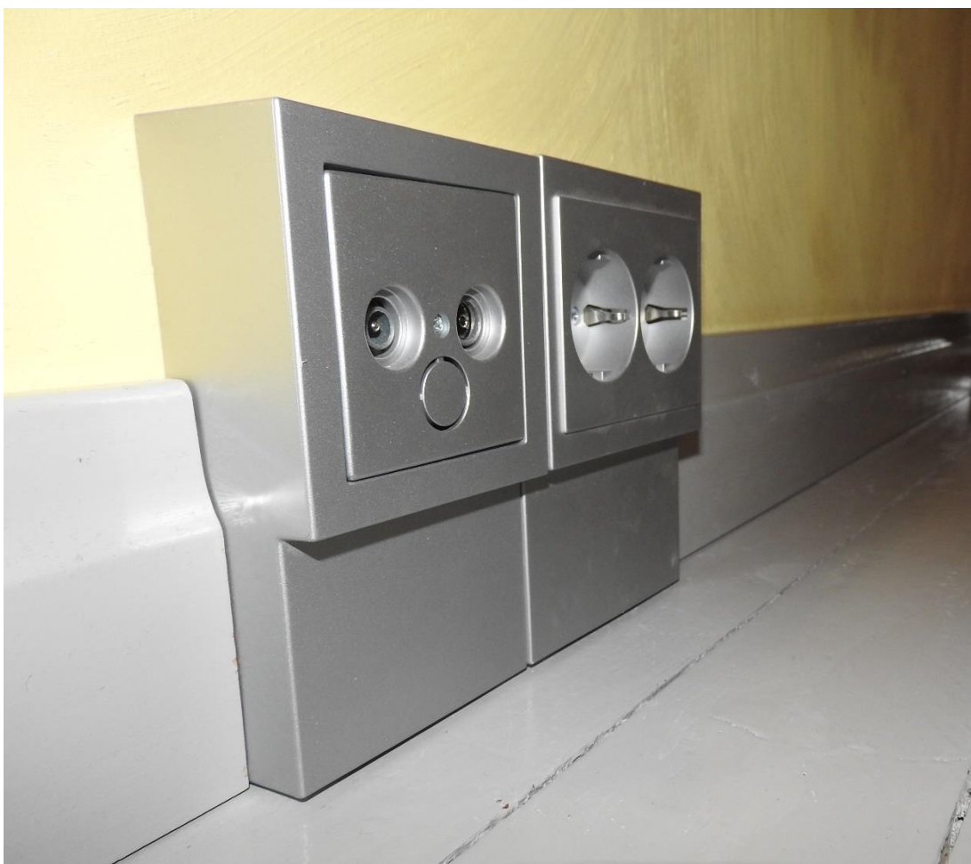
Kuva 7. Asuntoon valitut listapistorasiat

Yksinkertaisin reitti tuoda olohuoneen pistorasioihin sähkö oli lattialistojen takana, jolloin luonnollinen ratkaisu oli valita olohuoneeseen listapistorasiat. Olohuoneeseen sijoitettiin neljä parillista listapistorasiaa. Kattolamppu asennettiin keskelle olohuonetta ja sen kytkin on sijoitettu eteiseen menevän oviaukon viereen. Olohuoneeseen tuli myös toinen kahdesta huoneistossa sijaitsevasta antennipistorasiasta.