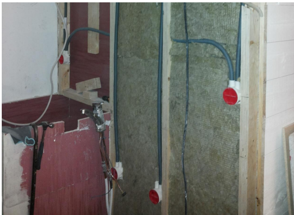
Kuva 8. Keittiön putkitus sekä pyykinpesukoneen paikka.

Keittiössä pitäisi olla pistorasioita paljon, koska onet kodin koneet ovat siellä. Pienkojeet, kuten kahvinkeitin, leivänpaahdin ja yleiskone tarvitsevat pistorasiansa. (Silvennoinen 1988, 19). Keittiö oli asiakkaalle kodin sydän ja tiedossa oli, että se tulisi olemaan asiakkaalla paljon käytössä kokkaus harrastuksen vuoksi. Keittiön työtasolle sijoitettiin 3 parillista pistorasiaa ja keittiösaarekkeelle yksi kaksiosainen pistorasia. Mikro, jääkaappi, liesituuletin, uuni, astianpesukone ja pyykinpesukone saivat kaikki omat pistorasiansa. Kaikki keittiön johdotukset on toteutettu 2,5 neliön johdoilla toisin kuin muualla huoneistossa, jossa on käytetty 1,5 neliön MMJ:tä.