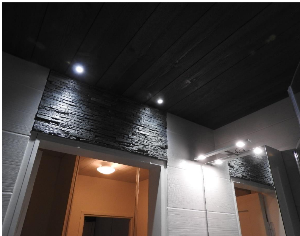
Kuva 5. WC ja suihku tilojen valaistus.

Valaistuksessa kiinnitettiin huomiota sen riittävyteen erityisesti peilin edessä, jolloin päädyin kattovalaistuksen lisäksi lisävalaistukseen peilin yläpuolella. Valaisimeksi valittiin Esther-led-valaisin.