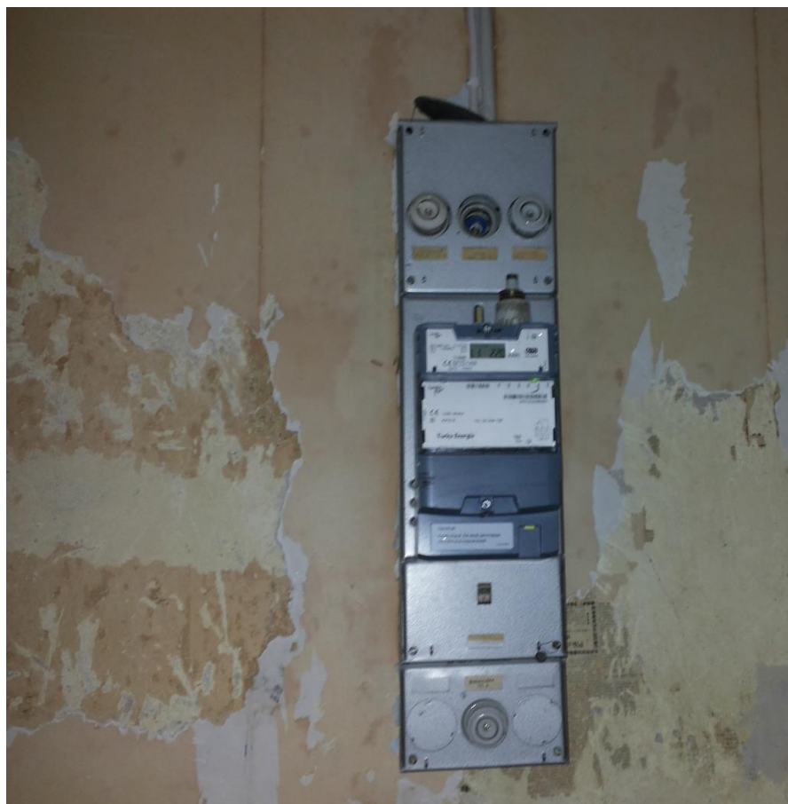
Kuva 2. Alkuperäinen keskus.