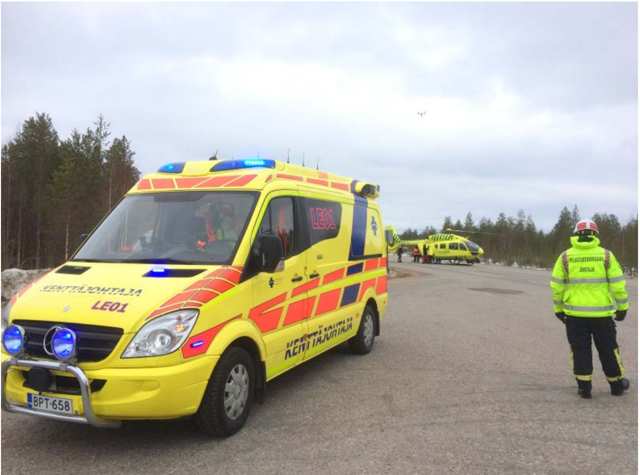
KUVA 2. Kenttäjohtaja valvoo potilaan siirtämistä helikopteriin