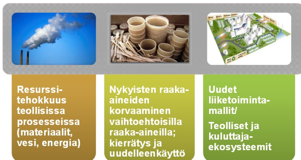
Kuva 3. Kolme strategiaa kestävään talouteen. (Teknologian tutkimuskeskus 2015)

Sitra on tuonut esille, että maailmalla käytetään luonnonvaroja 1,5-kertaisesti varoihimme nähden. Suomessa ekologinen jalanjälki on suurimpia, vaikka asia saattaa tuntua oudolta suuriin kaupunkeihin nähden. Suomi on väkiluvultaan pieni maa ja ajatus tästä voi tuntua oudolta, kun ajatellaan metsävarojemme ja tiukkojen päästörajoitustemme määrää.