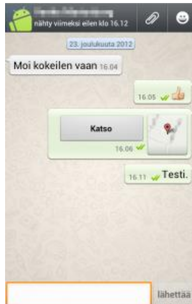
Kuva 1. WhatsApp-keskustelunäkymä.

Viestin lähettämisen jälkeen viestin kohdalle ilmestyy ensin yksi ja sitten toinen vihreä väkänä. Ensimmäisen väkänen ilmestyminen tarkoittaa, että viesti on onnistuneesti otettu vastaan WhatsAppin palvelimelle ja toinen väkänä ilmoittaa, että viesti on välitetty keskustelun toiselle osapuolelle eli lähetys onnistui. (WhatsApp, www-sivut.)