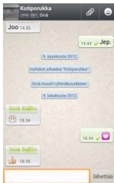
Kuva 2. WhatsApp ryhmäkeskustelunäkymä

Kahden välisen keskustelun lisäksi WhatsApp-ryhmien perustaminen on hyvin suosittua. Ryhmiä voi olla mm. perheen, oman koululuokan tai harrastusporukan sisällä. Lisäksi ryhmiä voi olla myös esimerkiksi jonkun tietyn kiinnostuksen kohteen omaavien henkilöiden kesken. WhatsApp-ryhmiin voi kuulua maksimissaan 100 henkilöä ja ryhmän voi tehdä kuka tahansa. Ryhmän perustaja on automaattisesti ryhmän ylläpitäjä ja hän valitsee, ketkä ryhmään kuuluvat. Vain ylläpitäjällä on mahdollisuus lisätä ryhmään väkeä. Kaikki ryhmään kuuluvat näkevät sinne lähetetyt viestit sekä voivat vastata niihin. (WhatsApp, www-sivut.)