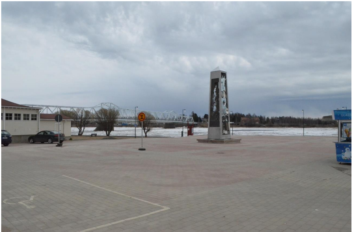
Kuva 4. Nordbergin möljä, kuvattu 1.5.2015.

Torniossa oli myös syysmarkkinat lokakuun 2015 alussa. Markkinat valtasivat kutakuinkin yhtä suuren tilan kuin suurmarkkinat, joten niidenkin sijaintipaikaksi Victoriantori on ongelmallinen. Nordbergin möljää voisi ajatella tällaisten isohkojen markkinoiden pitopaikaksi. Tori on laakea, päällystetty ja tila on helposti laajennettavissa ympäristöönsä. Kuten eräs haastateltava asian muotoili, on Nordbergin möljä paremmin näkyvillä; se on veden äärellä ja molemmilta silloilta näkee möljälle. Entinen torikenttä on vastakohta tälle, sillä se sijaitsee sisällä kaupungissa keskellä rakennettua urbaania ympäristöä, jonne ohikulkeva turisti ei ”eksynyt vahingossa”.