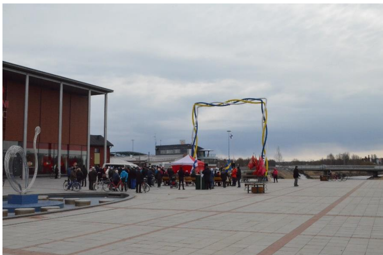
Kuva 1. Victoriantori vappuna 2015 tullille päin kuvattuna.

Victoriantorilla on tarkoitus järjestää toritoimintaa. Torin pinnassa on itse asiassa kivillä rajatut alueet, jotka voi ajatella halutessaan myyntiruutuina. (ks. Kuva 1.) Ruotsin puolen rakennustöiden vuoksi itse torikauppa on kuitenkin siirretty Länsirannalle kauppakeskuksen eteen sekä Nordbergin möljälle. Tornion kevätmarkkinoilla (5-7.3.2015) oli seuraavat hinnat: yksi 4x4 paikka maksoi 80 €, pienempi 3x3 ruutu 65 € tai vaihtoehtoisesti 600 SEK. Lisäksi sähköä tarvitsevilta veloitettiin erillinen maksu, 25 €. Hinnat olivat markkinoiden ajaksi (kolme päivää). (Tornion kaupunki 2015.) Nordbergin möljän ja kävelykadun paikat kustantavat 20 euroa/päivä (Tornion elävä kaupunkikeskusta ry 2015).