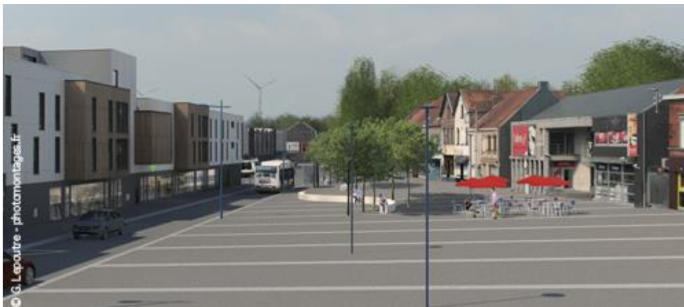
Kuva 2 Havainnekuva Place Jacques Delors (Jacques Delors square).

Place Jacques Delors (ranskaksi), aukio, sijaitsee Ranskan ja Belgian rajalla, ja samaan tapaan kuin Victoriantorilla; raja kulkee keskellä aukiota. Aukio saatiin valmiiksi keväällä 2014, ja on täten ”nuorempi” kuin Victoriantori, joka valmistui 2011. Aukion nimi on englanniksi Jacques Delors square ja hollanniksi Jacques Delorsplein. Nimensä tila on saanut Jacques Delorsilta, joka on ranskalainen poliitikko. Hän toimi myös EU:n komission puheenjohtajana 1990-luvulla huomattavine ansioineen. Tilaa ei ole tehty puhtaasti torikauppaa ajatellen, vaan tilasta on tehty julkinen aukio, pyrkimyksenä edistää kaupunkitilan laatua kaksiskaupungissa esimerkiksi kaupunkilaisten kohtaamispaikkoja luomalla. Kuten kuvasta (Kuva 2) voi huomata, aukion laidalla on kiinteitä liiketiloja, jotka pystyvät laajentamaan terassiaan aukiolle. Kuvassa (Kuva 1) valtionraja kulkee arviolta lähimmäisen tolpan kautta suoran linjana aukion läpi (oikealla on Belgia). (Jacques Delors square).