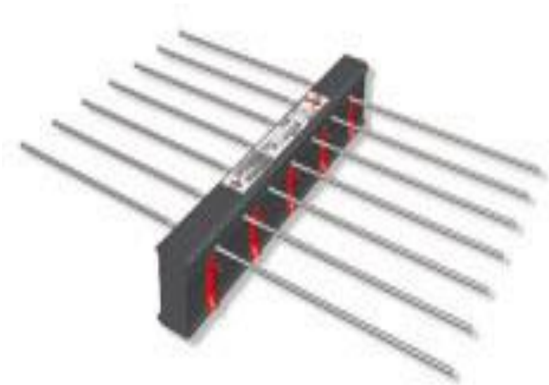
Kuva 1. Halfen parvekeraudoite, jossa eristepalkissa näkyy punainen nuoli, joka näyttää parvekelaatan sijainnin. Nuoli toiseksi taamman raudan kohdalla ja osoittaa oikealle. [2]

Seurantakohteessa on paikallavalettu massiivilaatta, johon yhdistyy kiinteästi parvekkeet. Parvekkeet kiinnitetään tässä kohteessa massiivilaattaan Halfen parvekeraudoitteilla, jotka hitsataan ja sidotaan laatan raudoitukseen. Halfenit on jo tehtaalla kiinnitetty laattamuottiin ja valettu samalla kiinni parvekelaattaan. Raudoitus tulee olla vaaditun raudoitussuunnitelman mukainen, ettei laatan raudoitus pääse liukumaan ulos valetusta laatasta vuosien kuluessa. Asennusvaiheessa kannattaa myös tarkastaa, että tehtaalla on Halfenit asennettu elementtiä valettaessa oikein päin. Kuvasta 1. näkyy punainen nuoli, joka osoittaa kummalla puolella parvekelaatan tulee olla.