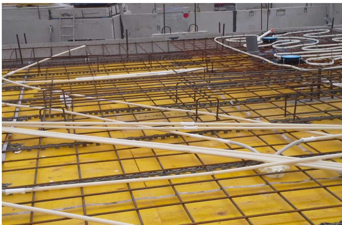
Kuva 4. Paikalla valettavan massiivilaatan sisään jää paljon varauksia ja tekniikkaa.

Mittamies merkitsee paikallavalulaulaattoihin ja ontelolaattoihin varauksien paikat. Paikallavalulaulaatoissa väärässä paikassa olevan varauksen siirtäminen oikeaan paikkaan on usein hankalaa. Valetussa laataassa kulkee sähkövarauksia, viemäreitä, lattialämmitysputkia ja vesijohtoja, jotka suurella todennäköisyydellä on asennettu juuri siihen kohtaan, mihin varaus oikeasti kuuluisi. Tällöin piikatessa tai lattiaa sahatessa ne vahingoittuvat ja jälkityöt lisääntyvät.