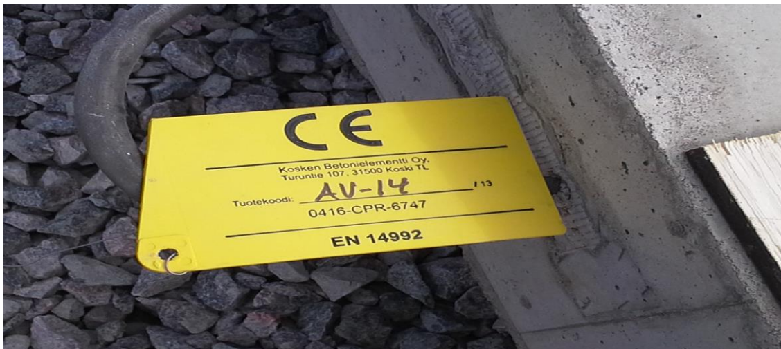
Kuva 3. Elementin tunnus

katsoo piirustuksista seuraavan asennettavan elementin tunnuksen ja ilmoittaa sen alamiehelle.