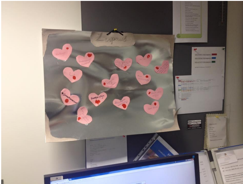
Kuva 6. Lupaus- taulu.

olo” -tunnilla teimme muutamia läsnäoloa ja kontaktia vaativia harjoituksia. ”Leikin läsnäolo” -tunnin lopulla toteutimme myös toiminnallisen harjoitteen, jossa jokainen työyhteisön jäsen sai kirjoittaa sydämenmuotoiselle lapulle ”Mitä positiivista lupaa tuoda itsestään työyhteisölle?” Lappuihin tehtiin oma sormenjälki ja ne liimattiin valmiiksi nimettyyn ja askarreltuun Lupaus- tauluun (kuva 6).. Lupaus- taulu jäi Villa kapteenin työyhteisölle ja se ripustettiin taukuhuoneen seinälle.