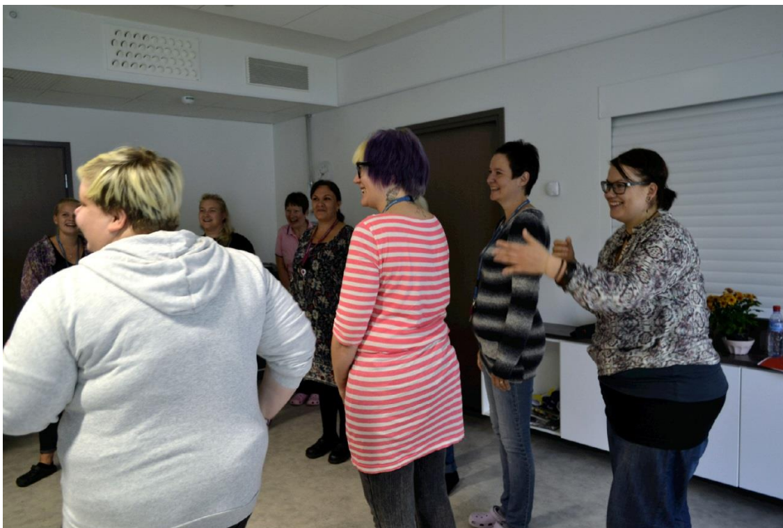
Kuva 5. Leikkipajan aloitus Villa Kapteenin työyhteisössä.

Kolmituntinen työpaja aloitettiin itsemme, aiheen sekä kehittämishankkeemme esittelyllä. Ensimmäisen tunnin teema oli ”Leikin riemu”. Tunnin sisältöön kuului tilaan laskeutuminen, jonka jälkeen tunti keskittyi vuorovaikutusta, heittäytymistä ja hulluttelua vaativiin leikkeihin. Tunnin viimeiset 10 minuuttia olivat luento-osuutta. Luento-osuudessa aiheina oli positiivisuus, ilo ja heittäytyminen sekä positiivinen asenne. ”Leikin riemu” -tunnin luento-osuuden aiheet löytyvät kehittämishankkeen raportin ”Leikin positiiviset vaikutukset” -luvun alta kohdasta 4.1 Leikin riemu s.25. Leikkityöpajan toisen tunnin teema oli Leikin voima. ”Leikin voima” -tunti aloitettiin myös tilaanlaskeutumisharjoituksella. Tunnin muiden leikkien teemana oli tunnetila- ja voimavaraleikit. ”Leikin voima” -tunnin luento-osuuden aiheet löytyvät kehittämishankkeen raportin ”Leikin positiiviset vaikutukset” -luvun alta kohdasta 4.2 Leikin voima s.28. ”Leikin läsnäolo” -tunti aloitettiin muista tunteista poiketen lyhyellä luento-osuudella. ”Leikin läsnäolo” -tunnin luento-osuuden aiheet löytyvät kehittämishankkeen raportin ”Leikin positiiviset vaikutukset” -luvun alta kohdasta 4.3 Leikin läsnäolo s.31. ”Leikin läsnä-