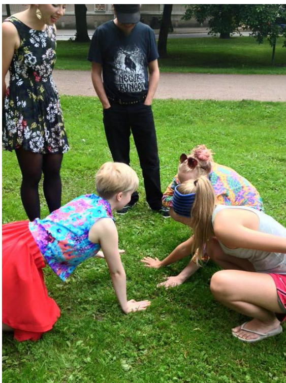
Kuva 4. Pudotuspelin jännittäviä loppuhetkiä.

aina tilaan laskeutumisharjoituksilla, joiden lopussa korostuivat naurua ja heittäytymistä kasvattavat harjoitukset. Tilaanlaskeutumisharjoituksista siirryimme ryhmäyttäviin ja irroittelua sekä hulluttelua lisääviin harjoitteisiin. Tunnit päätimme harjoituksiin, joissa pysähdyttiin hetkeksi havainnoimaan omaa oloa ja keskittymään. Esimerkkinä loppuharjoituksista voisi kertoa harjoituksen, jossa ryhmäläisiä pyydettiin piirissä sulkemaan silmät ja halaamaan itseään ja kiittämään mielessään itseä siitä, että yllitti mahdolliset jännitykset ja päätti saapua leikkimään. Tämän jälkeen muodostimme tunnelin niin, että osallistujat seisoivat vastakkain toisiaan. Jokainen leikkijä sai vuorollaan juosta läpi tästä ”kiitos”-tunnelista ja antaa käsiläpyn jokaiselle leikkituntiin osallistuneelle kaverille. Keräsimme puistoleikkituntien lopuksi palautetta, jossa ohjeistimme osallistujia kertomaan vapaasti päällimmäisistä tuntemuksista sekä leikkituntin sisällöstä. Puistoleikkitunneilla havainnoimme harjoitteiden toimivuutta ja sekä toimivia että kehitettäviä käytäntöjä, jotka liittyivät tunnin ohjaamiseen ja vetämiseen. Puistoleikkituntien sisällöt, osallistujapalautteet, keräämämme huomiot ja kehittämisideamme ovat nähtävissä leikkituntien tuntikoosteissa (Liite 1).