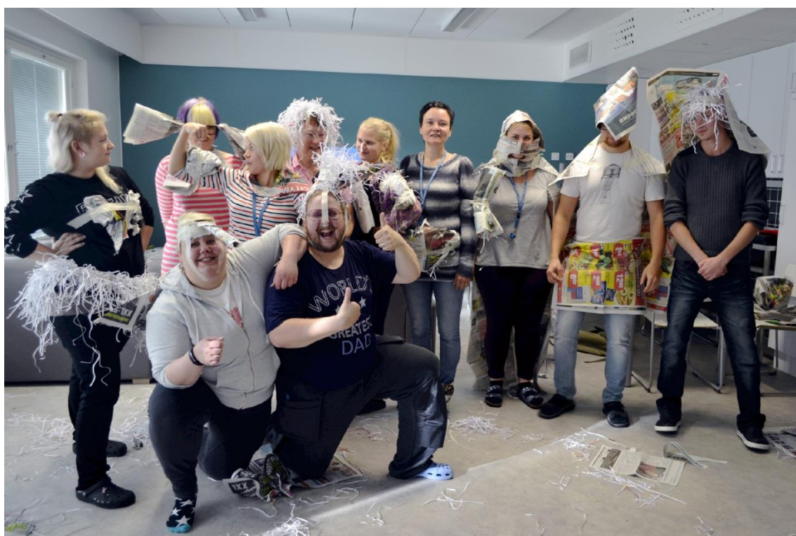
Kuva 2. Voimavara harjoite Villa Kapteenin työyhteisössä.

heiseen luovuuteen. Tämä arkinen luovuus esiintyy esimerkiksi arkielämän innovaatioina, jotka parantavat elämänlaatua (Koski 2001, 17-18.) Jokaisen ihmisen luovuus ilmenee esimerkiksi mielikuvituksen kehittämisessä. Mielikuvitusleikit ovat lapsille ominaisia. Iän myötä lapsi oppii kuitenkin hahmottamaan mielikuvitusmaailman ja todellisen maailman rajat. Dunderfelt (2010) väittää, että mielikuvitus on myös osa todellisuutta. Ilman mielikuvitusta ihminen ei olisi luonut pyörääkään. (Dunderfelt 2010, 78.) Mielikuvituksen on todistettu olevan yhteydessä lapsen empatian, ymmärryksen ja luottamuksen kehittymiselle sekä kykyyn sopeutua erilaisiin tilanteisiin ja haasteisiin. Mielikuvitus on pysyvä edellytys uuden luomiselle. (Brown 2009, 87.)