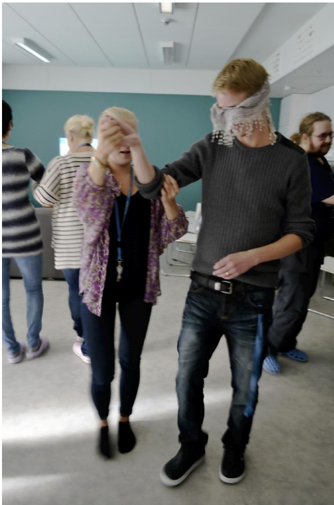
Kuva 3. Läsnaoloharjoitus Villa Kapteenin työyhteisössä.

Länsimaalaisen elämäntavalle on ominaista kiire ja tunne ajanpuutteesta, jolloin ihminen on kykenemätön olemaan läsnä omassa elämässä. Ihmisen huomio keskittyy helposti menneisiin tapahtumiin ja tulevaisuuden suunnitelmiin. Läsnaoleminen toiminnassa tarkoittaa sitä, että ymmärtää, ettei mitään tapahdu tulevaisuudessa, vaan läsnäolevassa hetkessä. Läsnaoleminen toiminnassa merkitsee sitä, että suuntaa huomionsa siihen, mitä kulloinkin on tekemässä. Totuus on, että muuta ei ole olemassakaan kuin vain ja ainoastaan mielen sisällä. Läsnaolon merkityksen tiedostaminen on mielenterveyttä ja yleistä hyvinvointia edistävä tekijä. Vaikka olosuhteet eivät ole sellaiset kuin itse haluaisi, voi kuitenkin nauttia läsnäolosta nykyhetkessä. Kokemukset ja maailma ympärillä tuntuvat elävämmiltä. (Homer 2011, 212-213. Tolle 2002, 61-62.)