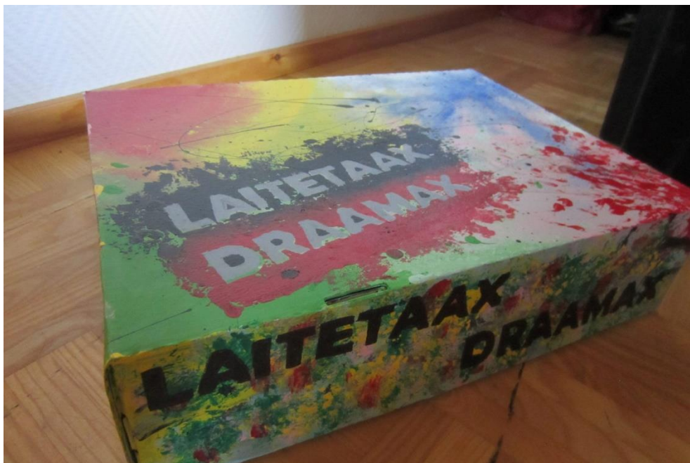
Liite 5: Tuote