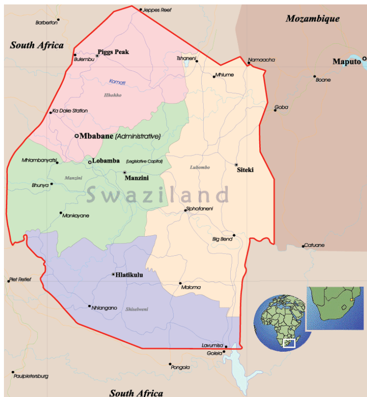
KUVA 1. Swazimaan kartta (Geographic Guide i.a.)

Eteläisessä Afrikassa sijaitseva Swazimaa on pieni, pinta-alaltaan noin 17 000 neliökilometrin kuningaskunta ja sisämaavaltio, joka itsenäistyi Britannian hallinnon alaisuudesta vuonna 1968. (CIA 2015.) Pohjoinen–etelä -akselilla pisin välimatka on 190 kilometriä ja itä–länsi -akselilla 145 kilometriä. Swazimaan rajanaapurit ovat Etelä-Afrikka ja Mosambik. Vuoristoinen maisema sekä biodiversiteetti tekevät maasta luonnonkauniin. (UNDP 2012, a.) Lämpötila vaihtelee vuodessa hieman yli 0 celsiuksesta yli 40 celsiukseen, ja sadekausi ajoittuu kesäkuukausille syyskuusta maaliskuuhun. (PHR 2007, 67.)