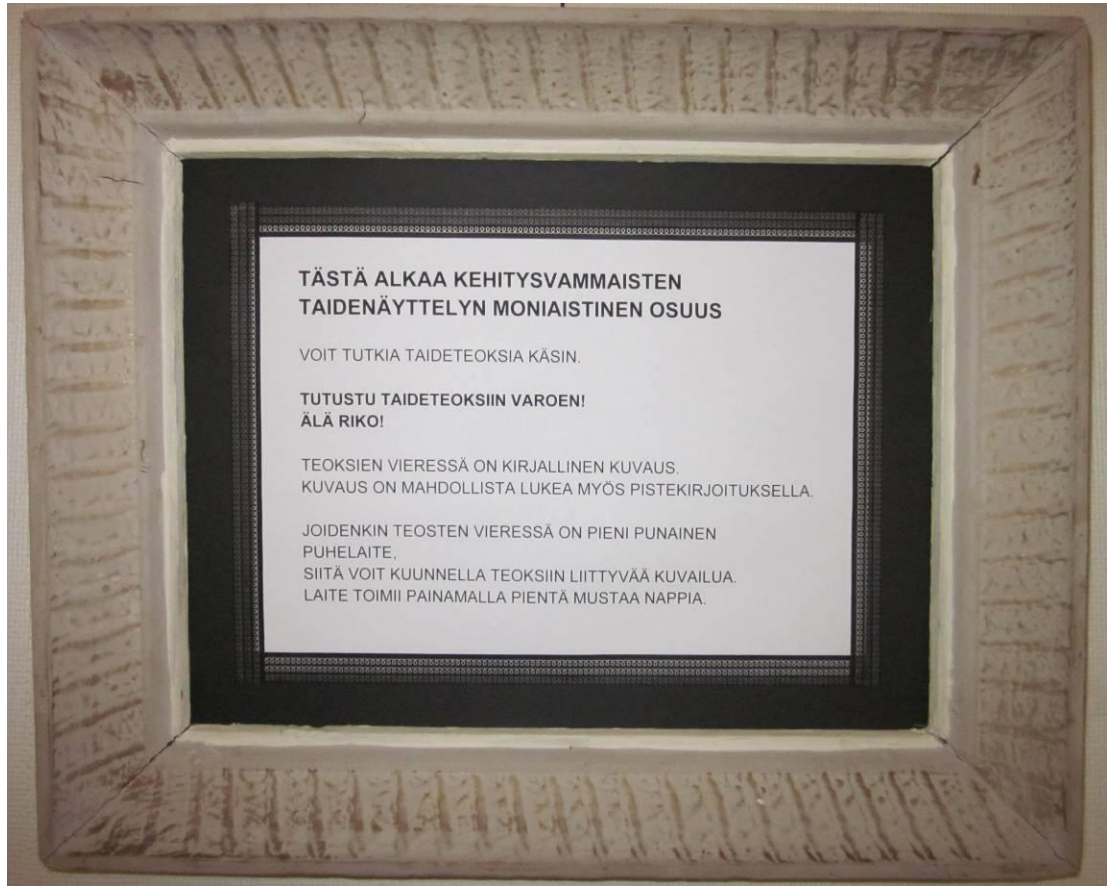
KUVIO 10. Ohjeistus näyttelyyn

tutustuessa. Vaikka teosten tunnusteleminen ja tutustuminen oli sallittua ja suotavaa, piti tämä kuitenkin tehdä varoen, teoksia rikkomatta.