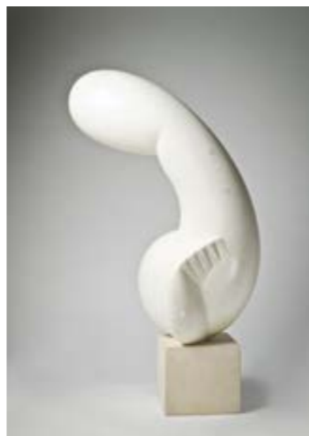
Constantin Brâncuși, Măiastra, white marble, 1915 - 1918