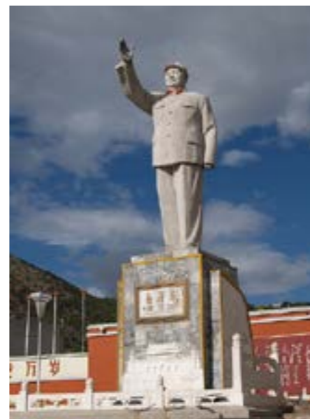
Maon patsas Linjangissa, Kiinassa.