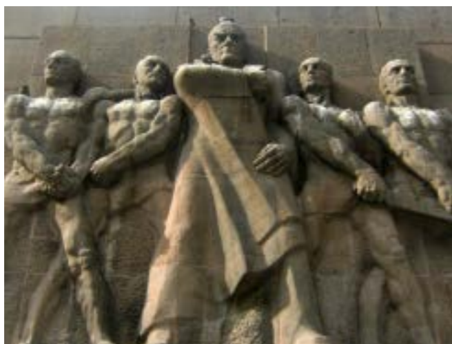
Josef Thorak, veistos Turkissa.

Keywords: masculinity, patriarchal, staty, war, feministic art, performance, freedom of speech