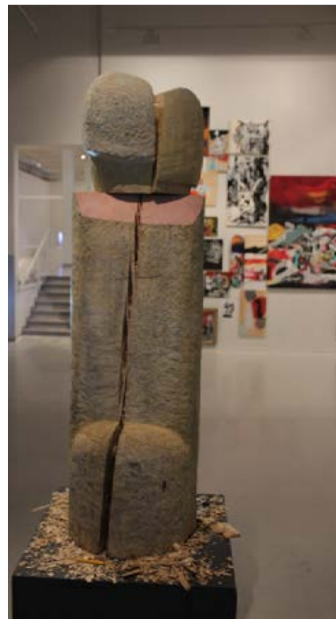
Installointikuva omasta teoksesta Pyhät alfa miehet