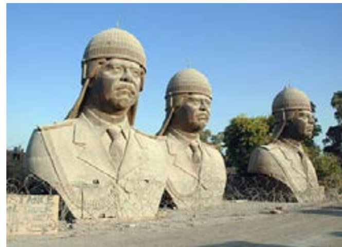
Saddam Husseinin pronssiveistoksia.