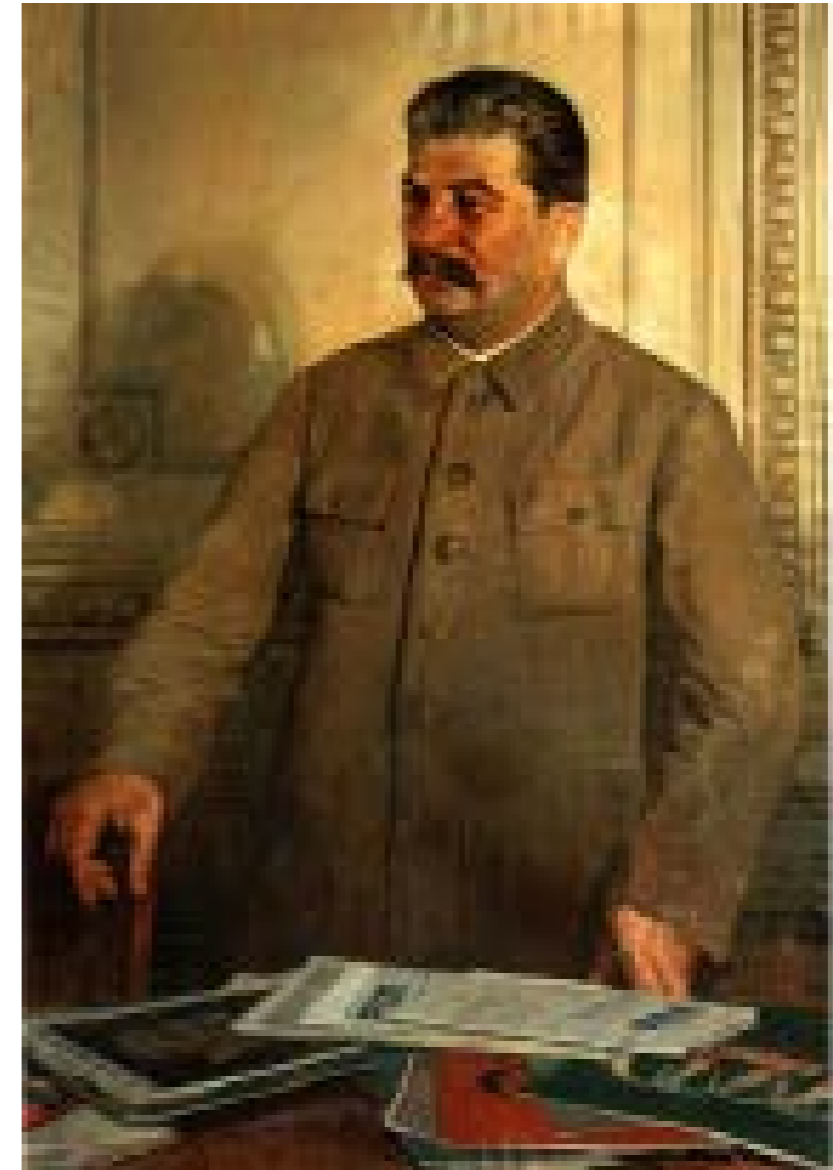
Isaak Brodski, Stalin, 1937.