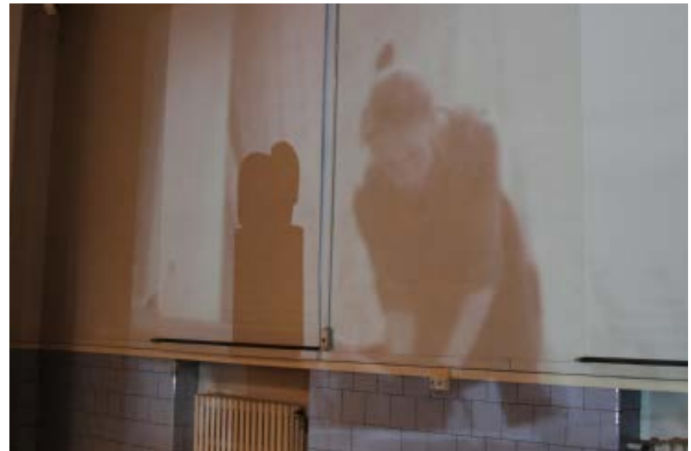
Installointikuva omasta teoksesta Pyhät alfa miehet