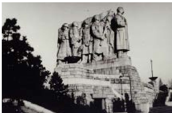
Stalin-monumentti 1955-1962, Praha.