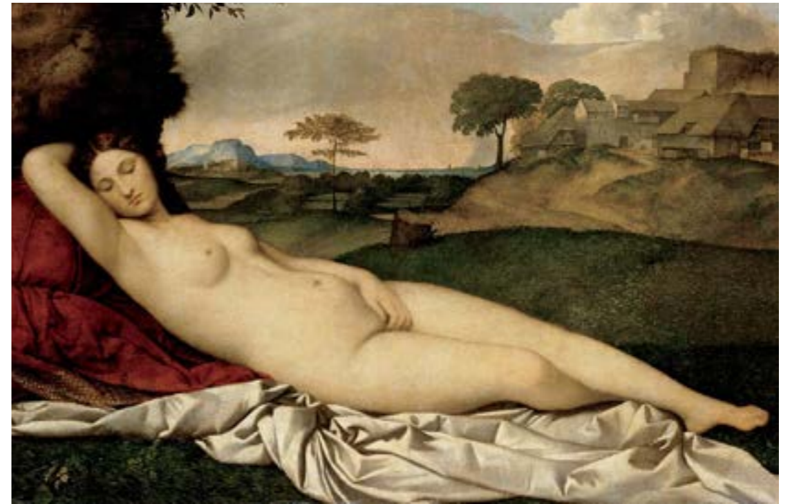
Sleeping Venus, Giorgione, Titian, c. 1510