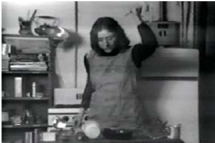
Martha Rosler. Semiotics of the Kitchen . 1975

Omassa videossani halusin viitata feministitaiteilijoiden teoksiin, jotka loivat alkua tasa-arvoiselle taidekuvastolle.