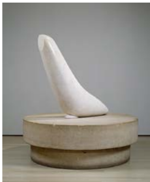
Constantin Brancusi. The Miracle