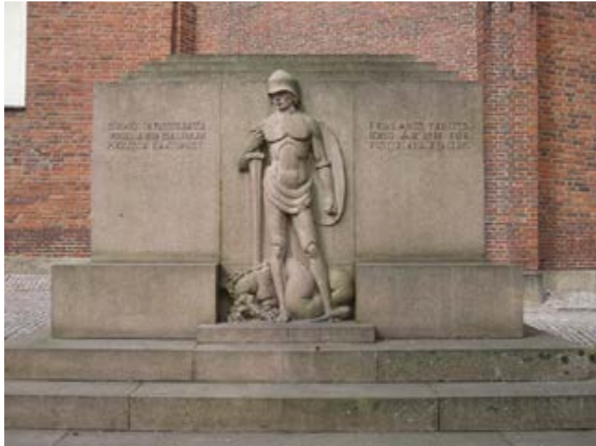
Valkoisten muistomerkki Tuomiokirkon edessä.