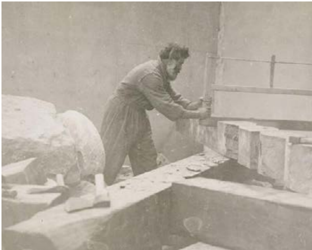
Brancusi. Omakuva työhuoneelta

Brancusi poseeraa kameran silmälle tarkoituksella. Kuvat selittävät, miten työkalua kuuluu pitää ja miten työ tulee tehdä. (Siukonen 2011, 54)