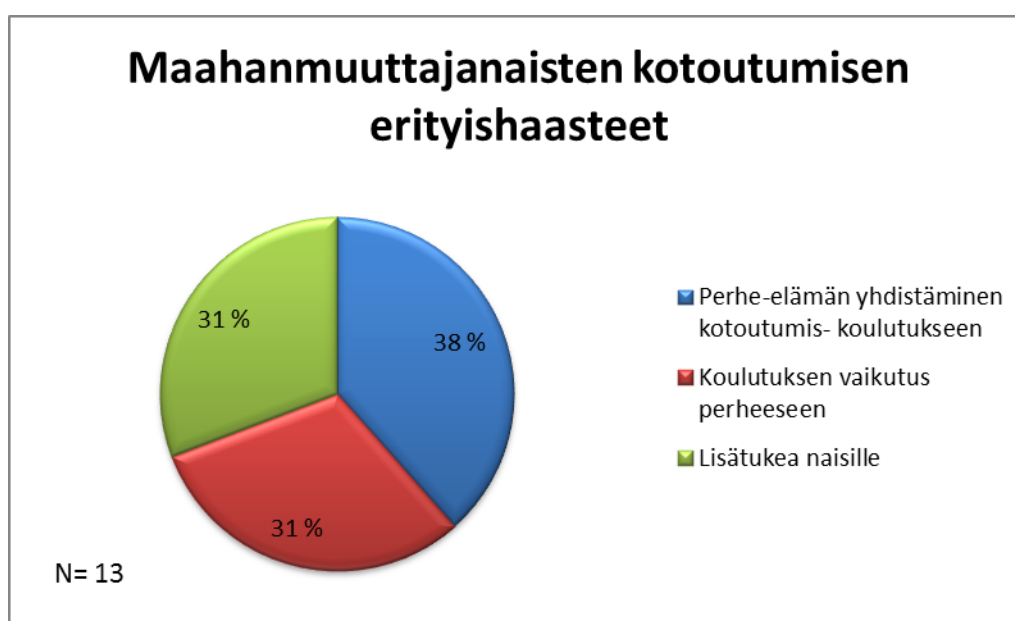
Kuvio 3. Maahanmuuttajanaisten kotoutumisen erityishaasteet

Kotimaassa hankittu koulutus ei välttämättä sovellu Suomen työmarkkinoille. Maahanmuuttaja joutuu käymään uudestaan vastaavan koulutuksen tai hän joutuu kouluttautumaan uudelleen. Jos maahanmuuttaja pääsee uudelleen koulutukseen, koulutus suoritetaan muulla kuin omalla äidinkielellä. Tämä voi tuntua hyvin ras-kaalta asialta maahanmuuttajalle. Kuitenkin tutkimuksessa selvisi, että vastaajat haluavat ja tarvitsevat koulutusta, mutta nykyiset koulutusjärjestelyt eivät sovellu heidän tarpeisiinsa.