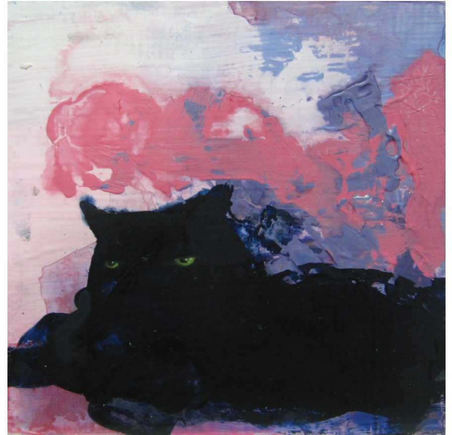
Teos maalausinstallaatiosta Meditation piece

EMMA:n oppaan tehtäviä toimittava haastateltavani esitti kommentin: "Taide on tärkeä kommunikaation väline ja sellaisena sen tulisi olla vapaa hyvinvointipalvelun tehtävästä, joka on täysin erillinen toimenkuva." Taiteilijat voivat toki toimia hyvinvointialojen kanssa yhteistyössä, mutta tällaiset viitekehukset vaikuttavat sisältöön ja muotoon. Yhteiskunnallisesti kommunikoiva, taiteellisista lähtökohdista syntyvä taide on erilaisen henkisen hyvinvoinnin ja sisällön synnyttäjä, kuin taide, joka on tehty hyvinvointipalvelujen lähtökohdista. Taideterapiat ja työpajat ovat omia alojansa, joille on myös omat paikkansa.