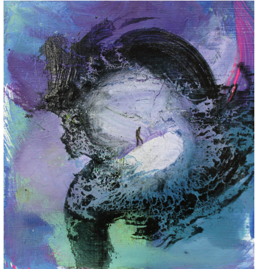
Teos maalausinstallaatiosta Meditation piece

Ajatellessani taidetta yhteiskunnan omanlaisenaan, kummallisena lapsena, joka tekee asiat vähän vinksallaan, kuten itse haluaa, tuottaa se minulle suunnattoman hyvän mielen.