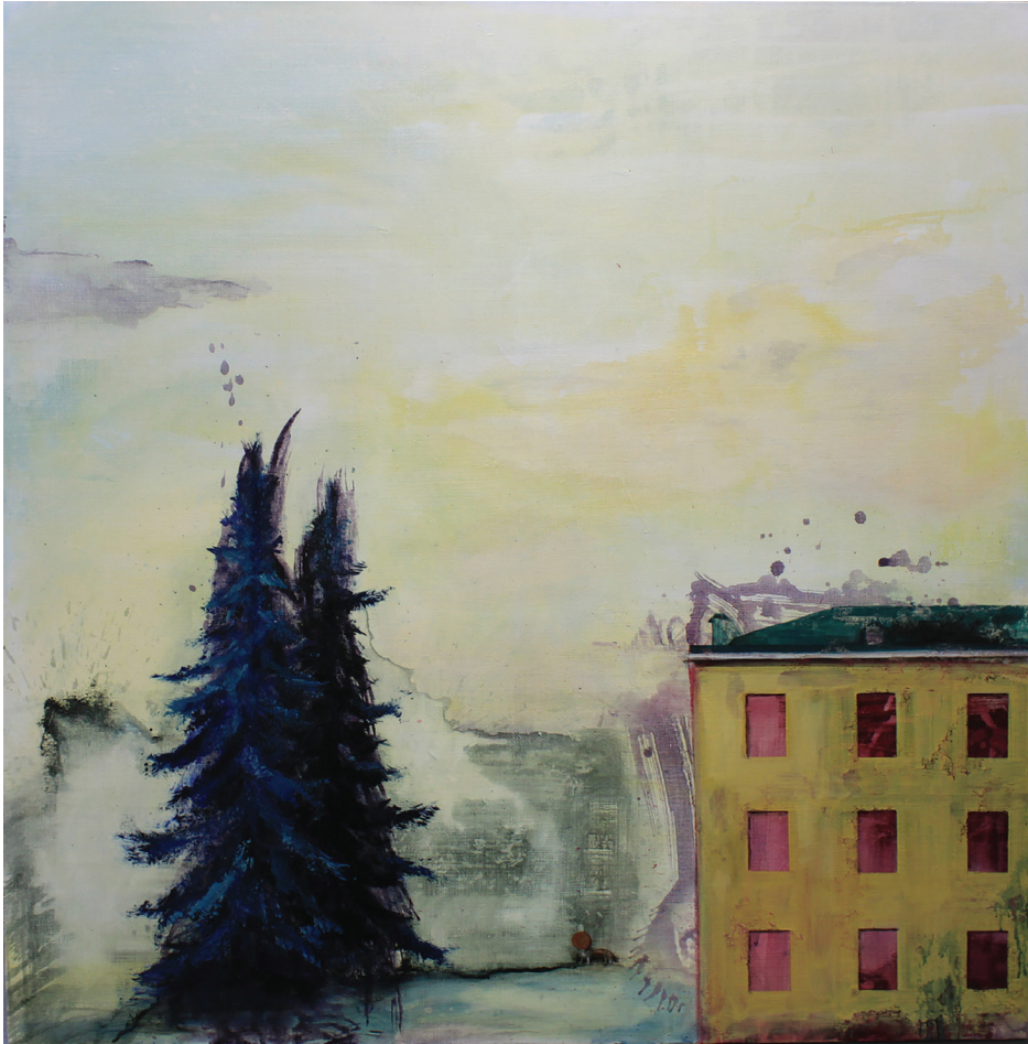
Järjen raunioilla: Naapuri myrkyttää koirani

Halusin alunperin akryyli- ja öljyvärimaalaussarjallani “Järjen raunioilla” kommentoida yhteiskunnassa vallitsevia epäkohtia, asioita, jotka tuntuivat ahdistavilta. Tarkoitukseni oli käyttää maalauksiani ikään kuin kommentteina, kuvataiteilijan mielipiteen ilmaisuna. Tämä olisi minun kanavan, mielipidekirjoitukseni, keinoni kommunikoida yleisön kanssa. Lopulta päädyin visualisoimaan tunteeni, joita ahdistavat asiat herättivät sen sijaan, että olisin maalannut esimerkiksi jotain poliittisesti alleviivaavaa. Maalaukseni eivät ole suoranaisia kommentteja poliittisiin jännitteisiin.