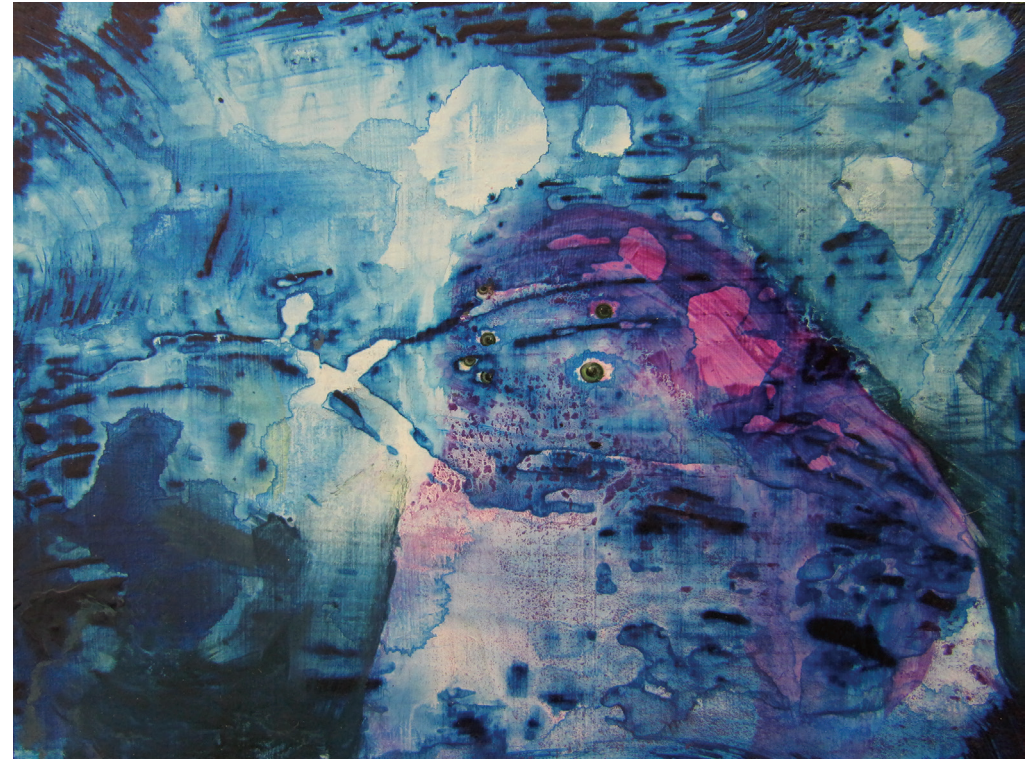
Teos maalausinstallaatiosta Meditation piece