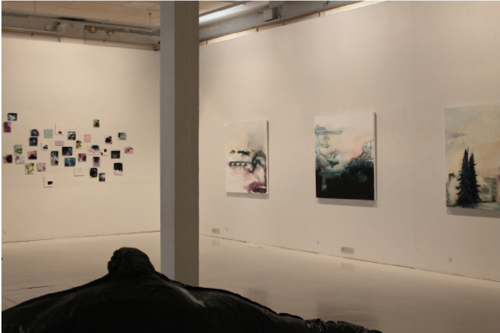
Opinnäytetyöteokseni installoituina taidekeskus Mältinrannassa

Kaikki tutkielmassa käytetty kuvamateriaali on opinnäytetyöteoksestani Järjen raunioilla (2015).