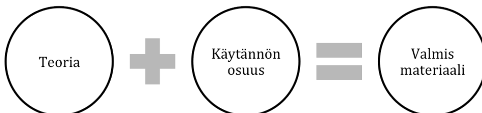
Kuvio 1: Opinnäytetyön eri osa-alueet.

Tavoitteena on mallintaa liikkeen avausprosessi mahdollisimman yksityiskohtaisesti, jotta liikkeen voi avata kuka tahansa laadukkaasti ja täysin liikkeen sijainnista tai avaajasta riippumatta. Malli on tärkeää kehittää ja saada käyttöön mahdollisimman pian, jotta liikkeen avauksen kustannukset ja toimenpiteet saataisiin selkeytettyä niin kustannusten kuin toimenpiteidenkin osalta mahdollisimman nopeasti. Ennen tätä toimeksiantoa liikkeen avaus oli monimutkainen, heikosti aikataulutettu ja käytännössä toteutettu etukäteen suunnittelematta. Tavoitteena opinnäytetyölle on myös, että toimeksiantaja voi hyödyntää opinnäytetyötä niin teoreettista kehystä kuin varsinaista valmista liikkeen avauksen malliakin.