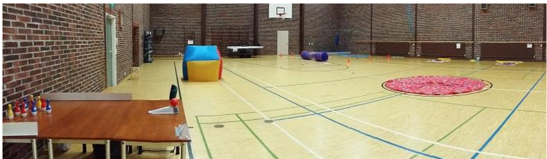
KUVA 2. Liikuntasali valmisteltuna liikuntatuokiota varten

Tutustumistuokion jälkeen perheet siirtyivät allasosastolle uimaan ja saunomaan. Tällä välin me autoimme Mikkelin seudun Invalidit ry:n työntekijöitä valmistelemaan liikuntasalin liikuntatuokiota varten (kuva 2). Liikuntatuokio sisälsi useita erilaisia pisteitä, joissa jokaisessa oli erilainen liikunnallinen tekeminen tai toiminta, kuten pöytäkeilaus, pingis, puhallustikka ja vapaa alue sählyn pelaamiseen. Liikuntatuokiossa oli otettu huomioon eri-ikäiset ja -tasoiset osallistujat niin, että jokainen pystyi osallistumaan toimintoihin. Liikuntatuokion aikana osallistuimme myös pöytäkeilausrastin ohjaamiseen ja vetämiseen.