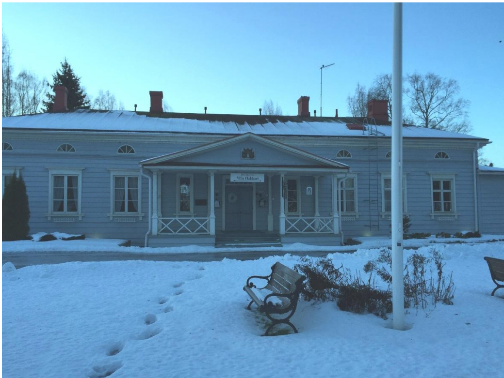
Kuva 3 Villa Hakkari

Villa Hakkarin kartano sijaitsee samassa pihapiirissä museoraitin kanssa. Uusklassisen Villa Hakkarin päärakennus valmistui noin 1820-luvulla, tuolloin tila oli Gustav Svinhufvudin hallussa. Perimätiedon mukaan kartanon on suunnitellut C.L Engel. Ravintola Villa Hakkari tarjoaa herkullisia ruokaelämyksiä upeissa Kuokkalankosken maisemissa. Kartano tarjoaa myös hyvät puitteet monenlaisille tapahtumille, esimerkiksi kokouksille tai perhejuhlille. (Villa Hakkari 2014.)