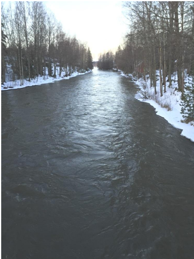
Kuva 5 Kuokkalankoski

Koskikellujilla on tarjota monipuolisesti erilaisia aktiviteetteja. Näitä aktiviteetteja ovat muun muassa koskikellunta, vesipallo, erilaisia lauttoja (pelastuslautta, saunalautta ja tukkilautta) ja kumilauttailua ympäri Lempäälää. (Koskikellujat 2014.)