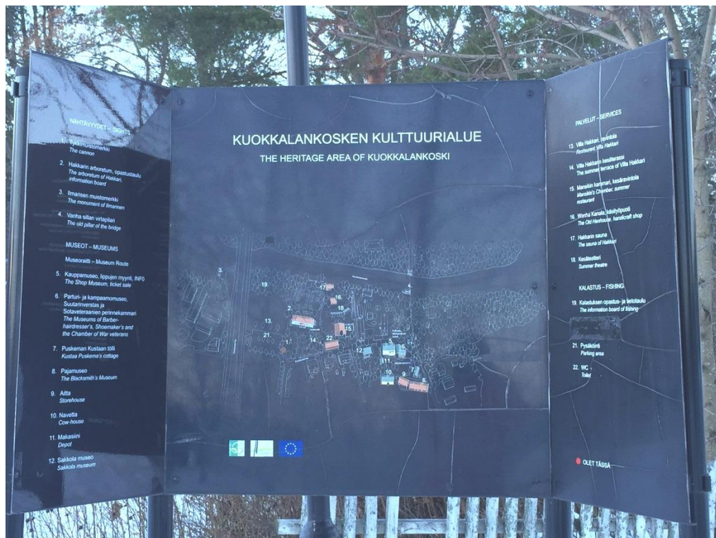
Kuva 1 Kuokkalan alue

Museoraitilla pääsee tutustumaan menneeseen aikaan. Kauppamuseossa voi nähdä 1930–1950 lukujen kyläkaupan myyntivalikoiman ja parturimuseossa voi tutustua sen ajan hiusmuotoiluun. Museoraitin nähtävyyksien lisäksi Kuokkalan alueella on ravintola Villa Hakkari sekä kaunis arboretum -alue. Kesäisin kartanon puistomaisemissa voi nauttia kesäteatteriesityksistä. Kuokkalankoski tunnetaan hyvänä kalapaikkana ja Team Koskikellujat järjestävät elämyksellistä ohjelmaa koskella ympärivuotisesti. (Lempäälän matkailuesite 2014.)