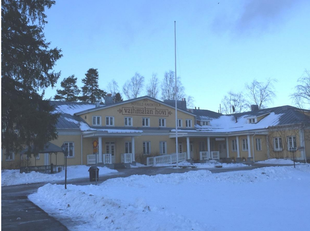
Kuva 4 Vaihmalan Hovi