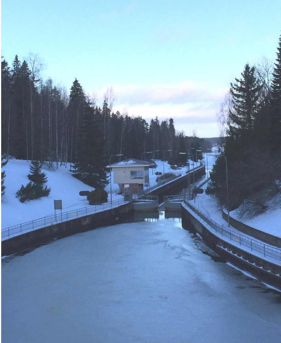
Kuva 2 Lempäälän Kanava