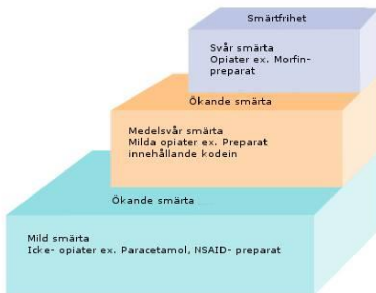
Bild 1. Världshälsoorganisationens (WHO:s) tre-stegs smärtlindrings trappa.

Inom analgetiska preparat finns det massor av olika produkter som kan användas vid smärta, de sträcker sig från enkla analgetika såsom paracetamol och NSAID-preparat till olika opiater i olika format. De här olika läkemedlen spelar en stor roll när det gäller behandling av sårrelaterad smärta. Det rekommenderas att den sort av analgetika som används borde ha en snabbverkande effekt och ge så lite biverkningar som möjligt. (Hollinworth 2005, s. 72).