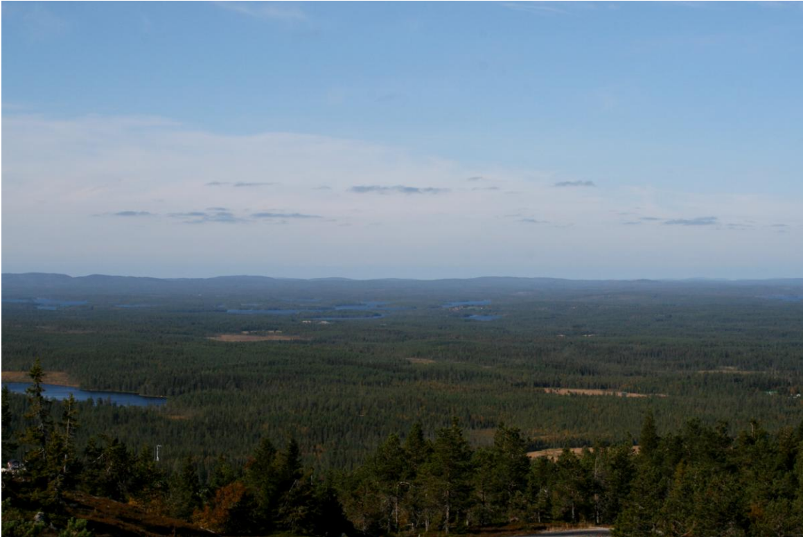
Kuva 1. Matkailun vetovoima Kuusamossa perustuu luonnon vetovoimaisuuteen ja luontoaktiviteetteihin

Ulkoilualueita ja -reittejä käytävillä on ulkoilukokemuksiin kohdistuvia odotuksia ja kävijän tyytyväisyys riippuu siitä, kuinka odotukset täyttyvät. Kävijöiden erilainen suhtautuminen metsänhoitoon ja luonnonsuojeluun näkyy myös siinä, millaisesta ulkoilumetsästä he pitävät [4] . Metsänhoito vaikuttaa metsien rakenteeseen ja maisema-arvoihin, joilla on merkitystä miellyttävän ulkoilukokemuksen muodostumisessa [5] .