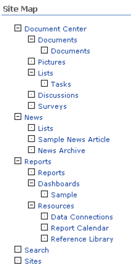
Kuva 2. Esimerkki sivukartasta (Huen 2010).

Lisäksi sivukartan otsikot toimivat suorina linkkeinä syvemmälle sivuston rakenteeseen. Sharepoint antaa useita mahdollisuuksia sivukartan rakentamiseen sivustolle (esim. Tetzlaff 2011). Myös valmiita (yleensä kaupallisia) ratkaisuja on tarjolla (Huen 2010). Kuvassa 2 on esimerkki SharePointilla toteutetusta sivukartasta, jossa näkyy tarvittaessa kerralla koko sivuston rakenne.