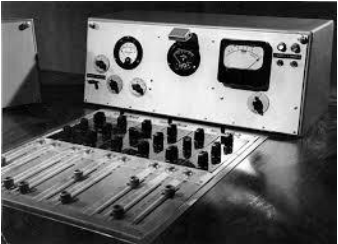
Kuvio 8. Miksauspöytä 60-luvulta, merkki tuntematon.

Vanhat miksauspöydät olivat yleensä 4-12 -kanavaisia äänipöytiä joissa ei ollut äänensävyyn muokkaamiseen kuin kaksi taajuuskorjainta (treble ja basso). Joissain miksauspöydissä ei ollut edes näitä, vaan pöytään kuului ainoastaan volume-säätö eli gain, jolla ohjattiin signaalin voimakkuutta nauhalle äänitettäessä. Nauhurit saattoivat olla 2-4 kanavaisia varsinkin 50-luvulla, mutta äänityspöytään saatiin yhdistettyä useampia mikkejä jotka summattiin sitten pienemmille raitamäärille. Miksauspöydät olivat hyvin erinäköisiä tämän päivän miksauspöytiin verrattuna. Miksauspöydissä oli isot pyöreät bakeliittinupit joilla signaalia voitiin säätää. Bill Putnam oli ensimmäisten joukossa kehittämässä ensimmäisiä miksauspöytiä ja hänen innovaationsa oli mm. cue eli aux, jolla pystyttiin lähettämään signaalia esim. kaikulaitteelle tai kaikukammioon ja palauttamaan se sitten miksauspöytään, jolloin kaiun määrää pystyttiin säätämään. Myös Tom Dowd oli innovatiivinen miksauspöydän kehittäjä. Hän toimi Atlantic Recordsilla äänittäjänä ja tuottajana. Hän keksi kollegansa Jerry Wexlerin mukaan mik-