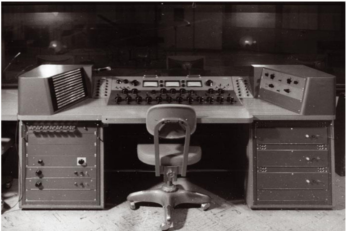
Kuvio 9. Miksauspöytä 50-luvulta, Rocket 4 console

sauspöytään lähes aina nykypäivänä kuuluvat faderit eikä käyttänyt isoja bakeliittinuppeja. Ensimmäiset äänipöydät on kehitetty vastaamaan yksittäisen studion tarpeita, eli ne ovat uniikkeja yksilöitä jotka on kasattu useista yksittäisistä etuasteblokeista. Äänipöytien massatuotanto alkoi vasta myöhemmin 60-luvulla. Ensimmäisissä äänipöydissä ei ollut dynamiikkaprosessointiin vaadittavaa erillistä sektiota ja äänensävyn muokkaamiseen tarvittavat säätömahdollisuudet olivat hyvin alkeellisia. Miksauspöydissä saattoi olla lineaarinen eq-säätö, jolla pystyi säätämään yläpään ja alapään (treble ja bass) suhdetta. Tämä myös lasku signaalin voimakkuutta ja lisäsi signaaliin säröä. Tällaiset asiat siis vaikuttivat äänikuvan luontiin ja soundia tehtäessä oli otettava huomioon että tietyt tekniset asiat kumuloivat ääntä tiettyyn suuntaan.