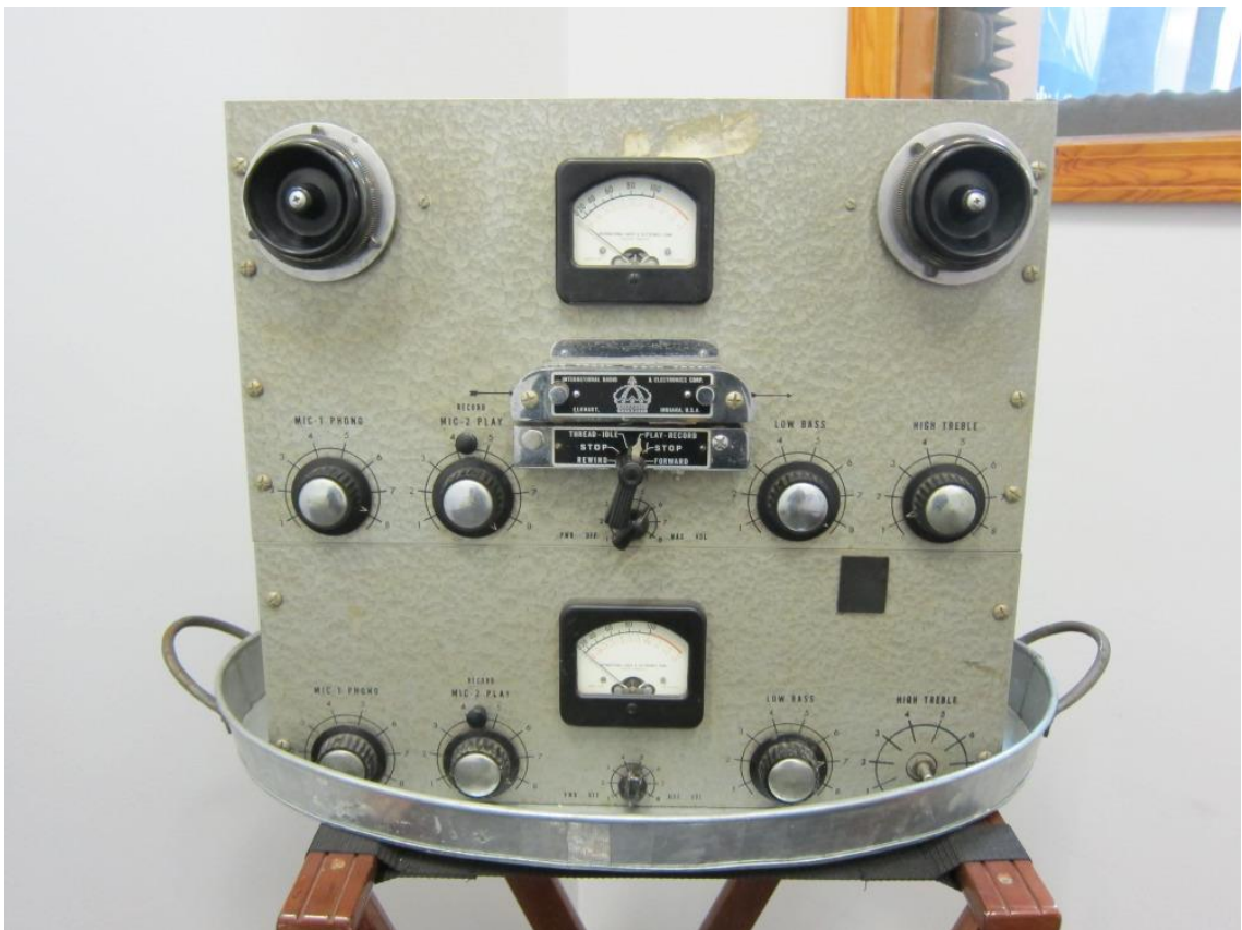
Kuvio 2. International radio & electronics corporation 2-kanavainen nauhuri.

Pienissä Amerikkalaisissa studioissa käytettiin enemmän Amerikkalaisia laitteita ja mikrofoneja koska ne olivat huomattavasti halvempia Saksalaisiin pitkälle kehittyneisiin laitteisiin verrattuna. Suurten levy-yhtiöiden isommissa ja kalliimmissa studioissa oli toki kalliit laitteet, mutta Sun studion kaltaisissa pienissä studioissa laitteet olivat halvempaa amerikkalaista laatua. Samoin blues-artisteihin erikoistunut pienyritys Chess Records studio käytti amerikkalaisia halvempia laitteita verrattuna esim. suuren Capitol levy-yhtiön studioon. Chess Recordsin laitteisiin kuului mm. amerikkalaisvalmisteisen international radio & electronics corporationin (IREC) laitteita kuten tämä 2-kanavainen nauhuri.