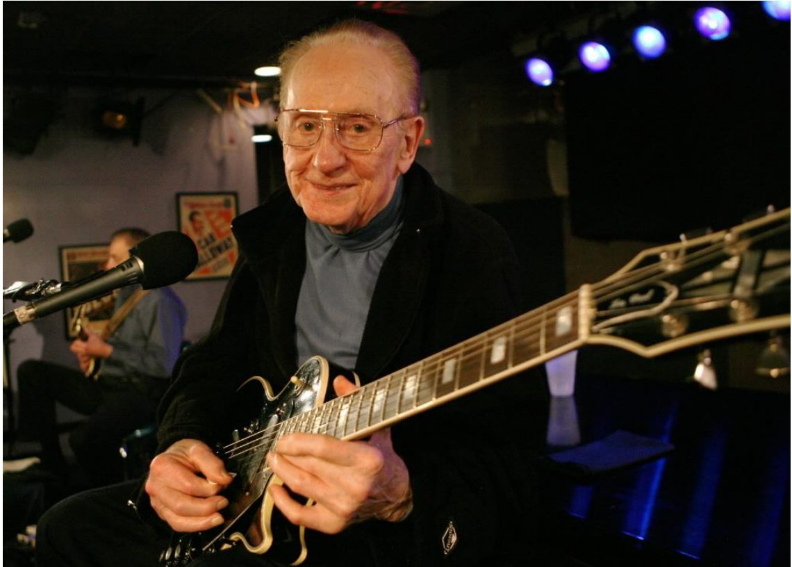
Kuvio 4. Les Paul

Yksi legendaarisimmista äänittäjistä, tuottajista ja laitekehittäjistä oli myös Tom Dowd. Hän toimi Atlantic Recordsilla äänittäjänä ja tuottajana ja tunnetuimpia artisteja joita hän on äänittänyt ovat mm. Clovers, Ruth Brown, Joe Turner, Clyde McPhatter, LaVern Baker, the Drifters and Ray Charles. Dowd keksi kollegansa Jerry Wexlerin mukaan volumefaderit, sen sijaan että olisi käyttänyt isoja bakeliitti nuppeja oma kehittämissään miksauskonsoleissa. Hän oli pianisti alunperin ja halusi käyttää miksauspöytää samaan tyyliin kuin pianoa, eli useampia säätimiä ja fadereita molemmille käsille. Hän löysi firman joka teki hänelle potentiometriset liukusäätimet, joita ei ikävä kyllä ehtinyt patentoimaan. Tom Dowd Nauhoitti usein kaiken yhdellä otolla. Hän käytti jo vuonna 1959 8-raita mankkaa mm. Ray Charlesin What I'd Say -kappaleessa.