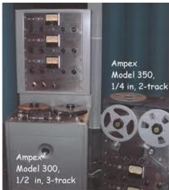
Kuvio 10. Ampex model 300, Ampex model 350

Kelanauhaäänitys yleistyi 40-luvun lopulla ja syrjäytti metodin jossa äänitettiin suoraan vinylille. Kelanauhurit kuten Ampex, RCA, Presto ja EMI olivat lähes suoria kopioita Saksalaisista kelanauhureista kuten Telefunken. Näistä suosituin studioissa ja radioissa käytetyimpiä olivat Ampex nauhurit. Ensimmäiset kuluttaja ystävälliset magneettiset tallentimet olivat halpoja lankatallentimia jotka tulivat markkinoille 1946. Tallentimet olivat lyhytaikainen hitti Amerikassa kunnes ensimmäiset halvat nauhatallentimet tulivat markkinoille 1948.