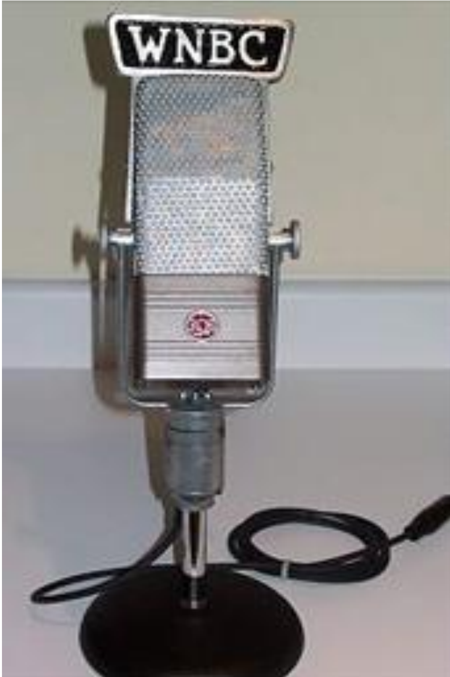
Kuvio 5. RCA 44bx