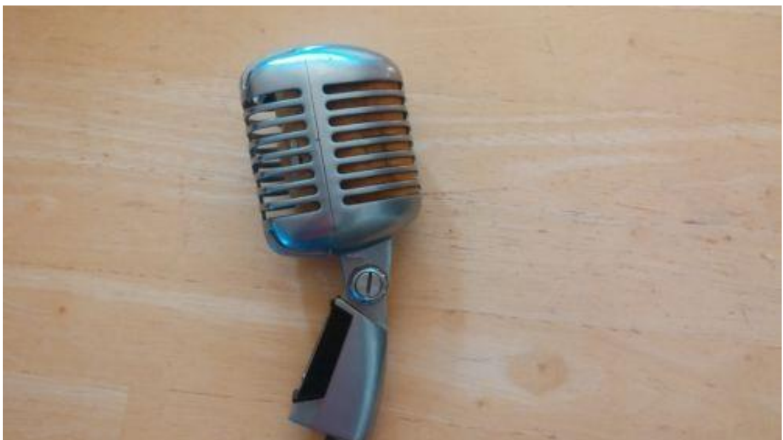
Kuvio 7. Shure 55S