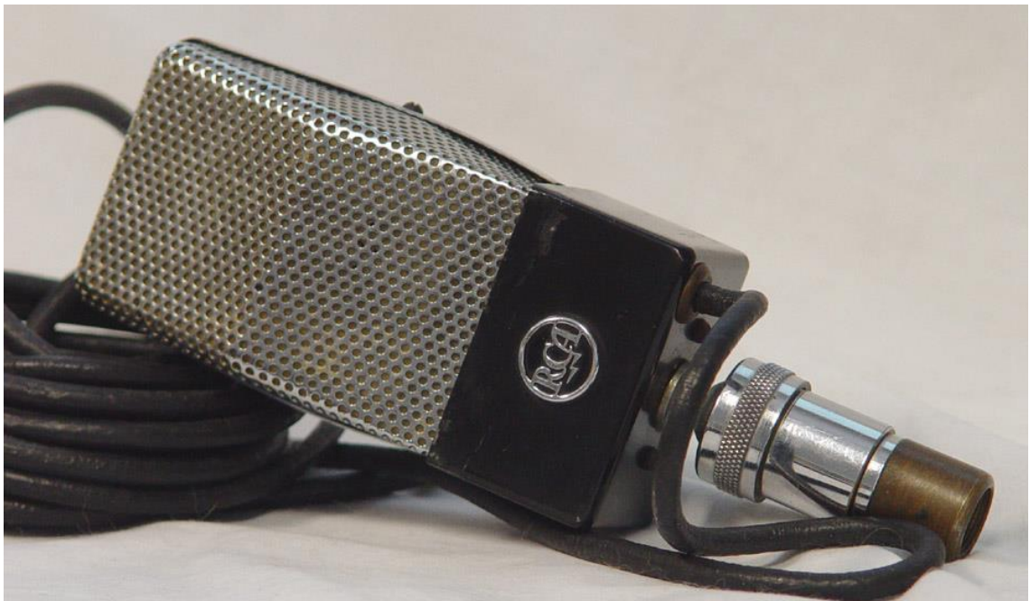
Kuvio 6. RCA B 74