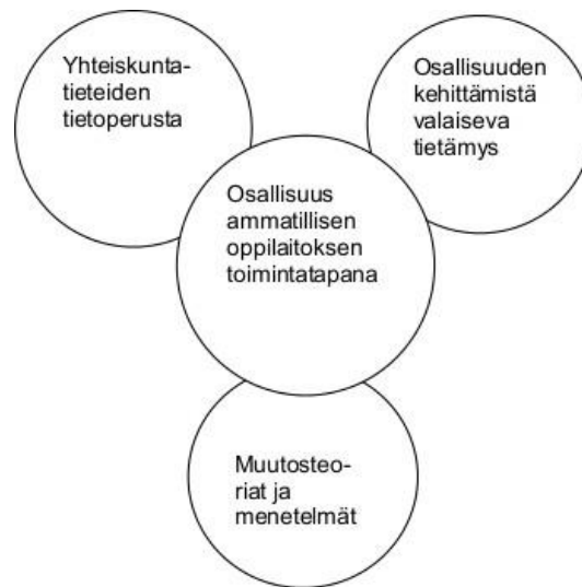
Kuva 3. Horellin ym. mallin pohjalta mukailtu malli osallisuuden kehittämisestä

Osallisuutta kehitettäessä on hyvä ammattilaistenkin pysähtyä pohtimaan ja rakentamaan osallisuuden ympärille tietoperustaa ja kerätä aineistoa kohde-ryhmältä, jotta keskellä oleva toimintatapa täydentyy. Projektiluontoisissa tehtävissä on helppo lähteä tielle, jossa kiireen tuntu ja aikaansaamisen innokkuus menevät suunnitelmallisuuden ja realististen tavoitteiden asettamiseen. Hyvin tehty hankesuunnitelma ja siihen sisältyvä aikataulukutus on hyvä pohja arjessa tehtävälle työlle.