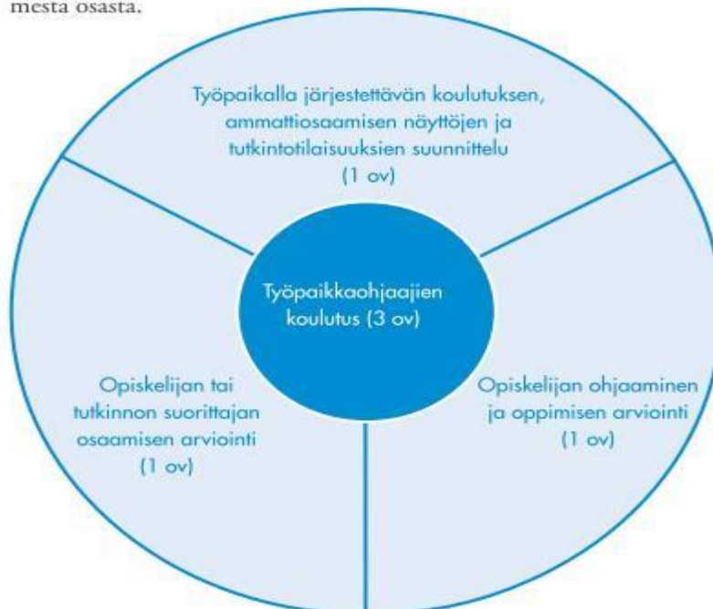
Kuva 3. Työpaikkaohjaajien koulutuksen runko

Työpaikkaohjaajien koulutus (3 ov) muodostuu kuvion 4 mukaisesti kolmesta osasta.