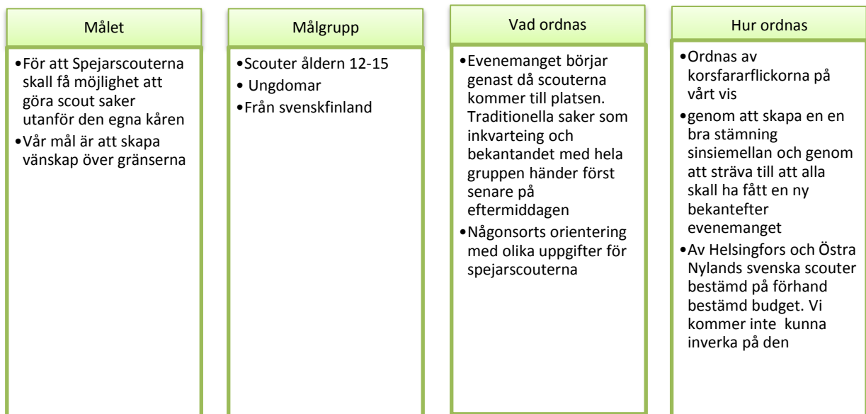
Figur 3Evenemanginfo för spejardagarna 2013