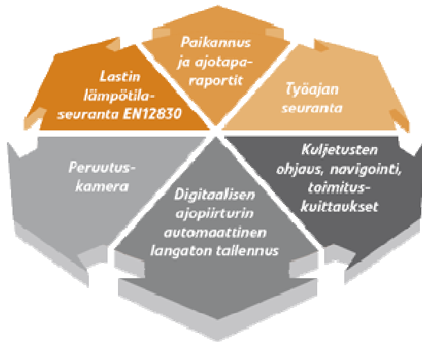
Kuva 1. AC-Panther-järjestelmän ominaisuudet kuljetusliikkeille (AC-Sähköautot Oy:n verkkosivut)

tietojärjestelmät räätälöidään asiakkaan toiveiden mukaisesti, mitä ominaisuuksia asiakas tahtoo käyttää. AC-Panther-tietojärjestelmä toimii verkossa, joten omaa ohjelmistoa ei järjestelmän käyttämiseen tarvita, yrityksen kotisivujen kautta asiakas pääsee kirjautumaan omalle hallintasivulle salasanan ja käyttäjätunnuksen avulla. AC-Panther-tietojärjestelmä mahdollistaa monipuoliset mahdollisuudet parantaa kuljetusyrityksen tehokkuutta (kuva 1). (AC-Sähköautot Oy:n verkkosivut)