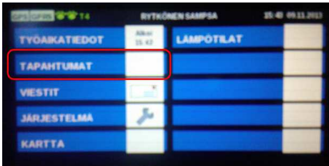
Kuva 3. Näkymä AC-Panther-ajoneuvotietokonepäätteen aloitusnäköisestä (ympyröitynä tapahtumat-sivun painike)

AC-Panther-ajoneuvotietokoneen päätteellä voidaan helposti lisätä tehdyt huoltotoimenpiteet, pesutapahtumat, yms. tietojärjestelmän tapahtumalokiin. Seuraavassa käydään prosessi läpi vaihe vaiheelta.