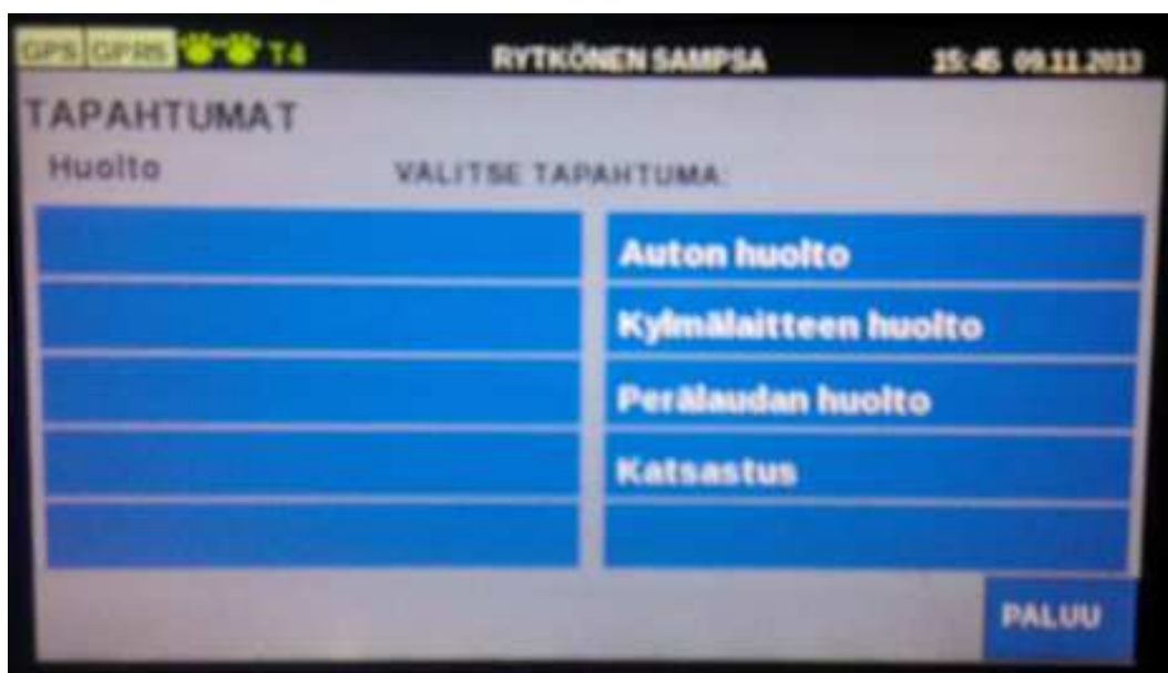
Kuva 5. Tapahtumat-valikon Huolto-alavalikko

Tapahtumat-valikosta (kuva 4) Huolto-näppäintä painamalla päästään Huolto-alavalikkoon, jossa voidaan valita huoltotyyppi, joka halutaan kirjata tietojärjestelmän tapahtumalokiin.