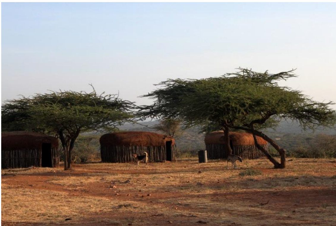
Kuva 3: Nalare-naisryhmän matkailukylän perinteisesti valmistetut majat