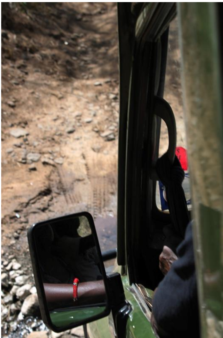
Kuva 14: Autoilu savannilla on haastavaa, vaikka siellä ei ole muuta liikennettä

Tämän kaltainen matkailukylä ilman mukavuuksia vetoaa vain pieneen kohderyhmään. Tämä rajoittaa matkailukylästä saatavia tuloja. Markkinointi ja mainonta on osattava suunnata juuri oikealle kohderyhmälle. Kohderyhmään vetoavat tekijät tulee säilyttää matkakohteessa. Afrikkaan matkustaminen on suhteellisen kallista (Suomesta), sillä lennot maksavat paljon ja matkaa varten tarvitsee hankkia kalliita rokotuksia sekä malaria-lääkitys. Matkustamisen hintaa lisää myös omatoimimatkustamisen vaikeus ja turvattomuus. Nalare-naisryhmällä ei välttämättä ole mahdollisuutta hankkia tietoa kohderyhmästään tai markkinoida matkailutuotteita. Markkinointi tapahtuu suurilta osin puskaradion välityksellä. Yhteisen kielen löytäminen paikallisten ja matkailijoiden välillä on haastavaa. Keniassa puhutaan laajalti englantia, mutta maaseudulla puhutaan usein vain paikallisia heimokieliä. Esimerkiksi opiskelijaryhmän mu-