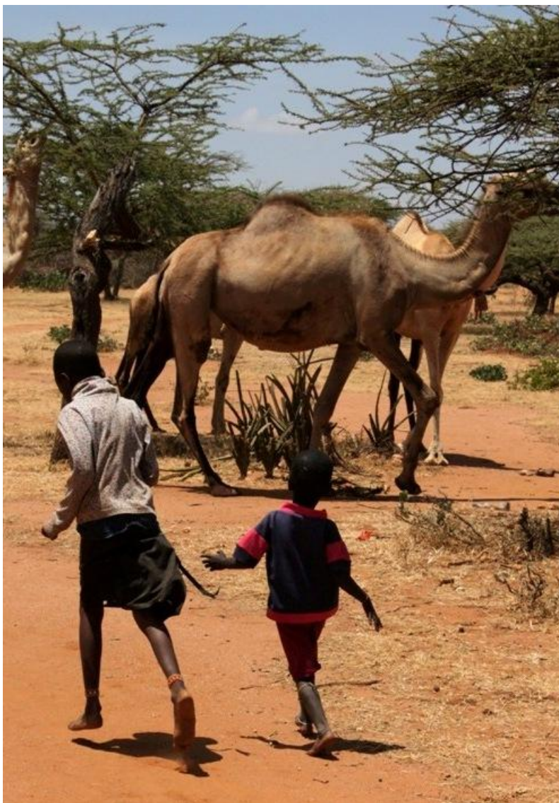
Kuva 6: Samburuiden karjaan kuuluu myös kameleita

Samburuiden ruokavalio koostuu suurimmaksi osaksi eläimistä saatavista tuotteista, kuten maidosta verestä ja lihasta, sekä avustuksena saatavista maissista ja soijasta. Eläimistä otetaan usein kuivana kautena vain verta, sen sijaan että koko eläin teurastettaisiin. Samburut teurastavat eläimiä lähinnä juhlatilaisuuksia varten. Vihanneksia tai hedelmiä samburut eivät käytä, sillä heimon asuinalue ei sovellu maanviljelykseen, eikä heimo ole koskaan viljellyt maata. Heimon jäsenet käyvät joskus markkinoilla, esimerkiksi ostamassa helmiä kylän naisten valmistamiin koruihin, mutta he eivät koe tarpeelliseksi käyttää varojaan monipuolisemman ravinnon ostoon ja usein varoja ei ole. Varallisuus mitataan vaimojen ja karjan määrässä, rahalla ei ole heimolle suurtakaan merkitystä. Rahaa tarvitaan kuitenkin lasten mahdolliseen koulunkäyntiin. (Pike 1999, 211.)