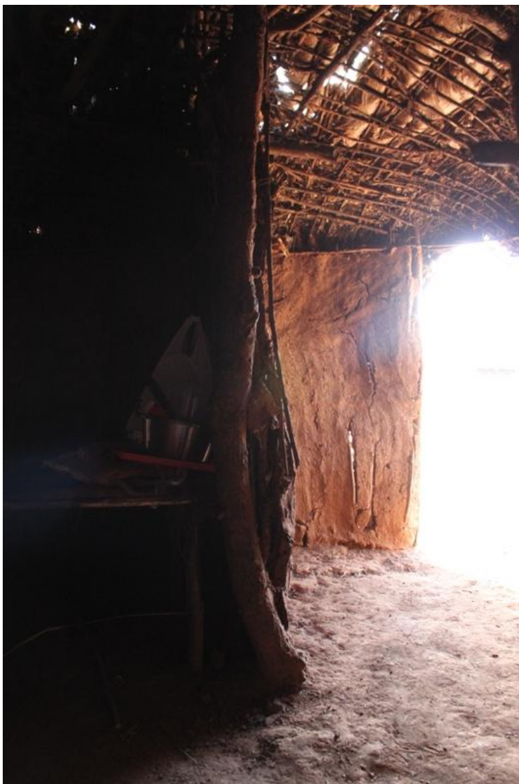
Kuva 7: Matkailukylän maja sisältäpäin