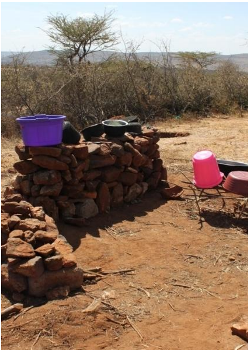
Kuva 9: Kivistä rakennettu pöytä tiskaamista ja ruoanvalmistusta varten

burut kokivat opiskelijoiden tavan valmistaa ruokaa ulkona omituiseksi, sillä perinteisesti kaikki ruuanlaitto tapahtuu sisällä majoissa. Opiskelijat rakensivat käyttöönsä ruoanlaittopisteen, johon sisältyi kivistä rakennettu pöytätaaso (Kuva 9), tulisija ja kuoppa jätteille. Kuitenkin on huomioitava, että opiskelijat toivat mukanaan paljon kasviksia ja vihanneksia ja näiden valmistaminen vaatii pilkkomista ja esivalmisteluja. Samburuiden perinteinen ruokavalio vaatii esivalmisteluja vain juhlatapauksissa, jolloin syödään lihaa. Näin ollen isommille tulisijoille ja ruuanvalmistustiloille ei varsinaisesti ole edes tarvetta.