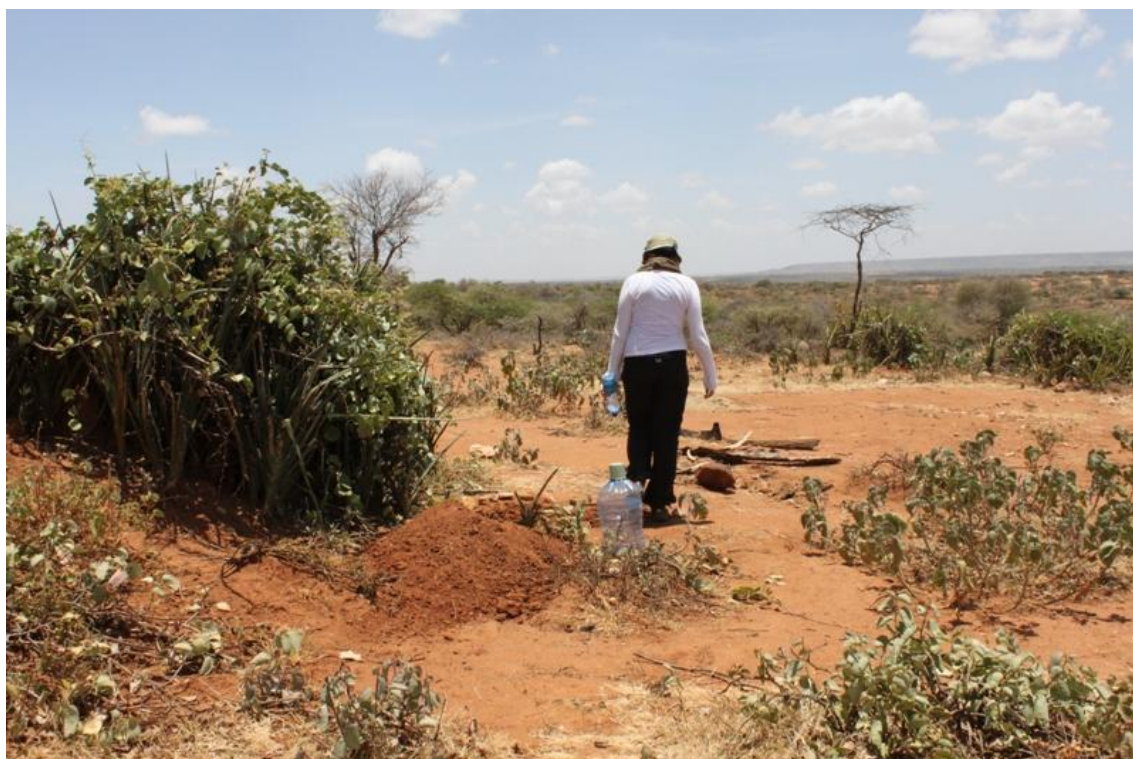
Kuva 16: Opiskelijaryhmä kaivoi itselleen käymäläkuopan

Tärkeintä matkailukylän kehityksen kannalta on, että se tapahtuu paikallisten ja ympäristön ehdoilla. Muutoin kohteen vetovoima häviää. Joitain helpottavia länsimaalaisia mukavuuksia opiskelijaryhmä kaipasi, esimerkiksi parempaa käymälää (Kuva 16) ja peseytymismahdollisuuksia. Alueella ei ole juoksevaa vettä, joten käymälä ja peseytyminen tulisi toteuttaa vaihtoehtoisin keinoin. Peseytymismahdollisuuksia ei tällä hetkellä ole ollenkaan. Matkailijoille voitaisiin keittää lämpimäksi peseytymisvettä ja tarjota mahdollisuus kompostikäymälään. Yksi vaihtoehto olisi yhteistyö jonkin lähialueella sijaitsevan lomahotellin kanssa. Matkapakettiin voitaisiin liittää joitain öitä Nalare-naisryhmän kylässä ja osa öistä vietettäisiin mukavasti lomahotellissa. Tämänkaltaisessa järjestelyssä kokemuksen autenttisuus kärsisi, mutta mukavuus matkailijalle olisi suurempi. Tämä myös laajentaisi kiinnostunutta kohderyhmää, sillä kovin moni matkailija ei ole valmis viipymään viikkoa oloissa, joissa peseytyminen on hyvin hankalaa. Käymälän suunnittelussa on myös huomioitava sen nopea täyttyminen. Käymälä voitaisiin rakentaa kehitysyhteistyöprojektina, joka edistäisi kohteen vetovoimaisuutta matkailijoille.