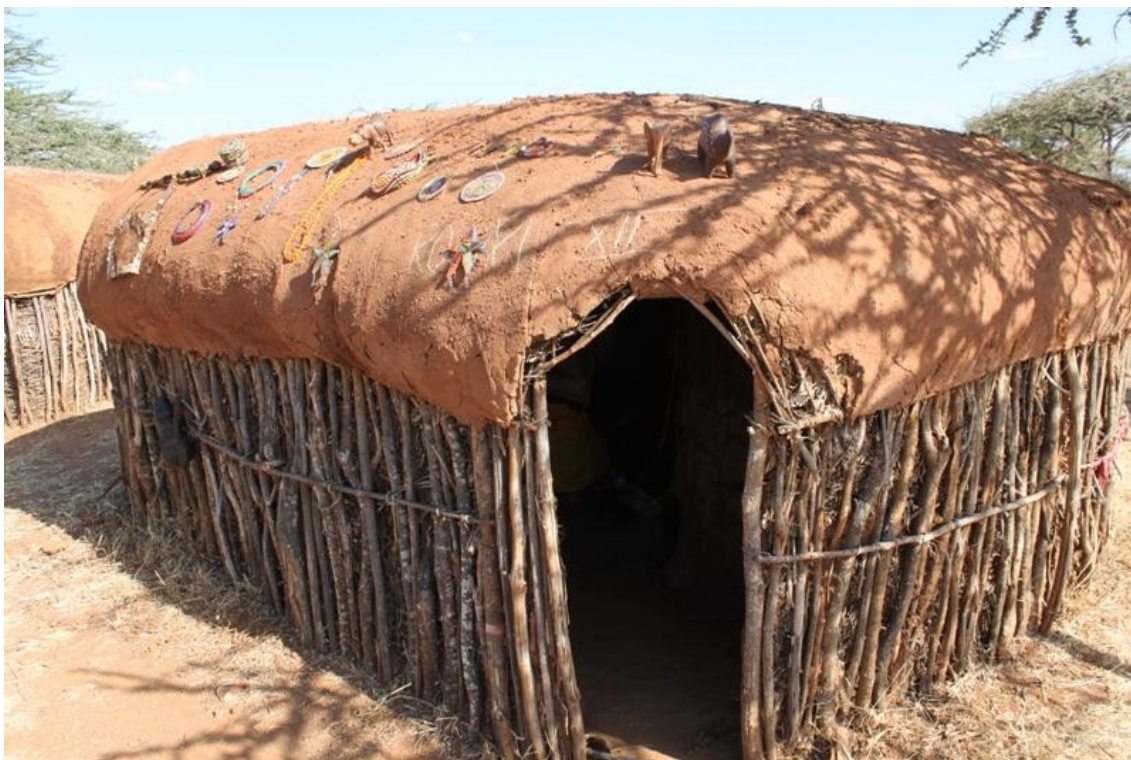
Kuva 5: Samburu-heimon perinteiset majat on rakennettu muuraamalla lantaa oksakehikon päälle