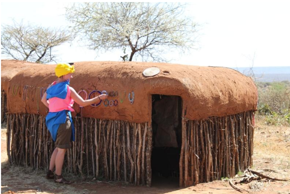
Kuva 2: Matkailijalla on paikallisilta lahjaksi saadut vaatteet päällä ja hän laittaa paikallisten tekemiä koruja esille

Tärkeintä eettisessä matkailussa on tutustua kohdemaahan ennen matkaa. Kohdemaan kultuuria ja pukeutumista kuuluu kunnioittaa (Kuva 2). Matkailija sopeutuu paremmin joukkoon, kun tutustuu paikallisiin käytöstapoihin etukäteen. On tärkeää kunnioittaa paikallisia uskomuksia ja uskontoja sekä niistä johdettuja käyttäytymissääntöjä. Lomallakin voi tehdä vapaaehtoistyötä. Useita projekteja löytyy ympäri maailmaa. Suosimalla paikallisia palveluita tuetaan maan työllisyyttä. (KILROY 2013.) Monessa köyhässä maassa matkailu tuo maalle merkittävästi työpaikkoja. Varsinkin Afrikassa matkailulla työllistetään naisia ja kouluttautumattomia. Maan olot saattavat turismin myötä parantua; rakennuksia ja teitä korjataan sekä palvelut paranevat. Matkustusinto uhanalaisille paikoille saa paikalliset varjelemaan alueita elantonsa vuoksi. (Kalmari & Kelola 2009, 8.)