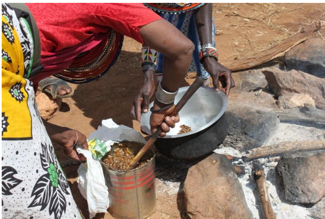
Kuva 8: Mehiläisvahan sulatus

(Kuva 8), jota voi hyödyntää saippuassa), naisten jo valmistaman elefantin lantapaperin jatkojalostus, naisten valmistamien helmikorujen jatkojalostus sekä tulisijojen rakentaminen. Samburunaisten valmistamien tuotteiden kehittelyllä pyrittiin lisäämään niiden myyntiä ja tuomaan vaihtoehtoisia näkökulmia muotoiluun ja toteutustekniikkaan. Samburut valmistavat helmikoruja sekä itselleen, että myyntiin. Perinteiset värivalinnat ja muotokieli eivät välttämättä vetoa valtaosaan matkailijoista, mutta pienillä muutoksilla koruille on mahdollista saada suurempi kohderyhmä. Perinteiseen malliin valmistettujen korujen tekoa on kuitenkin tärkeää jatkaa, sillä matkailijoiden joukossa on aina yksilöitä, jotka ovat kiinnostuneita ostamaan juuri alkuperäisiä koruja. Korujen valmistus on naisille tärkeää yhteistä aikaa. Saippuprojektin perimmäinen tarkoitus oli lisätä myyntiin valmistettavien tuotteiden määrää ja hyödyntää alueella jo olemassa olevaa raaka-ainetta. Tulisijojen rakentamisella pyrittiin etsimään ratkaisua heimolaisia vaivaaviin silmä- ja keuhkosairauksiin (Pike 1999, 211.)