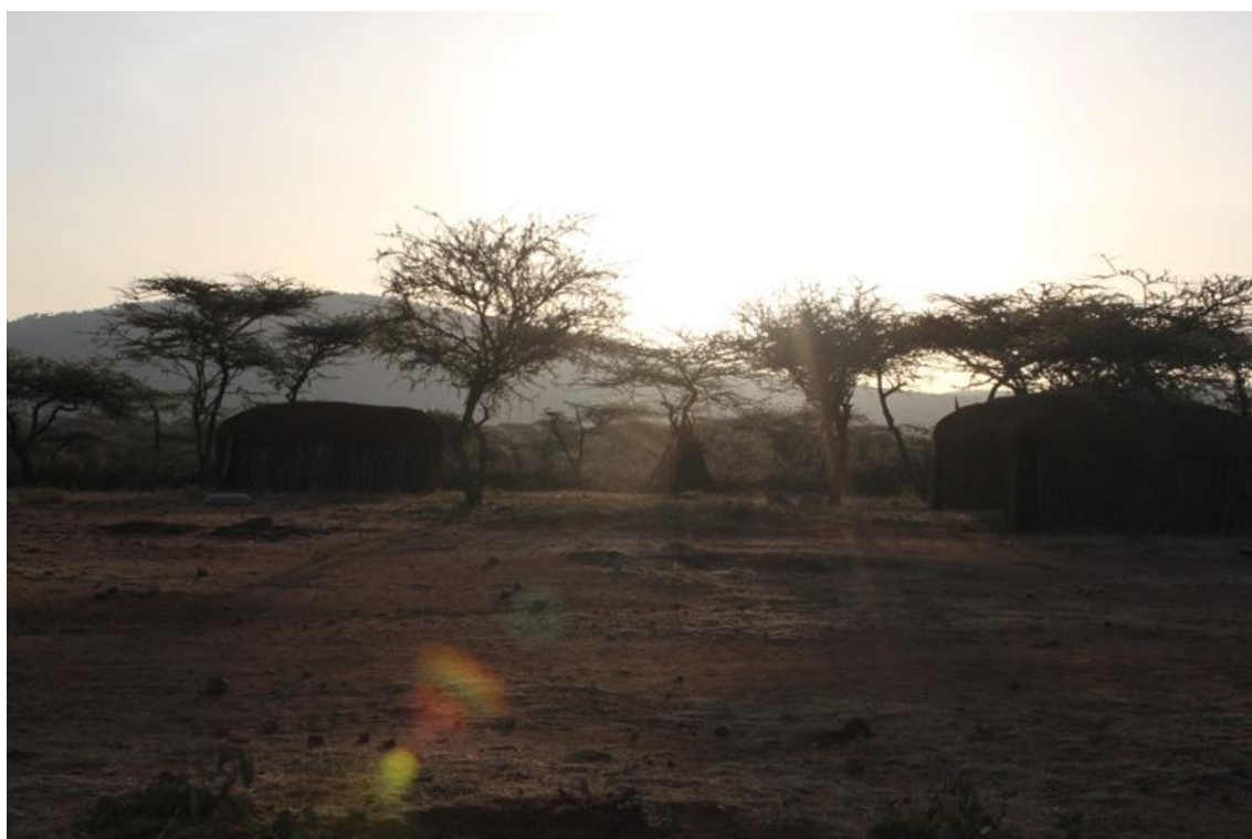
Kuva 1: Matkailukylä Keniassa

Seuraavissa luvuissa kerrotaan eettisestä ja ekologisesta matkailusta. Kestävä kehitys on tärkeää suunniteltaessa matkailua alkeellisiin olosuhteisiin (Kuva 1). Sen avulla matkakohdetta pyritään pitämään mahdollisimman samanlaisena, jolloin luontoa ja väestöä siellä ei muuteta. Matkailu on riippuvainen luonnon- ja kulttuuriympäristöistä. Turismi muuttaa alkuperäistä ympäristöä vähitellen. Kestävällä kehityksellä halutaan muuttaa resurssipohja uusiutuvaksi luonnonvaraksi. Kestävä kehitys on noussut peruskäsitteeksi ympäristön huomioon ottavassa matkailussa. (Vuoristo 2000, 206, 220.) Kehityksen tarkastelu kestävyuden kautta on erityisen tärkeää juuri kehitymättömissä oloissa toteutettavan luontomatkailun saralla. Matkailun vaikutukset paikallisväestöön korostuvat kehitymättömissä maissa. Paikallisväestö saattaa menettää maitaan matkailuyrityksille tai joutua toimimaan pakotetussa yhteistyössä yritysten kanssa. Kehittyvissä maissa kestävän kehityksen huomioiminen on tärkeää, sillä näillä mailla ei ole mahdollista toistaa teollisuusmaiden virheitä.