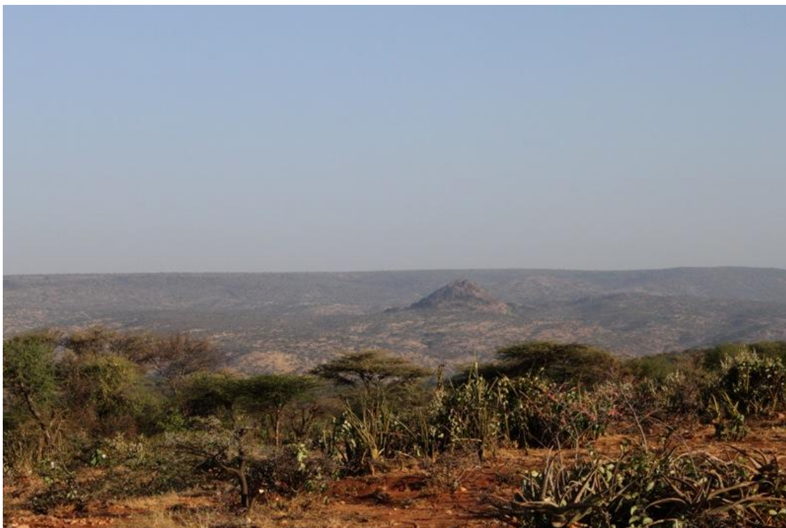
Kuva 4: Kenian luontoa