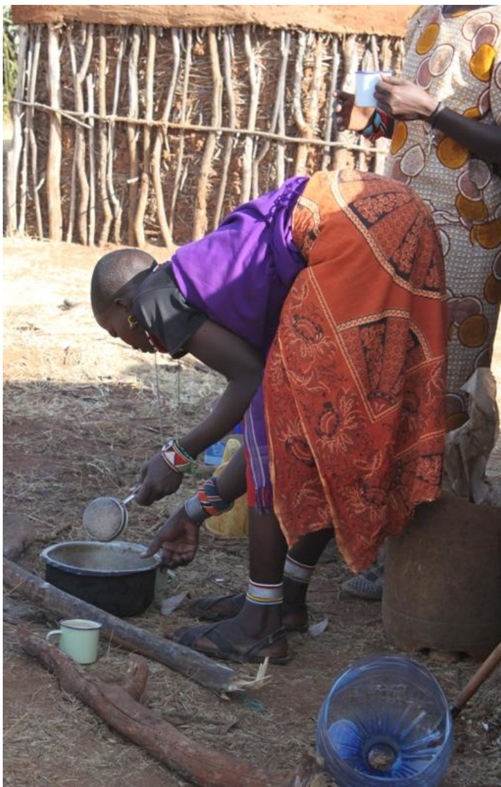
Kuva 11: Paikallisten teen keittoa