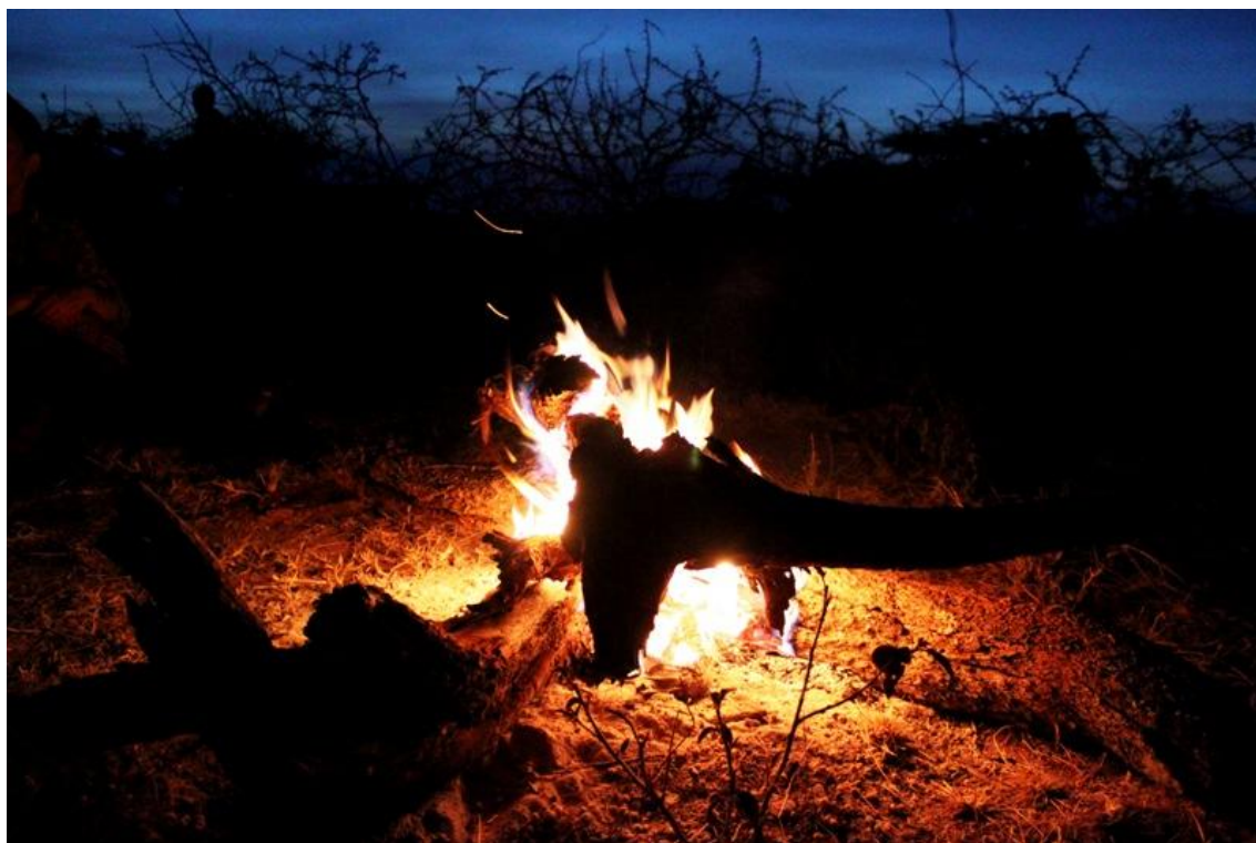
Kuva 10: Maja-alueen iltanuotio luo tunnelmaa

eella ja on huomioitava tarkasti, ettei matkailijoiden majoittaminen rasita alueen luonnonvaroja liikaa. Opiskelijaryhmän majoittuessa heimon parissa viikon ajan osa vedestä tuotiin ryhmän mukana, mutta tämän veden loputtua käytettiin vettä yhteisestä lähteestä. Kymmenen hengen vedentarpeen tyydyttäminen jo ennestään niukasta lähteestä kuluttaa sitä kohtuuttomasti. Alueella oli muitakin lähteitä ja avustusjärjestön ylläpitämä lähde, mutta matka niihin oli huomattavasti pidempi kuin kuivuneessa joen uomassa sijainneeseen. Polttopuita kului opiskelijoiden asuttamien majojen lämmityksen lisäksi myös lähes joka ilta ylläpidettyyn isompaan nuotioon maja- alueen keskellä. Nuotio toi turvallisuuden tunnetta, sitä ei kuitenkaan käytetty ruuanvalmistukseen sillä ruuanvalmistus on naisten tehtävä ja perinteisesti naiset eivät tule sisälle tämänkaltaiseen nuotiopiiriin. Ruuanvalmistukseen oli siis pienempi nuotio erikseen. Nuotio lisäsi tunnelmaa ja mahdollisti päivän tapahtumien läpikäynnin auringon laskun jälkeen, mutta tämänkaltaisen ison nuotion (Kuva 10) polttaminen ei ole Samburuille normaalisti jokapäiväistä. Opiskelijaryhmä koki myös arvottavana sen, että heidän oli mahdollista istua nuotiopiirissä, mutta paikallisten naisten ei. Nuotiopiirissä oli mahdollista keskustella paikallisten miesten kanssa, mutta naiset jäivät ulkopuolelle.