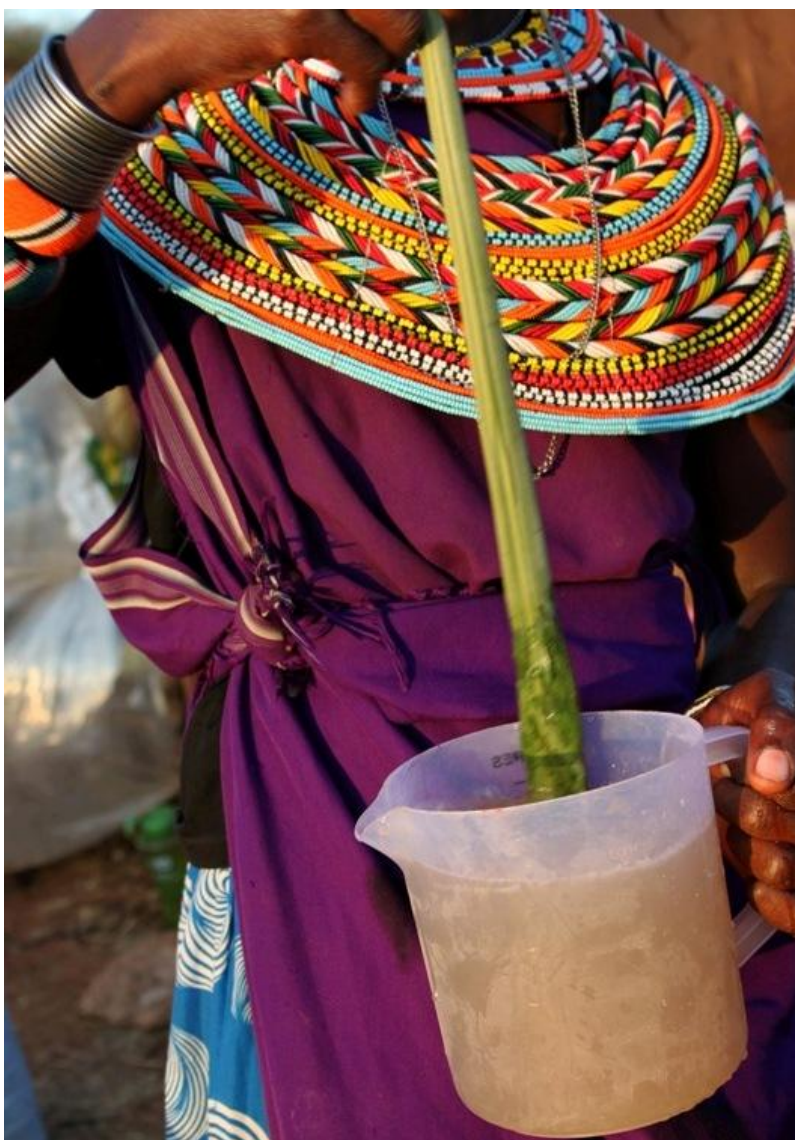
Kuva 12: Juomaveden puhdistusta kasvin avulla

Nalare-naisryhmän ylläpitämän matkailukylän heikkous on sen vaikea saavutettavuus. Sinne ei ole julkista liikennettä, ainoa vaihtoehto on yksityisautoilu. Yksityiskoneella on mahdollista laskeutua alueen lähistölle, mutta varsinainen lähin lentokenttä sijaitsee pääkaupunki Nairobissa ja pienlentokoneiden lentoturvallisuus on huono. Liikenneturvallisuus koko Keniassa on erittäin heikko (Kuva 13) ja teiden kunto (Kuva 14) huono. Pimeällä kannattaa välttää liikkumista, sillä rikoksen uhriksi joutumisen mahdollisuus on tällöin suuri. Katuvalojen puuttuessa myös eläimistä johtuvat autokolarit ovat yleisempiä yöllä. (Suomen suurlähetystö 2013.)