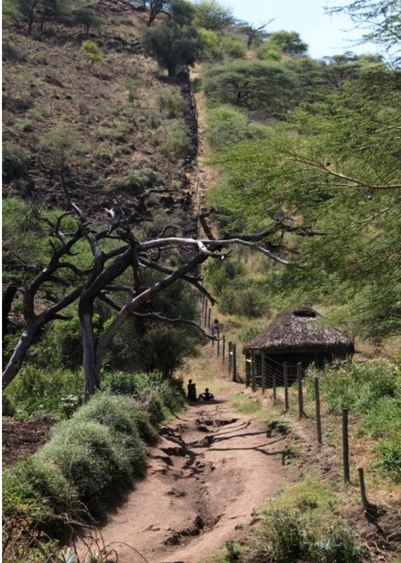
Kuva 15: Aita rajaa vasemmalle laidunmaan ja oikealle luonnonsuojelualueen

Jo lähes vuosikymmen sitten Kenian taloudesta kymmenen prosenttia pohjautui matkailuun (Vuorenmaa 2005). Matkailu on edelleen kasvava elinkeino Keniassa ja on nousemassa pääelinkeinoksi maatalouden ohelle. Tämä muuttaa maan elinkeinorakennetta suhdanneherkempään suuntaan, sillä matkailu on altis talouden vaihteluille. Taloudellisen tilanteen heikentyessä matkailijoiden kotimaissa, he karsivat kuluissaan ensimmäisenä lomailusta ja muista vapaa-ajan aktiviteeteista. Maatalous taas on alkutuotantoa, joka on tarpeellinen jokapäiväisessä elämässä.