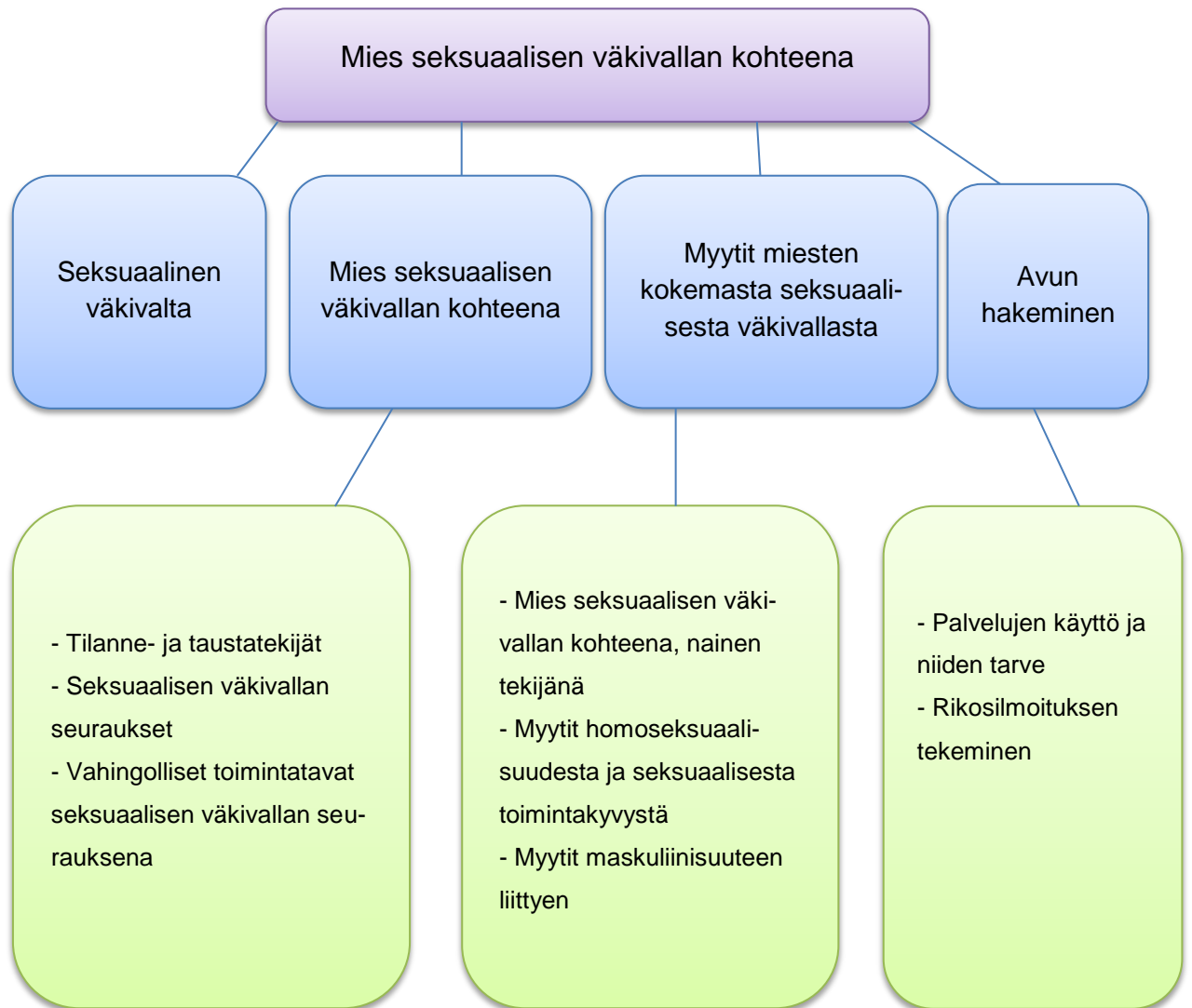
Kuvio 2. Tuloksia havainnollistava luokittelurunko