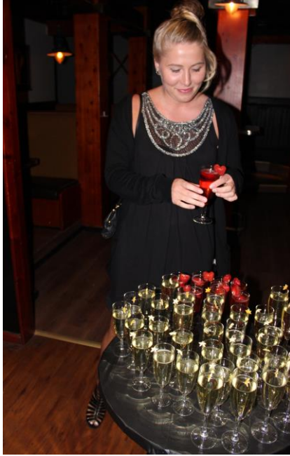
Kuva 1: Alkumaljat