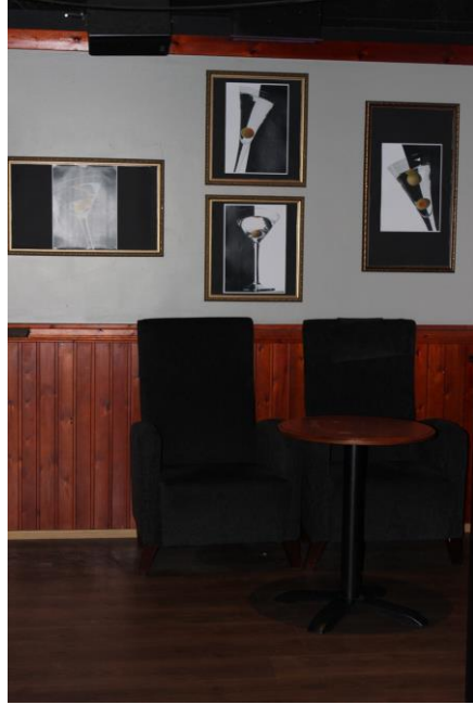
Kuva 2: Julisteet