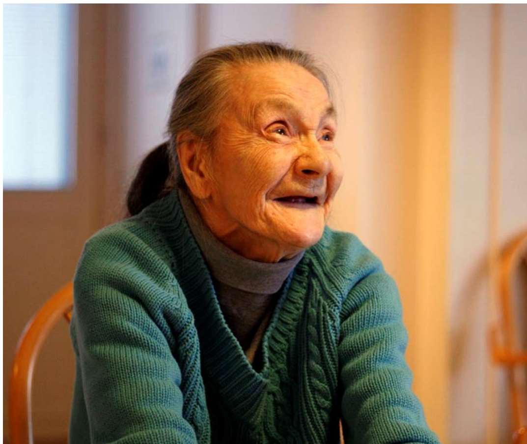
Hetki Rautiosaaren palvelutalolla Rovaniemellä tammikuussa 2013.