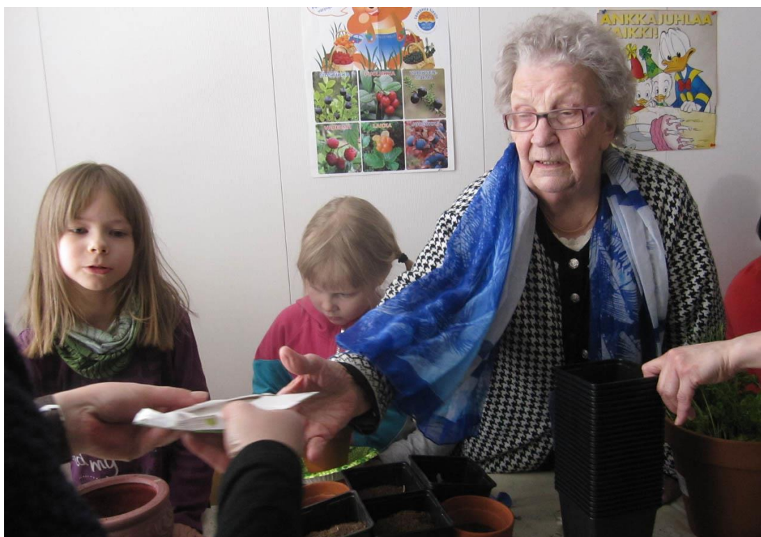
Puutarhaterapiaa Kemijärvellä maaliskuussa 2013.

Hyypän ja Liikasen (2005, 162) mukaan hoitoympäristö ei saa liikaa poiketa siitä, mihin asiakas on aikaisemmin elämässään totunut, muuten laitospaisuus korostuu vieraannuttavalla tavalla. Engström (2013, 13.) toteaa, että hoitotyön ja hoitotyöntekijöiden näkökulmasta taide voi vaikuttaa myönteisesti työtyytyväisyyteen, työympäristön viihtyvyyteen, parantaa lääketieteellisten ja hoitotoimenpiteiden suorittamista ja tuloksia sekä edistää potilaan ja hoitajan välistä vuorovaikutusta. Sillä on myös hyvä vaikutus luottamuksen lisääntymiseen yksilö- ja yhteisötasolla ja lisää yhteenkuuluvuuden tunnetta, onnellisuutta, ystävystymistä. On havaintoa, että kulttuuriin osallistuminen laskee stressitasoa ja verenpainetta sekä parantaa muisti- ja aivotoimintoja. Tukeminen tasa-arvoisessa ja luovassa taiteen tekemisen prosessissa on tärkeämpää kuin tekemisen lopputulos ja yhdessä tekeminen vaikuttaa myönteisemmin terveyteen kuin yksin tekeminen. (Engström 2013, 6; Liikasen 2010, 62-66.)