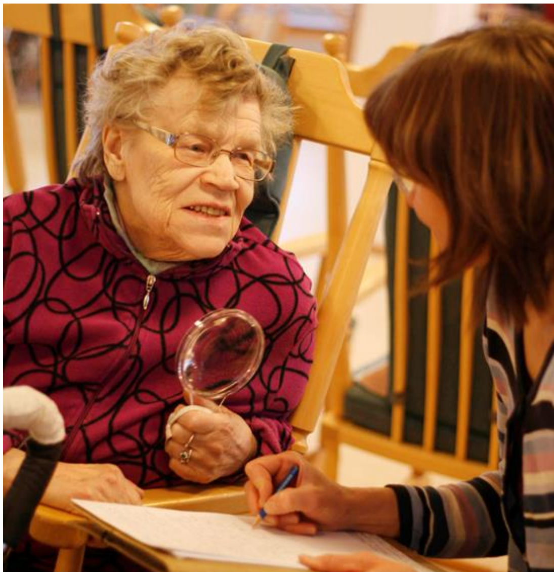
Läsnäoloa ja vuorovaikutusta.