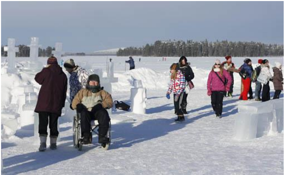
Lunta! Posio-tapahtuma palvelukeskus Valkaman rannassa helmikuussa 2013.

Hankkeen tuloksina syntyvät kuntoutuksen palvelumallit mahdollistavat ikääntyvien kuntalaisten kotona asumisen pitempään ja siten vähentävät paineita palveluyksiköissä. Ikääntyville suunnattu viriketoiminta ja kulttuuripalvelut vahvistavat heidän kokonaisvaltaista hyvinvointiansa ja vähentävät samalla terveydenhuollon palvelutarvetta. Hankkeessa kehitettävillä toimintamuodoilla, kuten kulttuuripalveluilla tuetaan ikääntyvien keskuudessa yhteisöllisyyttä ja toinen toistaan auttamista. (Ikäehyt hakemus, 8.)