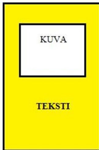
KUVA 1 Julisteiden mallipohja

Julisteiden pohjaväriksi päätettiin keltainen ja tekstin väriksi musta. Valinta tehtiin siitä syystä, että tutkimusten mukaan ihminen havaitsee keltaisen värin ensimmäisenä. Keltaisen värin on todettu stimuloivan aivoja sekä nostavan sykettä ja verenpainetta. On myös huomattu, että musta teksti keltaisella pohjalla on paras väriyhdistelmä. (Hintsanen 2011.) Julisteiden malli ja ulkoasu on nähtävissä alla olevassa kuvassa (kuva 1).