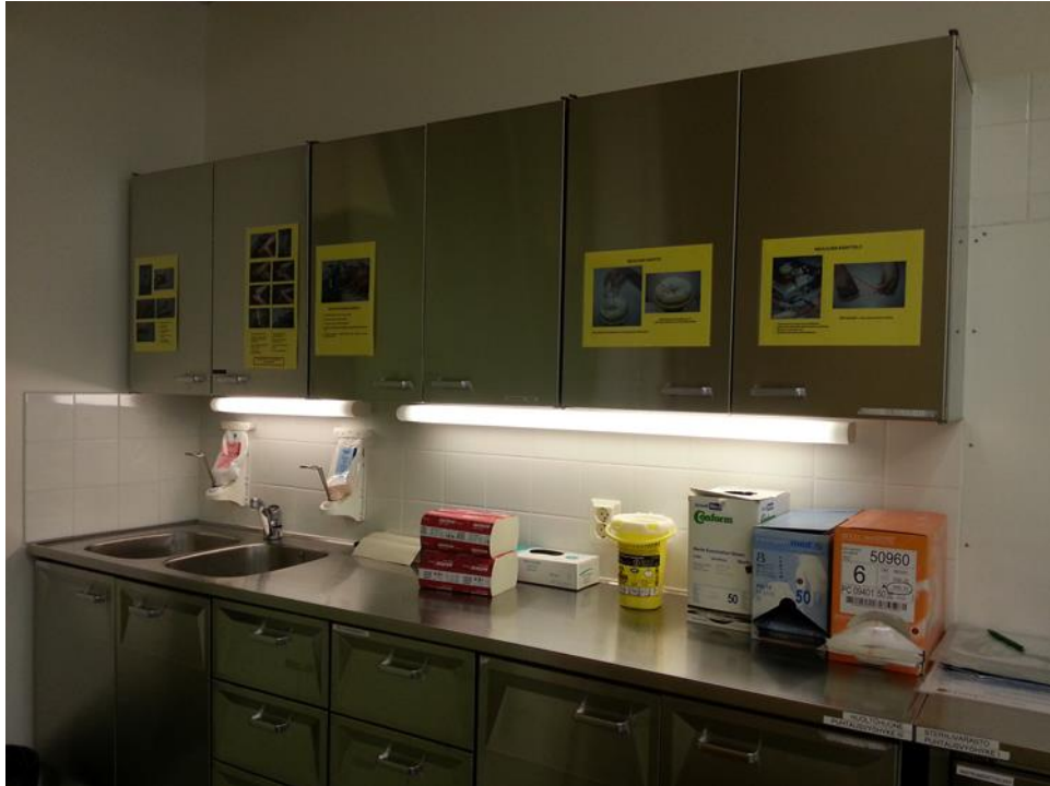
KUVA 2 Julisteiden sijoittelu laboraatioluokassa

heti luokkiin astuttaessa nähtävillä. Tästä syystä paikaksi valittiin luokkien ovien sisäpuoli. Oikeaan ergonomiaan ohjaava juliste päätettiin sijoittaa potilassänkyjen läheisyyteen, koska näillä paikoilla opiskelijat harjoittelevat potilassiirtoja. Neulojen turvalliseen käsittelyyn ja pistotapaturmien ensiapuun ohjaavat julisteet sijoitettiin luokkien keskeiselle paikalle, joista ne tulevat varmasti huomioiduksi. Neulojen hävitys -juliste päätettiin sijoittaa neulojen jäteastian läheisyyteen ja jätehuoltojuliste roskisten läheisyyteen. Alla olevasta kuvasta on nähtävissä julisteiden sijoittelu yhdessä laboraatioluokassa (kuva 2).