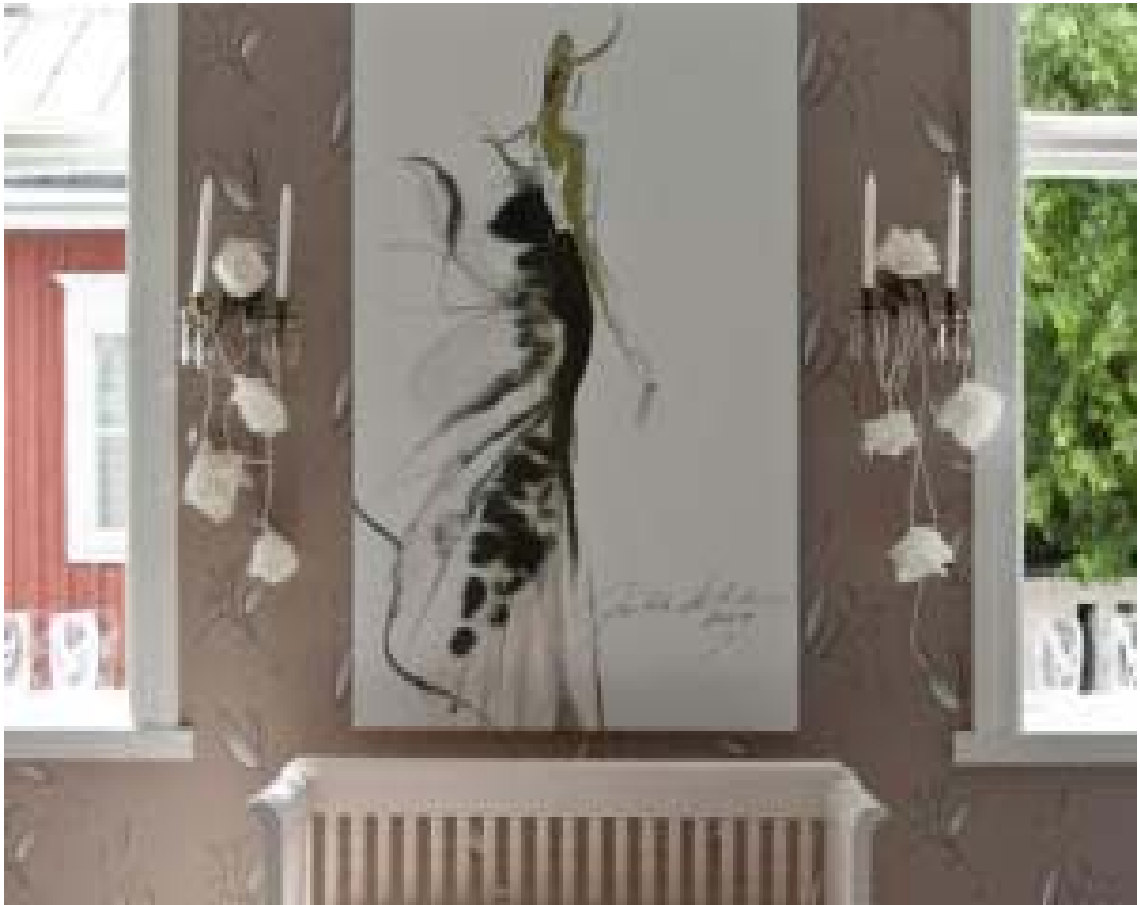
Jukka Rintalan maalaus. Hyypä, Emmi 2012. Suomen Asuntomessut. Knapen talo. < http://www.asuntomessut.fi/content/knapen-talo-jukka-rintalan-maalaus >