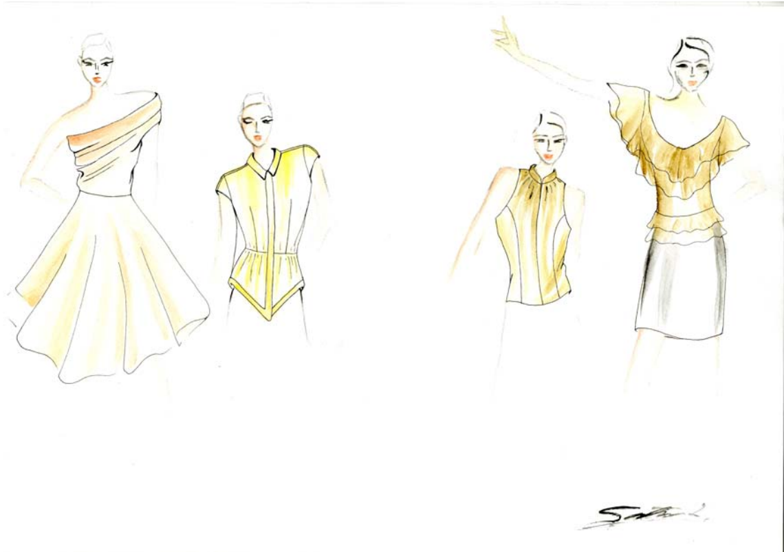
Nopeat luonnokset. Liljeqvist, Satu 2012.