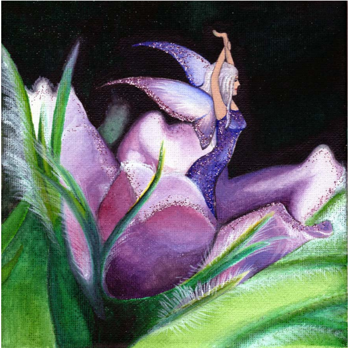
Inspiraatio luonnosta, väreistä ja maalauksesta. Liljeqvist, Satu 2012.