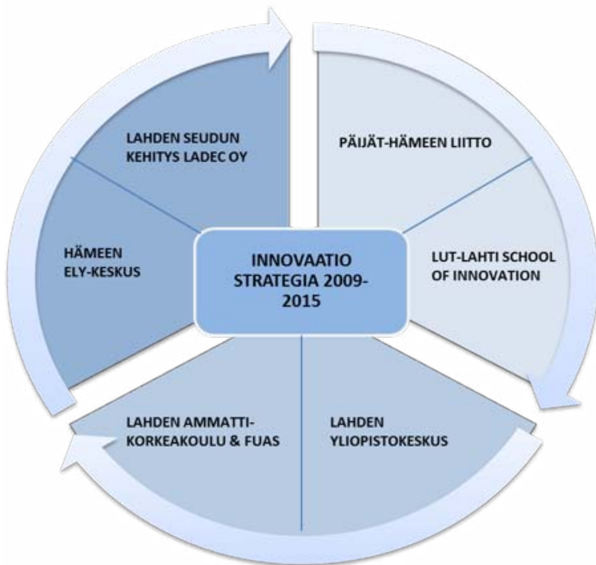
Kuvio 1. Älykkään erikoistumisen alusta Päijät-Hämeessä