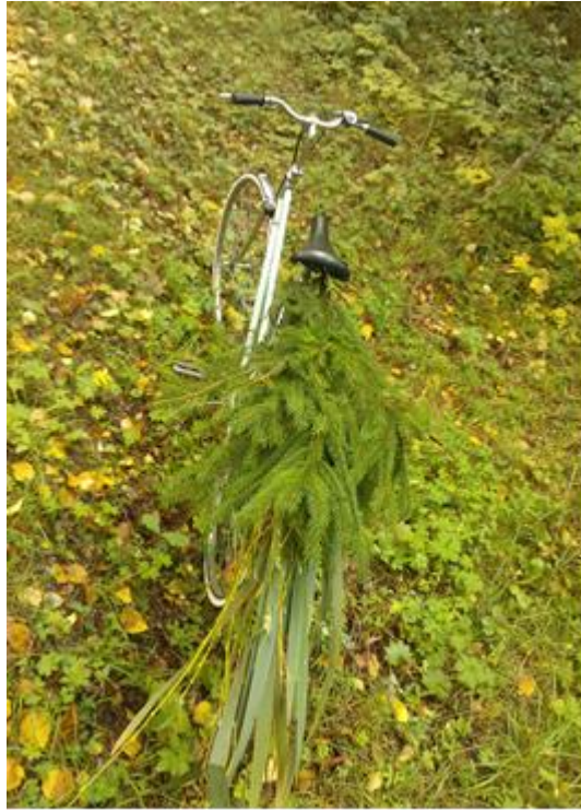
Kuva 12. Opinnäytetyön tekijän uskollinen kulkupeli

Työskentelypäiväni koostuivat pyöräretkistä lähimetsiin, materiaalien keräämisestä ja mietiskelystä. Kotistudion pystytin keittiön pöydän ääreen, koska sateiset ja pimenevät syysillat eivät harmikseni suosineet ulkona tekemistä ja valokuvaamista. Jouduin tekemään melkein kaikki mallit sisällä, lisälampuilla valaisemalla työpöydälläni, jotta sain työvaiheet asiallisesti valokuvaamalla dokumentoitua.