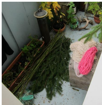
Kuva 14. Syksyinen parveke ja tarviketarasto

Opinnäytetyöni näkemyksen mukaan luonnonmateriaaleista tehtävien käsitöiden ideaalitila olisi se, että asiakkaat ja kuntoutujat keräisivät materiaalit itse luonnosta, jotta eheyttämisen ja virkistyksen kokemus olisi kokonaisvaltainen. Sopivan metsän, keräyslupan ja motoristen taitojen asettamat esteet voivat olla ylitsempääsemättömiä. Ryhmälle tarvitaan kuljetus, jos mennään kaupungin ulkopuolelle, sähkän sopivat ulkoiluvaatteet tulee olla ja tieto siitä, että paikasta löytyy tarvittavaa materiaalia. Tämä vaatii ohjaajalta paljon etukäteisvalmisteluja. Ohjeita tehdessä en itse käynyt luonnossa kuin kerran ryhmän kanssa, jolloin sateinen ilma teki sen monelle epämiellyttäväksi.