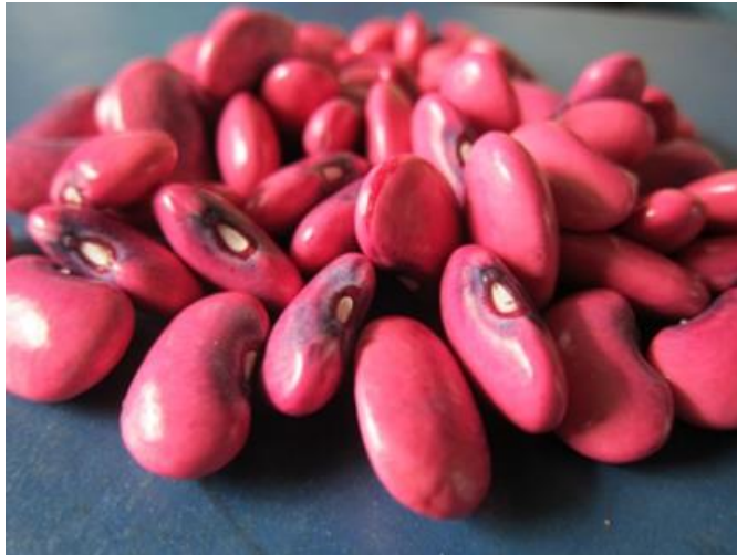
Kuva 2. Värien voimaa