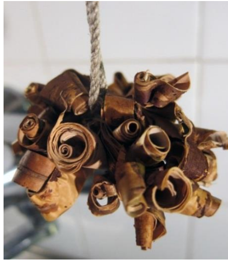
Kuva 8. Tuohinen patapata eli huosiain