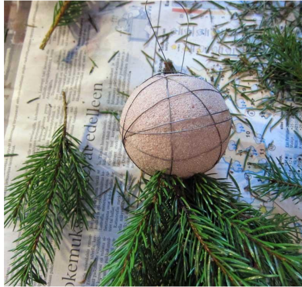
Kuva 9. Havupallon työskentelyvaihe