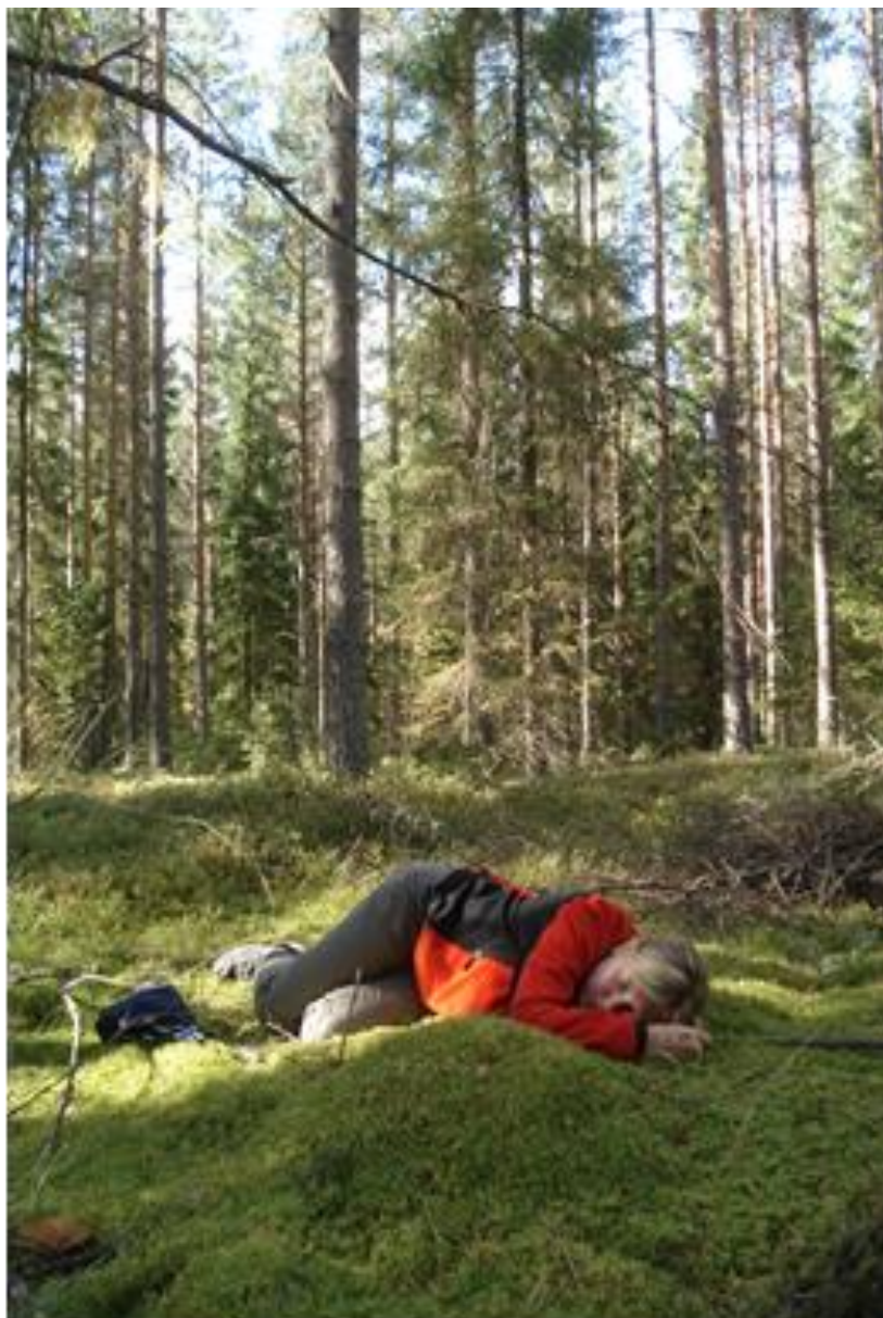
Kuva 7. Luonnon rauhaa kokemassa