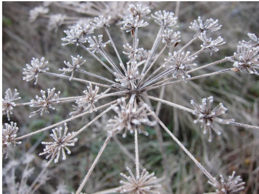
Kuva 10. Luonnon talvista kauneutta

Vastaajat mainitsivat myös, että vuodenaika ja lämpötila vaikuttavat materiaalien valintaan. Vastauksien perusteella talvella käytetään villaa ja tehdään jääveistoksia, kesällä voidaan askarrella pihalla kasveista. Syksyllä tunnelmoidaan sisällä, ja keväällä nikkaroidaan lintupönttöjä kesän tuleville pesueille.