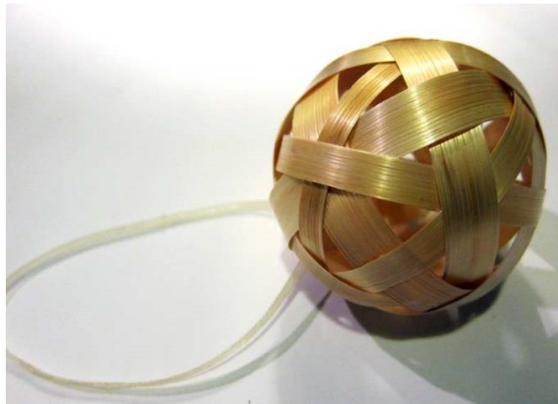
Kuva 11. Oljesta tehty tehty joulukuusenkoriste

Käsitöiden ohjaamisessa tärkeimmäksi nousi tilanteen luominen ja osallistujien positiivinen kokemus. Luontoympäristössä työskentely ei ole aina välttämätöntä, vaikka työskenneltäisiin luonnonmateriaalien parissa. Vastaajien mukaan materiaalit haetaan mieluiten luonnosta, mutta ryhmän ehdoilla. Luonto koetaan yleisesti rentouttavana ja terapeuttisena ympäristönä ja käsitöiden tekeminen mielekkäänä harrastuksena, jolla on myös kuntouttava vaikutus.