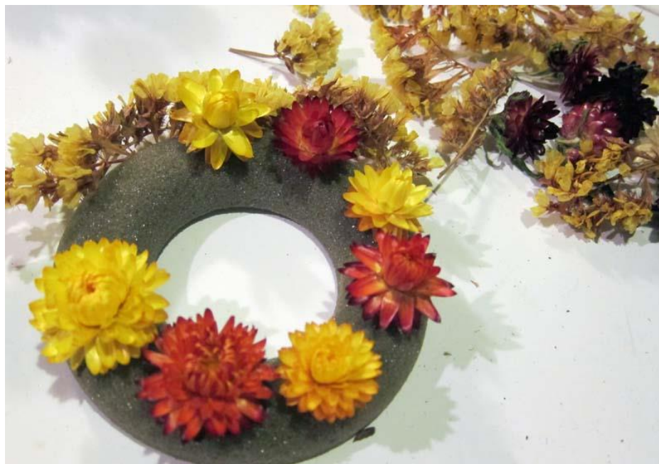
Kuva 13. Kuivakukkakranssi olkikukista ja ikiviuhkoista

Toiminnan kesto on asia, jonka monesti vain harjaantuneet käsitöiden ohjaajat pystyvät arvioimaan tutustuessaan ohjeeseen. He tuntevat asiakkaansa ja tietävät, miten he toimivat, ja varaavat käsityöryhmälle riittävän pitkän ajan tai useampia kertoja. He varaavat materiaalin valmiiksi tai ajan niiden yhdessä hankkimiseen. Työohjeissani arvioitu kesto tarkoittaa vain itse tekemistä, ei materiaalien hankintaa. Kaikissa käsityöohjeissa annettu arvio on monesti suuntaa antava, niin näissäkin ohjeissa.