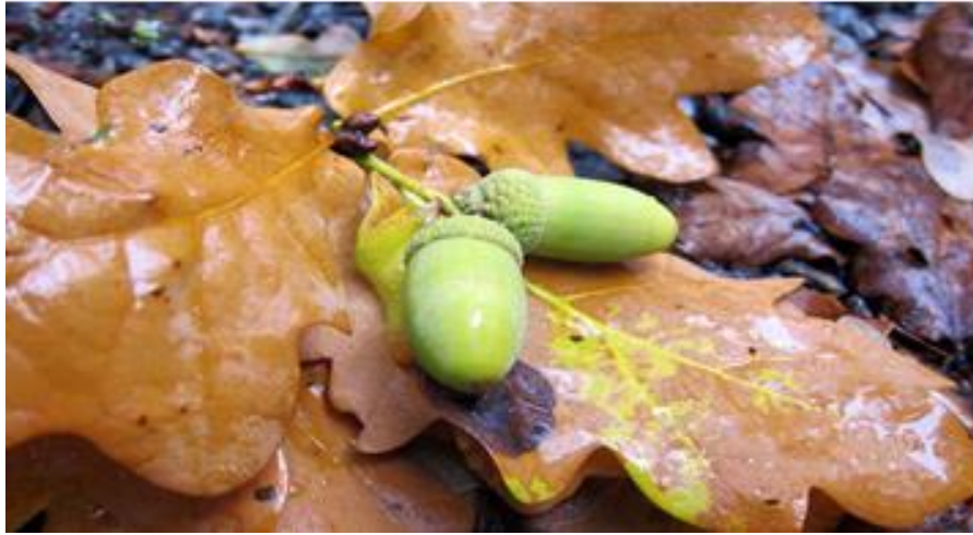
Kuva 6. Luonnon ainutlaatuisista kauneutta

lemalla luonnonmateriaaleja ja tekemällä niistä käsitöitä, voimme samalla ihailia erilaisia, ainutkertaisia ja itsessään täydellisiä luontokappaleita, jollaisia itsekin ihmisinä olemme (Salonen, 2005, 95).