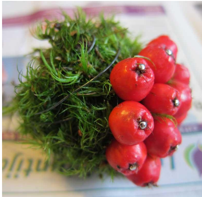
Kuva 4. Pihlajanmarjojen työstöä

Materiaali on tuotettu julkisella, Raha-automaattiyhdistyksen hankerahoituksella, joten se tulee olemaan hankkeen internetsivuilla julkisessa käytössä. Tällöin työn käyttäjiä voivat olla ketkä tahansa, jotka löytävät materiaalin.