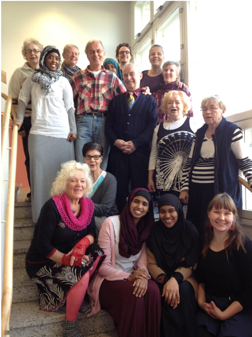
Kuva 6. Koko Tässä olen nyt -työryhmä ensimmäistä kertaa samaa aikaan harjoituksissa 23.10.2012.

Monet kohtaukset ratkesivat vasta aivan viimeisellä viikolla ennen ensi-iltaa. Esityksen loppukohtausta oli yksi niistä. Sen kohdalla kiteytyi jotakin esityksen hengestä vahvasti. Loppukohtauksessa kaikki esiintyjät tulevat yksitellen lavalle seisomaan ja katsomaan yleisöön. Taustalla pyöri nauha, jolla jokainen kertoo missä on juuri nyt. Ohjeeni esiintyjille oli katsoa yleisöön avoimesti silmiin, jos tulisi jokin reaktio niin se saisi tulla. Ajatuksena olisi vaan katsella ja hengitellä, olla tässä ja nyt. Kohtausta oli vahva ja intensiivinen, vaikka mitään ei tapahtunutkaan lavalla. Ihmisten kauneus ja katsekontakti riitti. Siinä tavoitimme jotakin kohtaamisen voimasta.