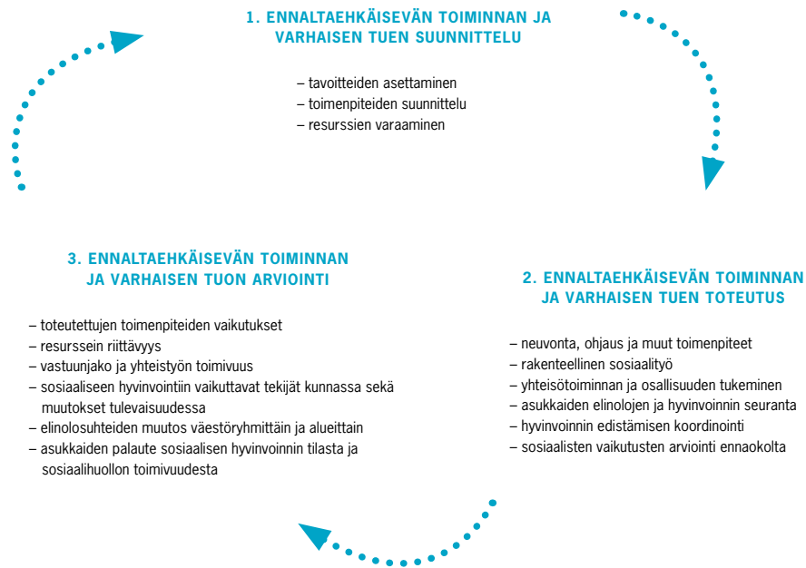
Kuvio 2. Sosiaalihuoltolakiehdotuksen määräykset ennaltaehkäisevästä toiminnasta ja varhaisesta tuesta suunnittelu-, toteutus- ja arviointivaiheessa