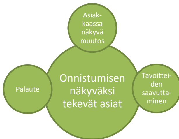
KUVIO 4. Onnistumisen näkyväksi tekevät asiat

Työntekijöiden ryhmäkeskusteluissa onnistumista tarkasteltiin vahvasti asiakaslähtöisyyden sekä työntekijän ja asiakkaan välisen vuorovaikutussuhteen kautta. Vuorovaikutussuhteessa luottamuksella koettiin olevan keskeinen rooli onnistumisen kannalta. Kuvioissa 3 ja 4 esitetyt kategorisoinnit eivät sulje pois toisiaan vaan ne ovat moninaisesti yhteydessä toisiinsa. Esimerkiksi laadukkaan vuorovaikutussuhteen koettiin perustuvan kategorian sisälle kuuluvien tekijöiden lisäksi keskeisesti asiakaslähtöiseen toimintaan liittyviin tekijöihin. Lisäksi yksi olennaisimmista vuorovaikutussuhde-kategoriaan sisältyvistä tekijöistä, luottamus, on vahvasti yhteydessä esimerkiksi resurssit ja aika –