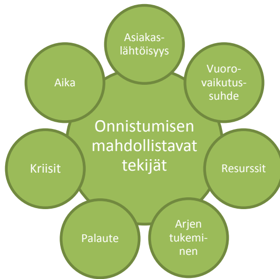
KUVIO 3. Onnistumisen mahdollistavat tekijät