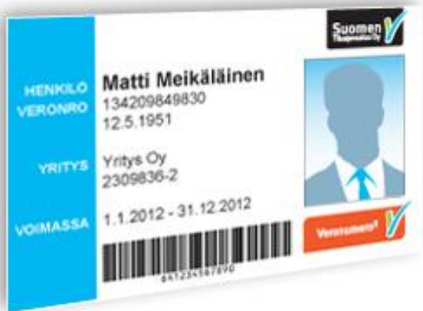
Figur 2. Personkort med bild. (Veronumero, Personkort med bild)

Förutom detta behövs det flera åtgärder än de som existerar redan. Arbets- och näringsministeriet har en arbetsgrupp som försöker förebygga den grå ekonomin i samarbete med Rakennusteollisuus och Rakennusliitto. I gruppens utredningar har man kommit till att det skulle behövas ändringar i lagarna samt ökad övervakning. Andra viktiga åtgärder skulle vara att huvudentreprenören skulle vara skyldig att meddela skatteverket om alla arbetstagares uppgifter samt beloppen på underentreprenörernas kontrakt. Dessutom borde övervakningen skärpas. I beställaransvarslagen borde finnas mer specifika punkter med hjälp av vilka man bättre kunde förebygga grå ekonomi. Sådana specifikationer vore t.ex. att höja försummelseavgiften till 50 000 euro istället för den nuvarande avgiften på 16 000 euro. Beställaransvarslagens utredningsskyldigheter borde krävas i all verksamhet. Rakennusteollisuus stöder fullt dessa åtgärder även om det skulle orsaka tilläggskostnader på flera tiotals miljoner euro för företagen. (Arbets- och näringsministeriet, Talousrikollisuuden ja harmaan talouden torjuminen rakennus sekä majoitus- ja ravitsemisalalla-työryhmä mietintö 2011.)