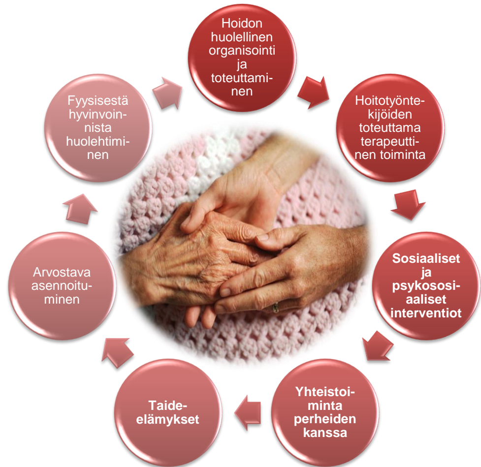
Kuvio 2. Masennuksen lääkkeettömän hoidon auttamismenetelmät vanhuksilla