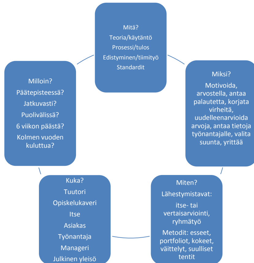
Kuva 2 Arviointia määrittelevät kysymykset (Pickford & Brown 2006, 4)

Pickfordin ja Brownin (Pickford & Brown 2006, 4) mukaan arviointia määrittelevät kysymykset voisivat olla seuraavat: