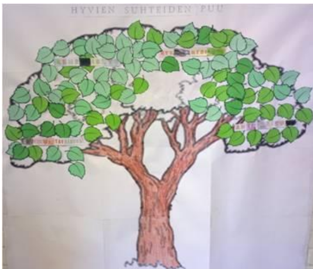
KUVA 5. Hyvien suhteiden puu. Hyväntahtoisuus

Neljännän tuokion aiheena oli hyväntahtoisuus (Kuva 5). Tuokio meni sujuvasti ja lapset osallistuivat mielellään toimintaan ja muun muassa kertoivat, mitä tekivät viikon aikana hoidakseen puuta ja liimasivat lisää lehtiä puuhun sekä pohtivat, mitä hyväntahtoisuus tarkoittaa.