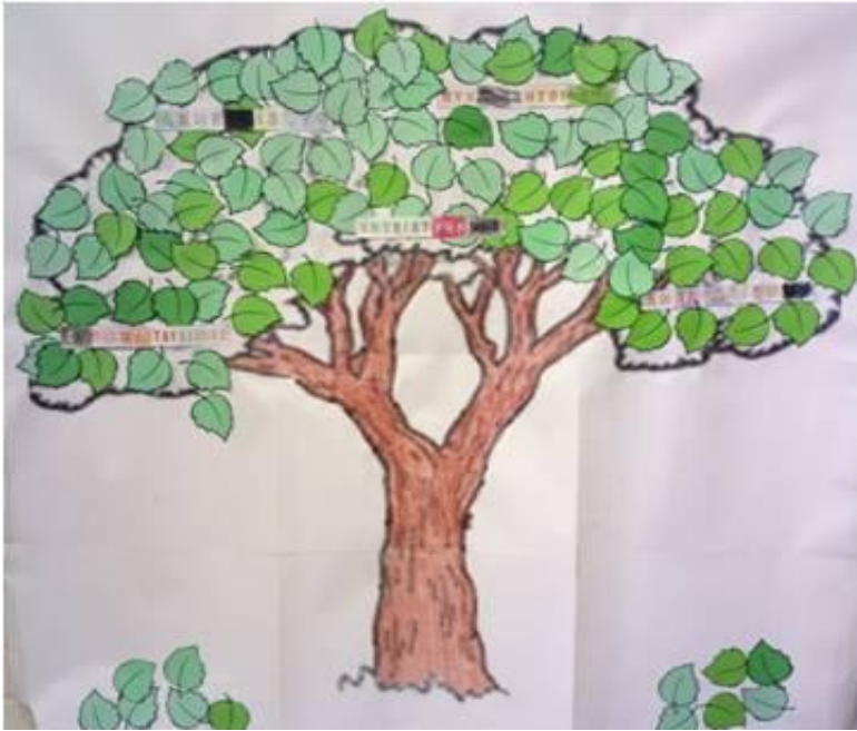
KUVA 6. Hyvien suhteiden puu. Yhteistyökyky

Viimeisen tuokion aiheena oli yhteistyökyky (Kuva 6). Lapset olivat innostuneina viimeisestä tapaamisesta ja odottivat hetkeä, kun he voivat viimeistellä puuta. Lapset mielellään kertoivat, miten hoitivat puuta viikon aikana ja liimasivat lehtiä puuhun. Kaikkiin tuokion toimintaan lapset osallistuivat innokkaina. Lopuksi jaoimme ryhmän toimintaan osallistuneille kunniakirjat. Pohdimme yhdessä, mikä oli meidän toimintaamme yhteistavoitteena, jonka jälkeen lapset saivat mahdollisuuden viimeistellä hyvien suhteiden puuta, mitä he mielellään tekivätkin.