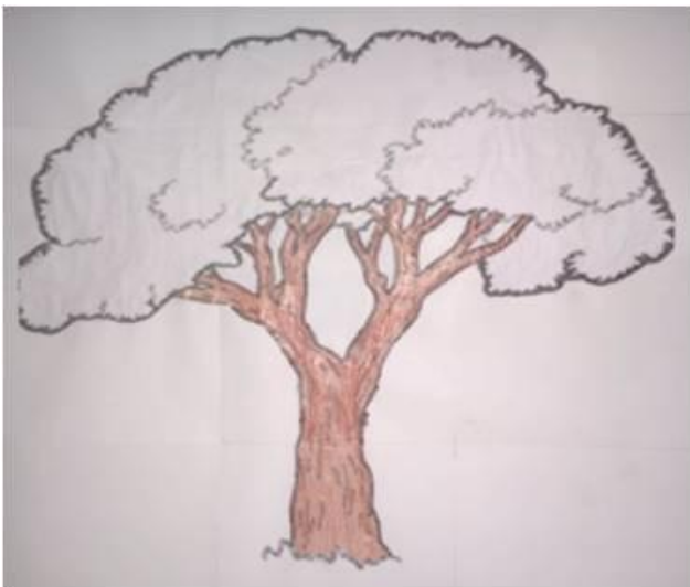
KUVA 1. Hyvien suhteiden puu

Toimintaamme varten valmistimme isolle paperille piirretyn puun (Kuva 1). Lasten tehtävänä oli hoitaa puuta ja auttaa sitä vihertymään. Puu sisälsi viisi ominaisuutta, joiden avulla tuokiot etenivät. Vihertävä puu oli lopputavoite, johon lapset pyrkivät rakentaen hyviä suhteita keskenään ja harjoitellen ominaisuuksia, joiden avulla puu alkoi vihertyä.