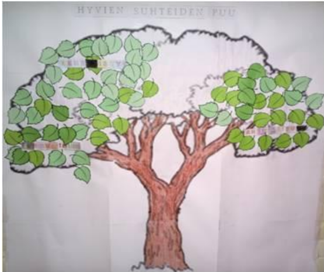
KUVA 4. Hyvien suhteiden puu. Rehellisyys

Kolmannessa tapaamisessa, jonka aiheena oli rehellisyys (Kuva 4), huomasimme, että lapset tottuivat jo tuokioiden rakenteeseen, ja ennakoivat sen kulkua. He kertoivat innostuneina, miten hoitivat puuta viikon aikana ja liimasivat lisää lehtiä puuhun huomaten, että se vihertyy yhä enemmän.