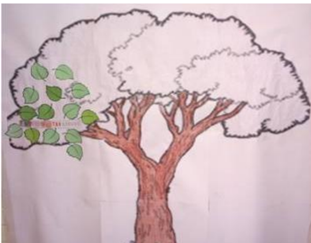
KUVA 2. Hyvien suhteiden puu. Anteeksiantavuus

Ensimmäisen tuokion aiheena oli anteeksiantavuus (Kuva 2). Ensimmäinen tapaaminen on erittäin tärkeä osallistujien motivaation lisäämisen kannalta. Ensikohtaamisella ryhmän jäsenillä muodostuu ensivaikutelma toisista sekä koko ryhmän toiminnasta. (Toivakka & Maasola 2011, 52.) Tuokion alussa kävimme esittelykierroksen. Sitten esittäydyimme lapsille ja kerroimme ryhmän aikataulusta ja tavoitteista, miksi ryhmässä ollaan ja mitä tehdään. Sen jälkeen esittelimme hyvien suhteiden puuta ja kerroimme, että ryhmän tehtävänä on auttaa puuta vihertymään. Keskustelimme lasten kanssa siitä, millä tavalla voimme hoitaa hyvien suhteiden puuta ja mitä hyvät suhteet tarkoittavat.