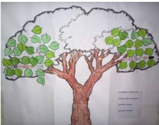
KUVA 3. Hyvien suhteiden puu. Anteliaisuus

Toisen tuokion aiheena oli anteliaisuus (Kuva 3). Lapsille oli vaikea ymmärtää, mitä anteliaisuus tarkoittaa. Keskustelimme aika pitkään siitä, että anteliaisuus on antamista ja jakamista. Voimme antaa tavaroiden lisäksi myös halia, aikaa ja ystävyyttä. Lapset pohtivat, miten vaikeaa voi olla antaminen ja jakaminen ja toisaalta miten hyvältä tuntuu, kun joku antaa omastaan.