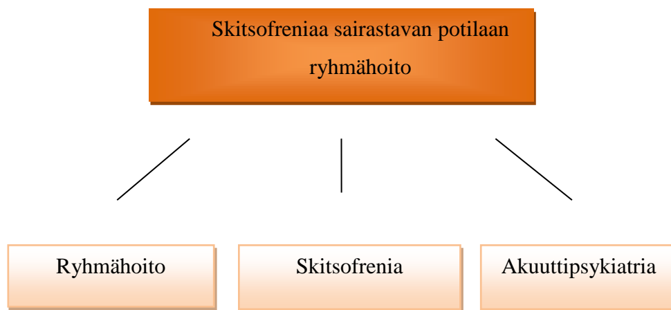
KUVIO 1. Teoreettiset lähtökohdat

Tämän opinnäytetyön aiheena on skitsofreniaa sairastavan potilaan ryhmähoito akuutti-psykiatrian osastolla. Opinnäytetyön keskeisiksi käsitteiksi nousivat ryhmähoito, skitsofrenia ja akuutti-psykiatria (Kuvio 1). Teoreettisten lähtökohtien määrittelyn olemme tehneet kirjallisuuden perusteella.